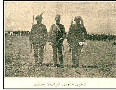
Arhavi Taburu Efradından Bazıları