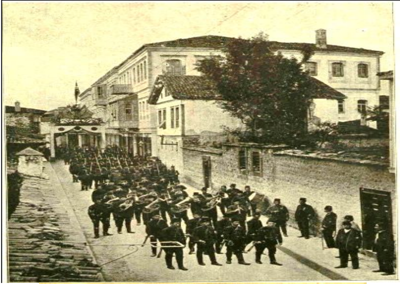
Teselya gazilerinden Trabzon Alayı'na mensûb efrâd-ı şâhânenin dâ'ire-i hükûmet pîşgâhına kurulan tak-ı zaferden mürûrları