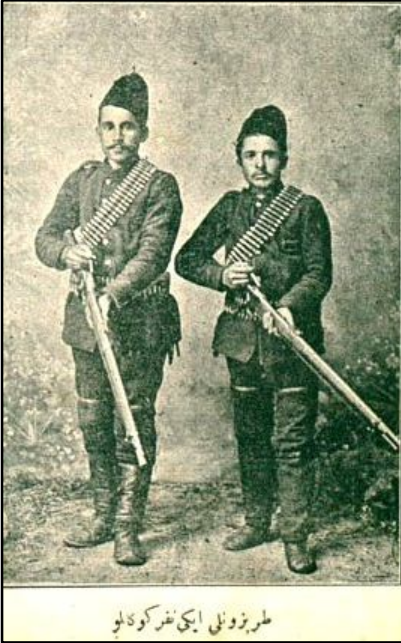
Trabzonlu İki Nefer Gönüllü