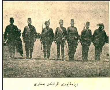
Rize Taburu Efradından Bazıları