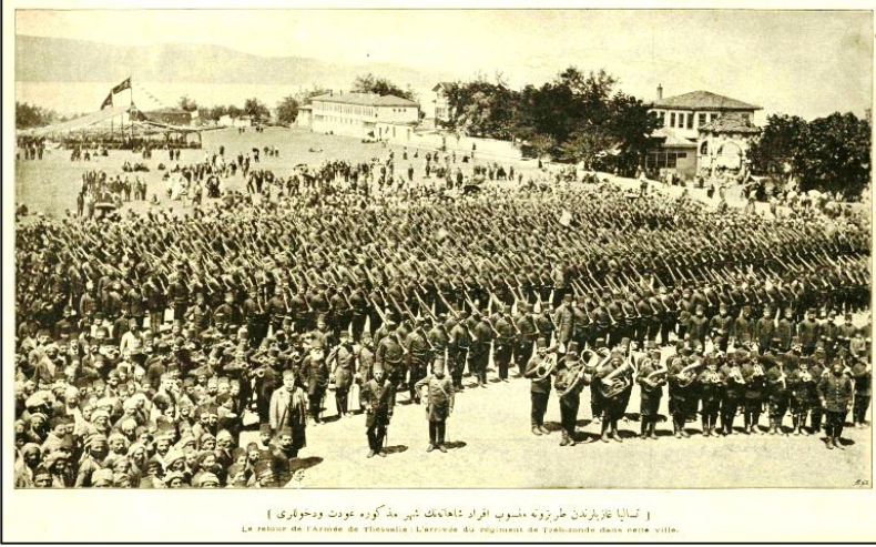
Teselya gazilerinden Trabzon'a mensûb efrâd-ı şâhânenin şehri mezkûra avdet ve duhûlleri