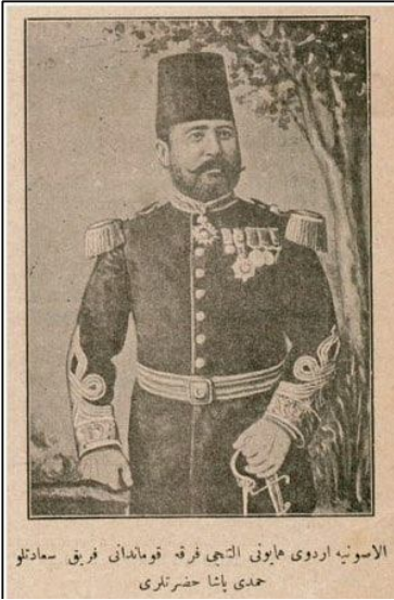
Alasonya Ordu-yı Hümayunu 6. Fırka Kumandanı Ferik Saadetli Hamdi Paşa