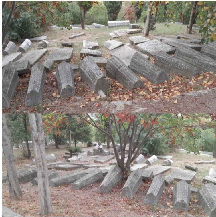
Resim 1. Ortaköy Musevi Mezarlığı Sanduka Mezar Taşı Örnekleri.

İstanbul'daki Musevi dini ve kültüründeki geleneksel yatay kitabelerin (mezar işaret taşının) zamanla bulunduğu toplumun kültür ve inançlarından etkilenerek dikey kitabe şeklini aldığı görülmüştür. İşaret taşlarındaki süslemeler, motifler ve mimari yapıların vefat eden kişinin yakınları tarafından isteğe bağlı olarak yaptırıldığı Musevi mezarlıklarından sorumlu ve görevlilerince öğrenilmiştir. Bu kapsamda, İstanbul'daki Musevi mezarlıklarında İslam dini ve kültürünü yansıttığı düşünülen sanduka şeklindeki mezar taşlarının kullanıldığı da tespit edilmiştir (Altıntaş, 2022, s.2).