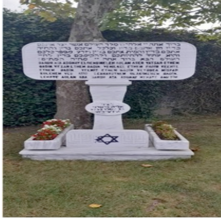
Resim 5: Ulus Aşkenaz Musevi Mezarlığı. Kadiş Duası.