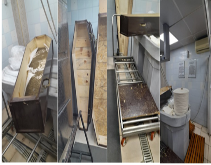
Resim 6. Rehitsa Binası İçi.

İstanbul'da yıkama, kefenleme yapılan faal tek Rehitsa (yıkama) binası Ulus Sefarad Musevi Mezarlığındadır. İstanbul ilinde diğer Musevi mezarlıklarında Rehitsa (yıkama) bölümü yoktur. Eski dönemlerde Rehitsa (yıkama) bölümü olanlar varsa bile günümüzde kullanım dışıdır.