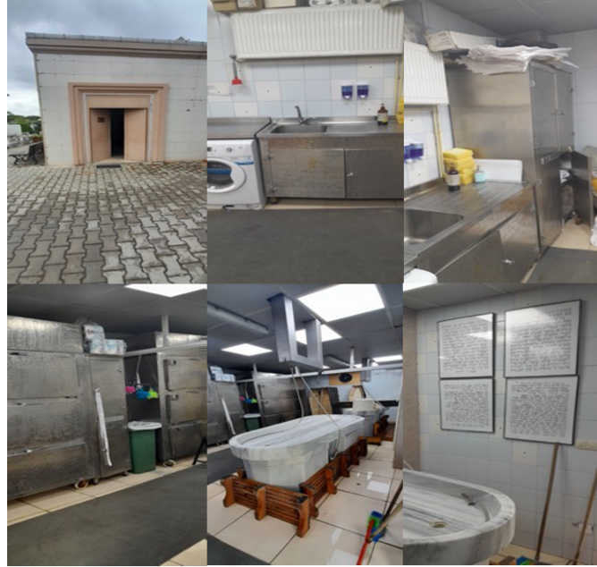
Resim 7. Rehitsa Binası ve İçi.

İstanbul'da yıkama, kefenleme yapılan faal tek Rehitsa (yıkama) binası Ulus Sefarad Musevi Mezarlığındadır. İstanbul ilinde diğer Musevi mezarlıklarında Rehitsa (yıkama) bölümü yoktur. Eski dönemlerde Rehitsa (yıkama) bölümü olanlar varsa bile günümüzde kullanım dışıdır.