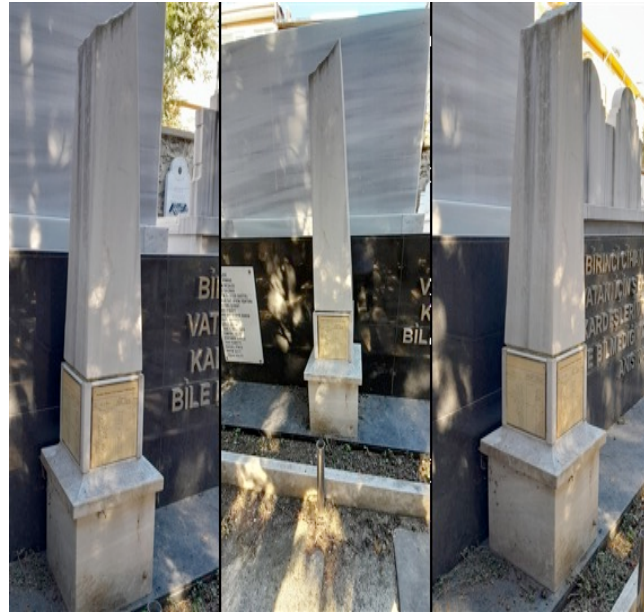
Resim 9. Acıbadem Musevi Mezarlığı. Kırık Başlı Mezar taşı Sütunu.

Yüzyıllar öncesinden Anadolu'ya gelen Musevilerin Osmanlı Devleti'nin bağımsızlık mücadelesinde vatan olarak gördükleri topraklar için verdikleri şehitler adına oluşturulan anı köşesi tespit edilmiştir (Resim 8).