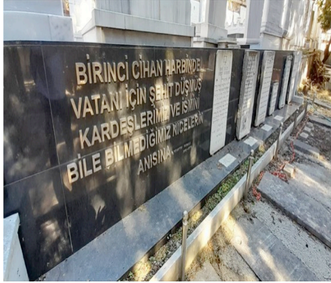
Resim 8. Acıbadem Musevi Mezarlığı. Şehitlik Köşesi.

Yüzyıllar öncesinden Anadolu'ya gelen Musevilerin Osmanlı Devleti'nin bağımsızlık mücadelesinde vatan olarak gördükleri topraklar için verdikleri şehitler adına oluşturulan anı köşesi tespit edilmiştir (Resim 8).