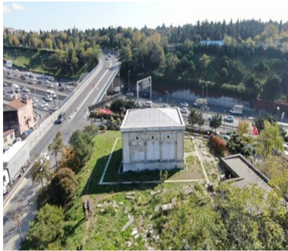
Resim 3. Kamondo Anıt Mezarı. Hasköy.