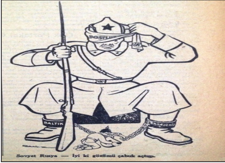
Resim-2: Vatan , 14 İkteşrin(Ekim) 1940.

kendisini savaşın içinde buldu. Savaşın başladığı tarihte Sovyetler ile İngiltere arasında hiçbir anlaşma yoktu. 1939'da Sovyetler ile İngiltere ve Fransa arasında bir işbirliği anlaşması için görüşmeler başlamıştı. Sovyetlerin de savaşa katılmasıyla birlikte, İngiltere ile Sovyetler Birliği arasında bir ittifak ortamı oluştu. Bunun sonucu olarak; iki ülke arasında 12 Temmuz 1941 tarihinde, nicelik ve de nitelik belirtmeksizin tarafların birbirine yardım etmesini kapsayan "Ortak Hareket Antlaşması" imzalandı. 62