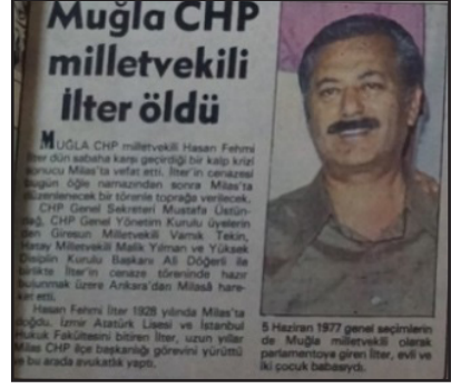
Resim 2: Ara Seçime Doğru (Yeni Asır, 5 Haziran 1978)