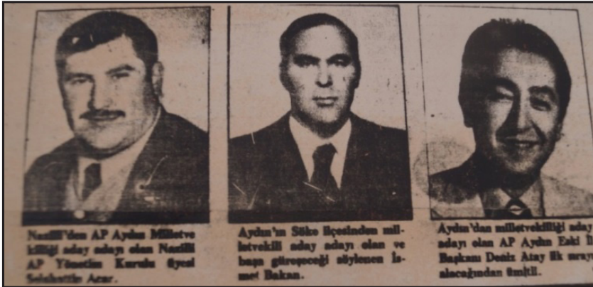
Resim 8: AP Aydın Önseçimlerinde Öne Çıkan Adaylar (Ekspres, 18 Ağustos 1979)