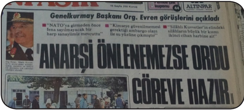
Resim 1: Ordunun Erken Ültimatomu (Yeni Asır, 28 Ağustos 1978)

eder. Esat Kıratlıođlu'na göre ordu ihtilal için uygun ortam oluşması için olaylara pek müdahale etmemektedir. 18 Bu iddiayı ispatlamak güç olsa da şiddet Ecevit hükümetinin sonunu getirdiđi gibi Demirel Hükümeti'nin de sonunu hazırlar. Demirel, "Türkiye Takrir-i Sükûn dönemine dönemez ve bu iş askeri mülahazalarla çözülemez" demesine rağmen 12 Eylül 1980 askeri bir müdahalenin önüne geçilemez. Darbe sonrasında tüm siyasi partiler kapatılır. 19 İhtilal öncesinde 24 Ocak 1980 kararları alınarak Türk Ekonomisi liberalleştirilir. TBMM Eski Başkanı ve dönemin Maliye Bakanı İsmet Sezgin, 24 Ocak Kararlarının alınmasından ordunun memnun olduğunu belirtir. Söz konusu kararların alınmasında etkili olan teknokratlardan Turgut Özal'ın, askeri müdahale sonrasında siyasete girmesine izin verilir. İsmet Sezgin ise ihtilal sonrasında tutuklanmaz. 20