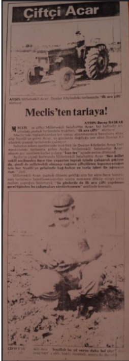
Resim 12: Çiftçi Acar (Yeni Asır, 16 Nisan 1980)

Acar, eşek olayını sadece bir protesto şekli olmaktan çıkarıp, tam bir kimlik meselesi haline getirir. Burada övünülecek köylü-taşralı kimliğidir. Acar şöyle der: “Bazıları merkeple sağa-sola gitmemi yadırgamış. Vekil olduğumda da merkebe binebilirim. Aslımı inkâr etmiyorum. Köylüyüm, köylünün temsilcisi olacağım. AP’liyim ama tüm halkıma hizmet edeceğim.” 53 Kimlik siyasetine dönük olarak Acar, bazen ayağında çarık geçirip başına şapka takarak köylüyle birlikte çapa yapar. Okul bitirmemiş Acar, modern çağlarda kimlik üzerinden siyasetin yürütüldüğünü kavramış durumdadır. Acar, vekil seçildikten sonrada aynı tavrı sürdürür. Bu durum onu unutulmaz kılar. Acar, 14 Ekim 1979’da vekil seçilir. 1980 baharında köyüne geri dönüp memleketi Dualar köyünde çift sürer. Pamuk ekimi yapar.