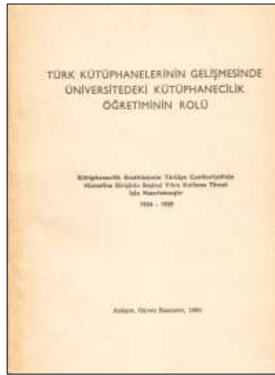
Fotoğraf 6. Türk Kütüphanelerinin Gelişmesinde Üniversitedeki Kütüphanecilik Öğretiminin Rolü

tanıtılarak benimsetilmesi ve işbirliği sağlamak amacıyla Kütüphanecilik Aylık Mesleki Dergisi ve 1975-1979 yılları arasında Türk Kütüphaneciler Derneği İzmir Şubesi tarafından 12 sayı olarak yayınlanan Kütüphane Dünyası dergileri de akademik ve mesleki yeniliklerin, düşüncelerin, çözüm önerilerinin paylaşılmasında kütüphanecilik literatürüne katkı sağlamıştır. Kütüphanecilik bilimi ve mesleğini temsil eden bu dergilerin yanı sıra kütüphanecilik alanındaki çalışmalar, Belleten , Türk Yurdu , Türk Kültürü , Tarih Araştırmaları Dergisi gibi akademik/popüler dergiler ile Ankara ve İstanbul Üniversitelerinin fakülte ve enstitü dergilerinde sıklıkla yayınlanmıştır.