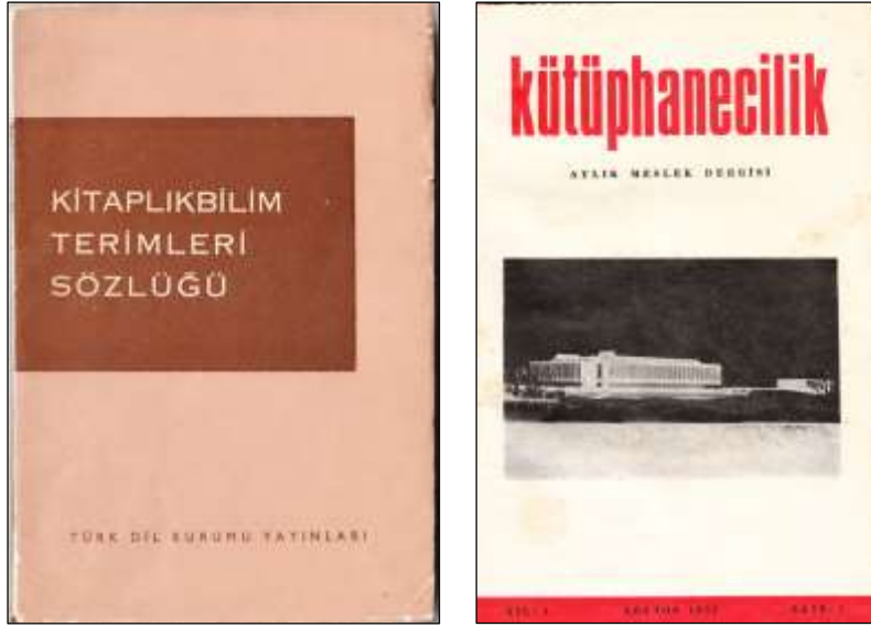
Fotoğraf 7-8. TDK'nın 1974'te yayınladığı Kitaplıkbilim Terimleri Sözlüğü ve 1972'de yayınlanmaya başlayan Kütüphanecilik dergisi