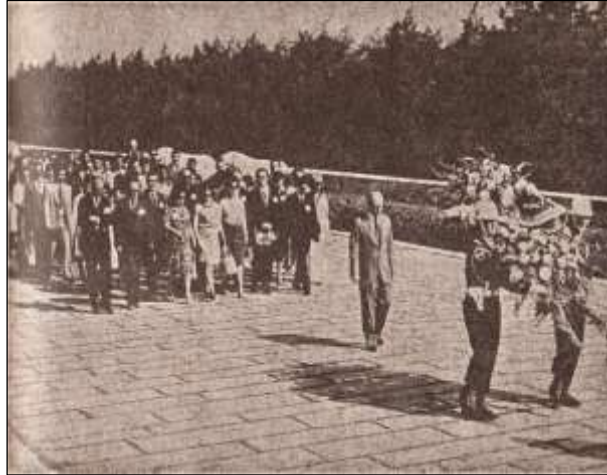
Fotoğraf 4. 1974 Yılı Kütüphane Haftası kutlamaları sırasında kütüphanecilerin Anıtkabir'i ziyareti

Türk Kütüphaneciler Derneği Bülteni (TKDB)'de 1960 sonrası dönemde araştırma makalelerinin nicel bir artış gösterdiği saptanmıştır. Bu artışın temel nedeni, üç kütüphanecilik bölümünün de bu dönem içindeki katkıları ile açıklanabilir. 1950'li yıllarda dergide yer alan makalelerin çoğu halk ve çocuk kütüphaneleri, gezici kütüphaneler, kütüphanelerdeki kurallar, Osmanlı mirası kütüphaneleri konularına yer verirken söz konusu dönem araştırma makalelerinde en çok işlenen konu "kütüphane ve bilgi hizmetleri faaliyetleri"dir (Yontar ve Yalvaç, 2000).