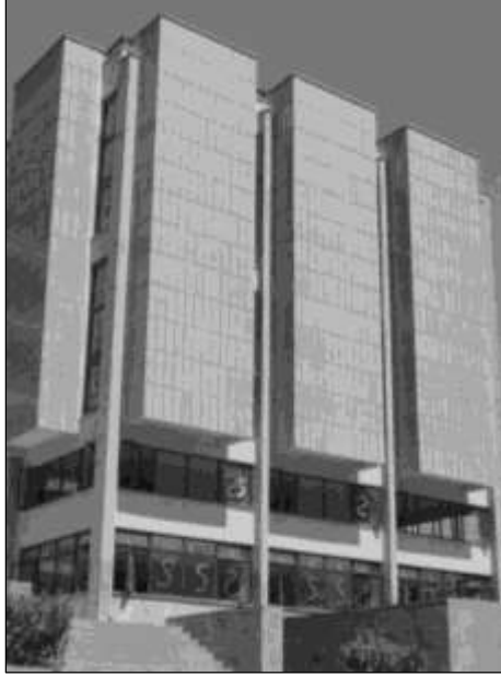
Fotoğraf 3. Ankara Üniversitesi Dil ve Tarih-Coğrafya Fakültesi Kütüphane Binası

1960-1980 yılları arası kütüphaneciliğimizin planlı kalkınma ve kurumsal/mesleki gelişim açısından uluslararası platformda da önemli girişimlerin yaşandığı dönemdir. Birçok Avrupa ülkesi, ABD ve Japonya, Dünya Savaşları sonrasında meydana gelen yeni siyasi, ekonomik ve bilimsel ortamda, bilgi üretiminin yeniden yapılandırılması, bilgi kaynaklarının paylaşımı, bilgiye kütüphaneler ve diğer bilgi merkezleri aracılığıyla erişimin kolaylaştırılması amaçlarıyla uluslararası örgütlerin kurulmasına önem vermişlerdir. Bu örgütler arasında kütüphanecilik ve enformasyon bilimleri ile doğrudan/dolaylı olarak ilgilenen ve bu alanlara yönelik çalışmaları bulunan IFLA (International Federation of Library Associations and Institutions - Uluslararası Kütüphane Dernekleri Federasyonu), ICA (International Council on Archives - Uluslararası Arşiv Konseyi), CENTO (Central Treaty Organization-Merkezi Antlaşma Teşkilatı) ve UNESCO * da yer almaktadır. 1950'de IFLA 'ya üye olan Türk Kütüphaneciler Derneği ve 1952'de Milli Kütüphane Bibliyografya Enstitüsü'nün kurulmasıyla UNESCO ile iletişime başlayan Türkiye, bu dönemde kütüphanecilik alanındaki güçlü devletlerin de katılımıyla bilgi-iletişimi, bilgi denetimi ve uluslararası bilgi paylaşımı konularında yeni arayışlara girmiştir. Bu sivil toplum kuruluşları ile