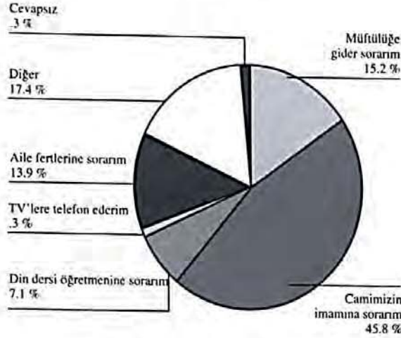
Tablo 2: Dinî Problemleri Çözme Yöntemi