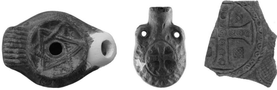
Resim 4. Basmane Mevki kazılarında ele geçen Erken Bizans Dönemi kandilinin diskusu üzerinde Davut Yıldızı tasviri, ortada aynı yüzyıla tarihlenen ampulla ve sağda, haç bezemeli matara gövde parçası

Erken Bizans Dönemine ait kandillerin dışında hemen aynı tarihsel süreçten, MS 4./5. yüzyıla tarihlendirilen Smyrna'da bulunmuş olan bir yazıt ise bir Sinegog'un onarıldığı bilgisini vermektedir ki bu topluluğun varlığının önemli bir kanıtı durumundadır. Bu yazıtta göre, bir Presbyter (din görevlisi) olan (Jakop'un oğlu) bir kişi kendisi, karısı ve çocuğu adına bir Sinegog'un taban döşemesi ve oturma yerlerinin düzenlenmesi hususunda maddi destek sağlamıştı (Petzl, 1987, s. 315-316, No. 844). Agora Hamamı Kazılarında yukarıda sözünü ettiğimiz yıldız tasvirli kandillerin yanı sıra yine aynı tarihlerden, MS 5.-7. yüzyıllara tarihlendirilen, haç tasvirli kandil örneklerine ulaşılması Agora Hamamı'nı kullanan farklı grupların farklı tasvirlerle sahip kandilleri, modern Yahudi anlayışının yıldız tasvirini referans almadığını da dikkate alarak, tercih etmiş olabileceğinin bir işareti olarak değerlendirilebilir. Yahudi topluluğun Smyrna'daki varlığına ilişkin arkeolojik buluntular 13. yüzyıla kadar şimdilik sessizdir ve ancak başkaca kaynaklardan, örneğin 1207'de, Kuşadası'ndan bir grup Yahudinin Smyrna'ya göç ettiği öğrenilmektedir (Bora, 2015, s. 13-14, dipnot 14).