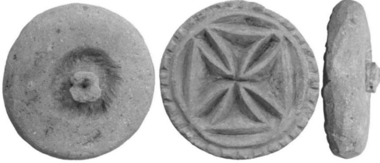
Resim 6. Pişmiş toprak ekmek mührü