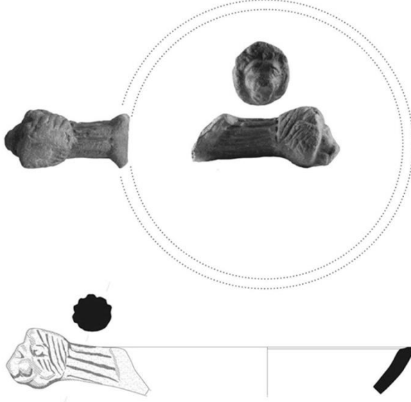
Resim 2. Aslan başlı tutamağa sahip patera kulp ve tamamlama önerisi

Bununla birlikte ticari bir alan olarak Agora'da bu tür dinsel veya günlük kap formlarının satıldığını da göz ardı etmemek gerekir.