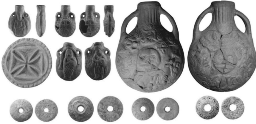
Resim 7. Altınpark Kazılarında ele geçen Bizans Dönemi pişmiş toprak ve kemik objeler. Solda üstte Ampulla örnekleri, solda ortada ekmek mührü ve Ampulla örnekleri, sağda Paganik tasvirler içeren Matara, alt sırada kemik ağırsaklar

şekillendirilerek mühür haline getirildiği bilinmektedir (Köroğlu ve Perk, 2010, s.531).