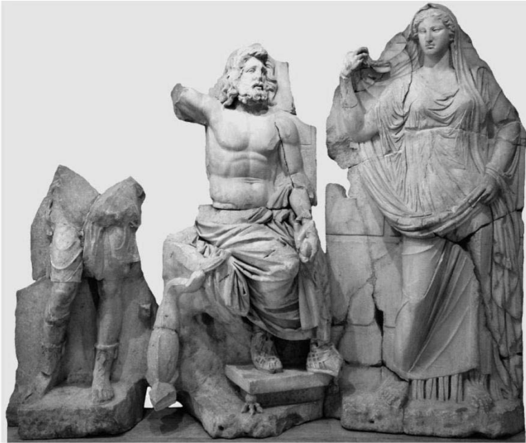
Resim 1. Smyrna Agorası'ndan ele geçen heykel grubu. Artemis-Poseidon- Amphitrite

İbadet alanları için diğer birçok antik kentte gördüğümüz gibi, Smyrna'da da kentin çoğunlukla kalabalıkların uğrak noktaları olan örneğin Agoralar, Liman çevresi ve görünürlüğü açısından kentin sur içinde kalan tepe ve tepelikleri seçilmişti. Şehirlerin surları dışında da ibadet noktaları yok değildi ancak sayıca daha azdır. Strabon, Pausanias, Aristeides ve benzeri antik kaynakların yanı sıra yüzey araştırmaları ve arkeolojik kazılar ile ortaya çıkarılan somut epigrafik buluntular kentin kuruluş yüzyıllarında saygı gösterilen çok sayıda Olymposlu Tanrılar ile karşı karşıya olduğumuzu göstermektedir.