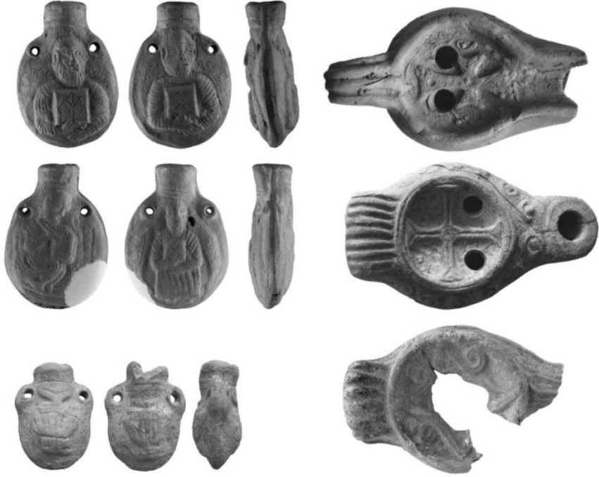
Resim 5. Sağıda üstte, Agora Hamam Kazılarında ele geçen discusu üzerinde haç tasvirli kandiller ve sağıda altta yıldız tasvirli kandil, solda Ampulla örnekleri

Hıristiyanlığın bu ilk yüzyılında, Hıristiyan öğretisi hem tüm sosyal tabakalarda hem de imparatorluk topraklarının en ücra köşelerine kadar yayılmaya devam etti. Örneğin Batı'da bulunan Roma Lejyonlarında Kybele ve Mithra 'ya inananların yanı sıra, Anadolu ve Suriye kökenli önemli sayıda Hıristiyan asker bulunuyordu. Domitianus zamanında büyük anıtsal yapı projelerine yapılan harcamaların hazineyi tüketmesi ile birlikte hoşgörü yılları sona erecek, MS 92'de tekrar Hıristiyanlara karşı kovuşturma başlayacaktır.