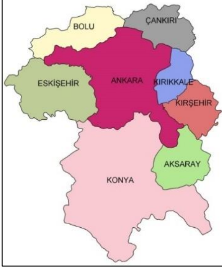
Şekil 1: Ankara'ya Komşu İller 11

TÜİK ADNKS verilerine göre 2017 yılında Ankara ilinin nüfusu 5.445.026 kişidir. Nüfus bakımından İstanbul'dan sonra en kalabalık il Ankara olup; yüzölçümü bakımından üçüncü büyük kenttir. 12