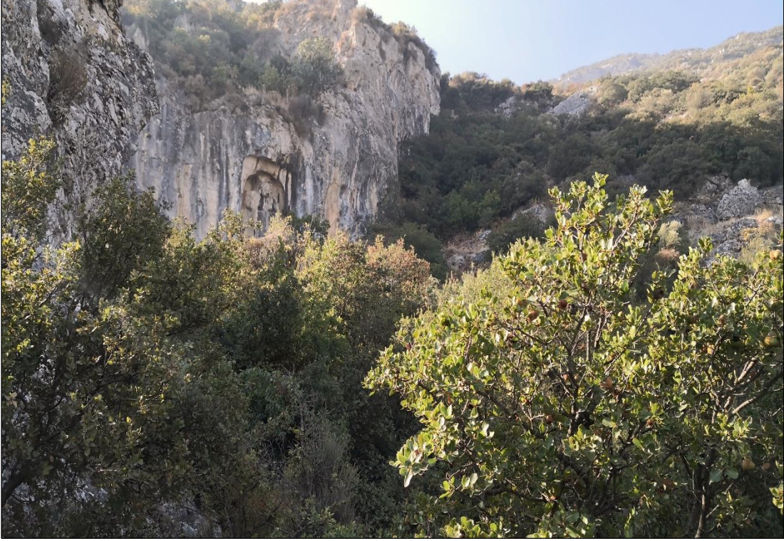
Şekil 2. Manisa, Sipylos Dağı ve Akpınar Kaya Anıtı Görünümü.