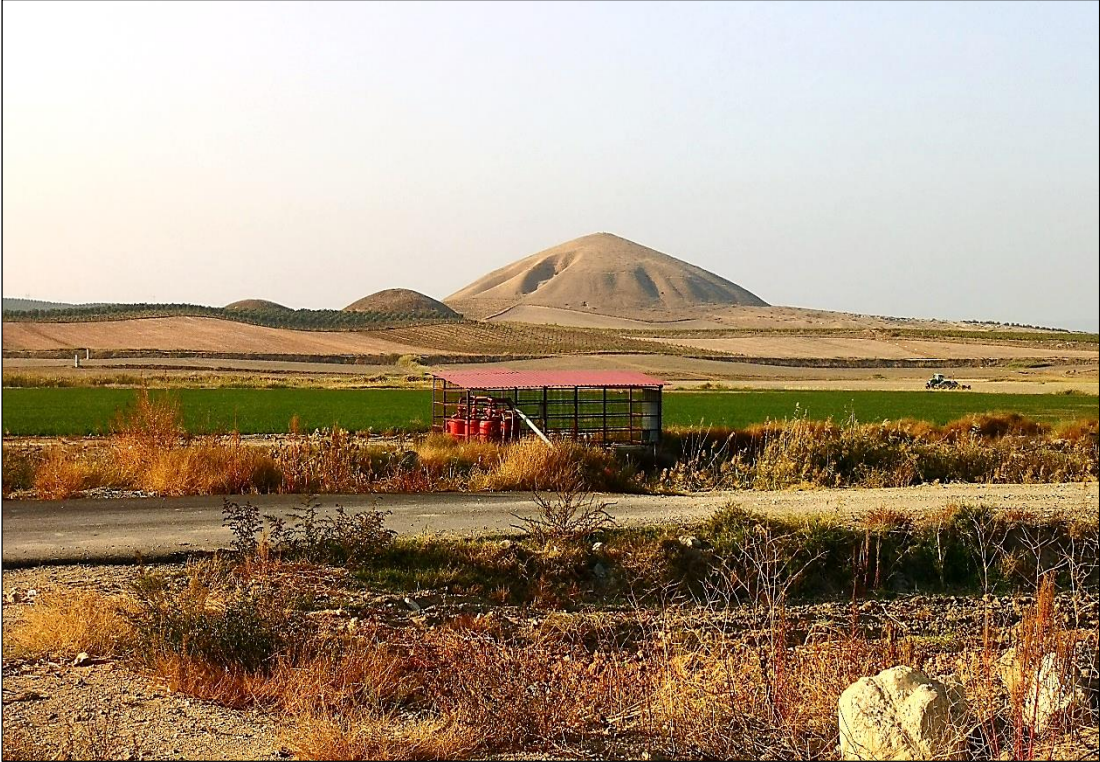
Şekil 8. Alyattes Tümülüsü'nün Görünümü.