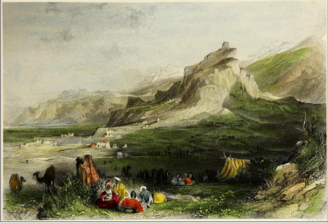
Şekil 5. Sardeis (Salihli) ve Akropolü Gösteren Gravür (Walsh, 1839: lev. 34).