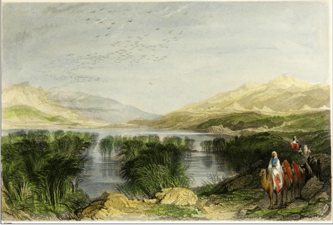
Şekil 9. Marmara Gölü (Gygaie) ve Bintepeler'i Gösteren Gravür (Walsh, 1839: lev. 95).