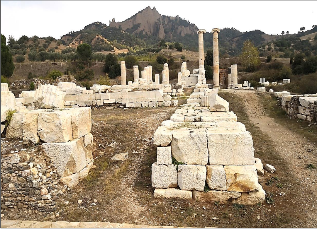
Şekil 6. Sardeis (Salihli) Artemis Tapınağı ve Akropol Görünümü.