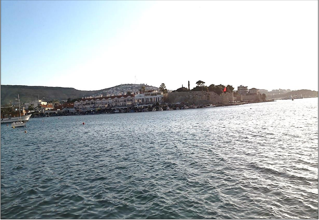
Şekil 12. Eski Foça (Phokaia) Görünüm.