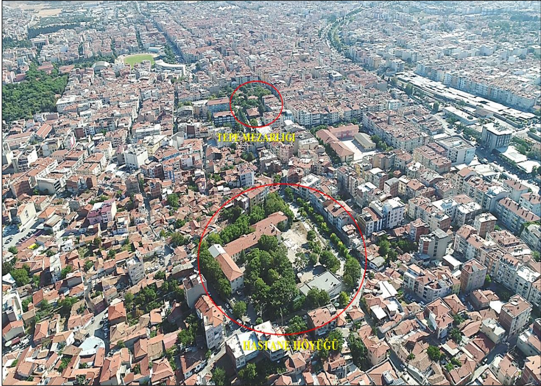
Şekil 4. Thyateira (Akhisar) Havadan Görünüm.