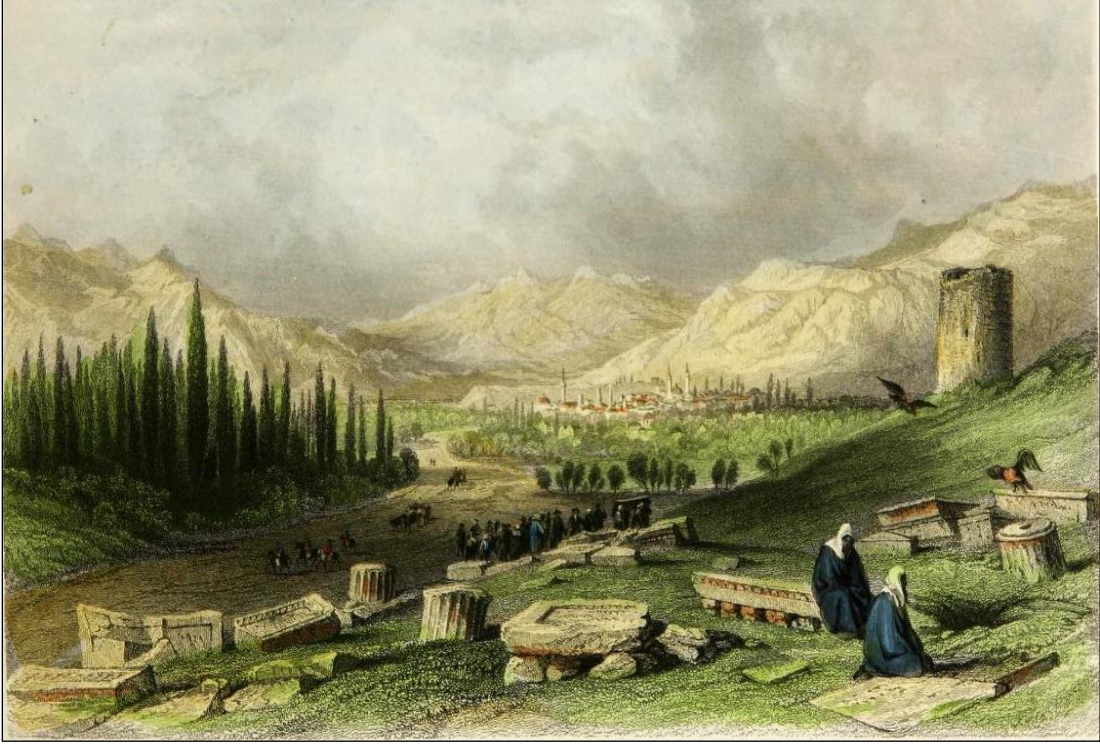
Şekil 3. Thyateira (Akhisar)'ı Gösteren Gravür (Walsh, 1839: lev. 69).