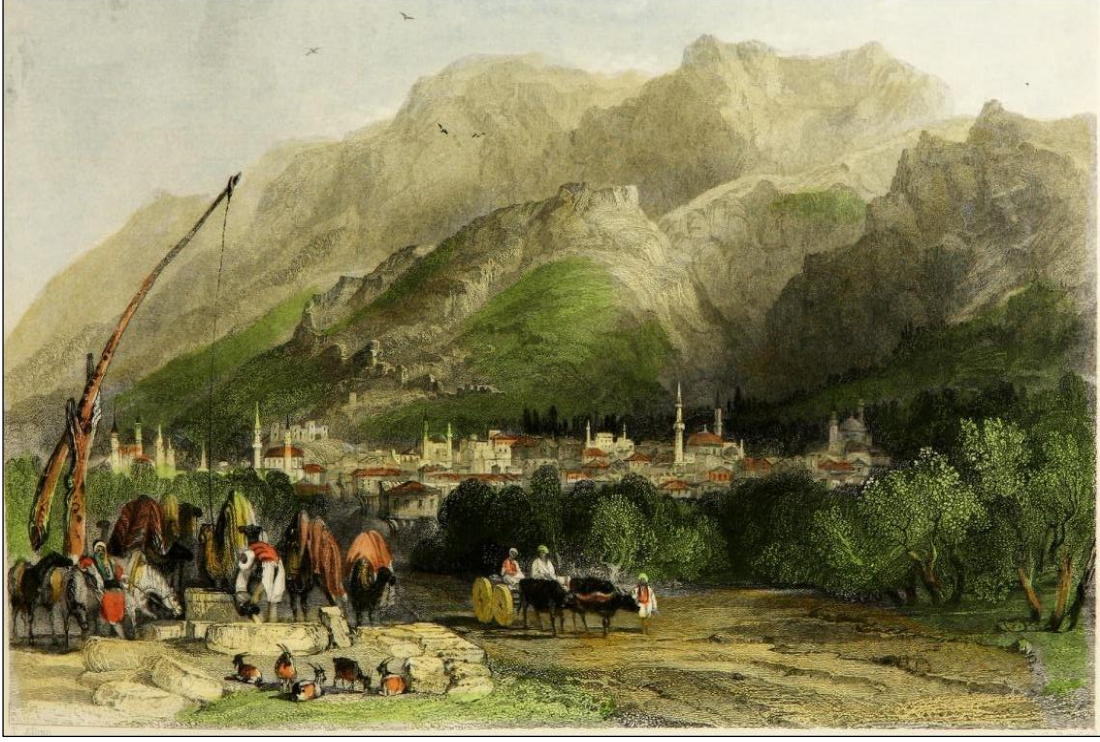
Şekil 1. Manisa ve Sipylos Dağı'nı Gösteren Gravür (Walsh, 1839: lev. 57).