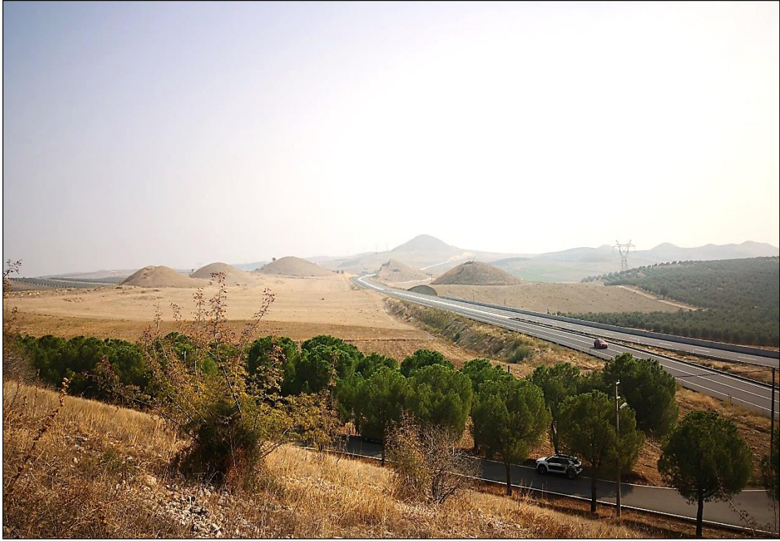
Şekil 10. Bintepeler'den Görünüm.