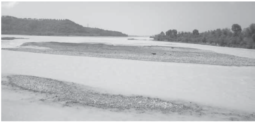
Fotoğraf 3: Çoruh Nehrinin Batum'da Karadeniz'e döküldüğü yerden bir görünüm.

kalmaktadır (Sever, 2005:60). Çoruh Irmağının Batum'da Karadenize döküldüğü noktada genişliği 100-200 m civarında olup, küçüğe olsa bir delta oluşturmuştur. Aslında taşıdığı alüvyon miktarına, eğimine ve su miktarına ( 220\text{m}^3/\text{sn} ) bağlı olarak çok daha büyük bir delta oluşturması beklenirken, Karadeniz'deki akıntılar nedeniyle delta fazla büyüyememiştir (Koday, Koday, Karakuzulu, 2007:30) (Fotoğraf 3). Çoruh Irmağının deltası ve Karadeniz'in oldukça geniş kıyı düzlüğünde; Gürcistan'ın en büyük şehirlerinden birisi ve aynı zamanda Acara Özerk Cumhuriyet'inin yönetim merkezi olan 121806 nüfuslu liman şehri, Batum yer almaktadır.