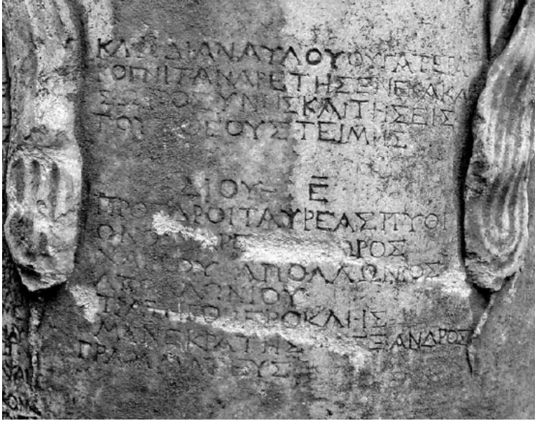
Fotoğraf 5: IV. Kısım, 73-84 Satırlar