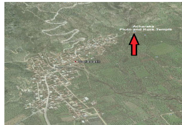
Salavatlı – Akharaka, Pluto ve Kore Tapınağı

Bu iki antik kentten, özellikle Akharaka (Salavatlı) eski çağlarda bir termal tedavi merkezi olarak kullanılmış olmasıyla da ünlüdür. Bugün buradaki Sarı Su olarak adlandırılan derenin suyunun içerdiği kükürt ile yeraltındaki kükürtlü gazın varlığı eski çağlarda bu antik yerleşimin çok önemli ve gizemli