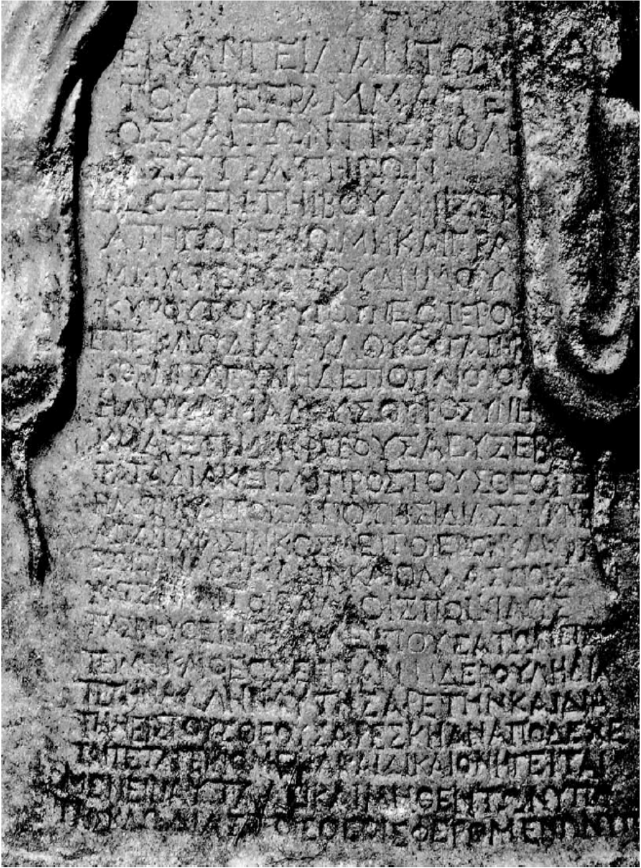
Fotoğraf 2: I. Kısım, 1-24 Satırlar