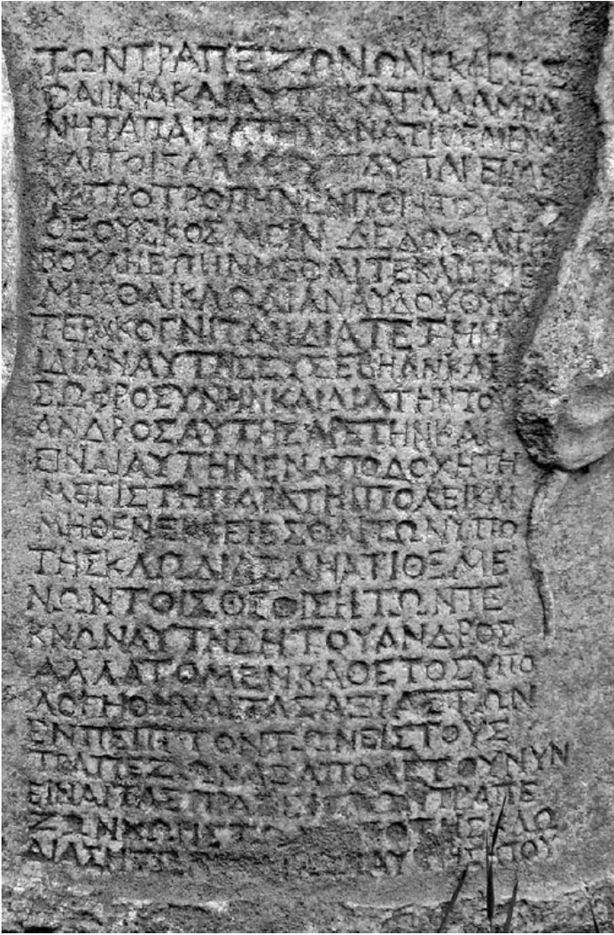
Fotoğraf 3: II. Kısım, 25-49 Satırlar