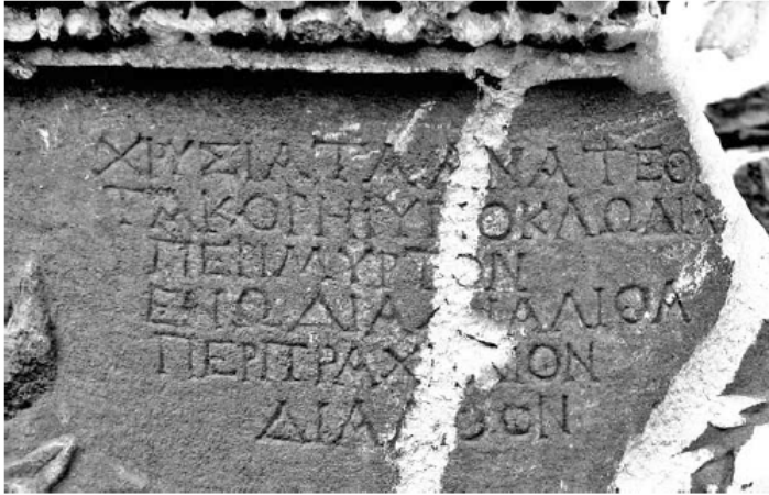
Fotoğraf 6: V. Kısım, 85-90 Satırlar