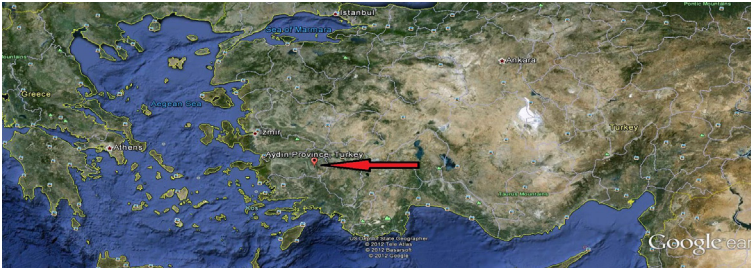
Aydın İli – TÜRKİYE

Aydın İl'inin Sultanhisar İlçesi'nin hemen kuzeyinde bulunan Nysa Antik Kenti ile yaklaşık 4 km batısında yer alan Salavatlı Beldesinin kuzeydoğusunda bulunan Akharaka Ören Yeri, günümüzde turistik yönden çok önemli olan arkeolojik yapı kalıntılarına sahiptir.