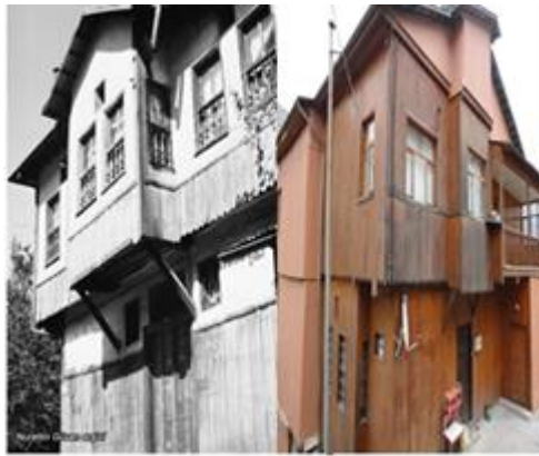
Şekil 3.1. Yanlış Restorasyon Sonucu Özgünlüğünü Yitiren Ev

Kemaliye (Eğin) Evleri kendine özgü mimari dokusuyla yıllara meydan okuyarak günümüze ulaşmış kültür mirasıdır. Ancak bütün çabalara rağmen gerekli restorasyon çalışmaları yapılamamaktadır. Sit alanı ilan edilen bölgede yapılan restorasyonlar sadece yapının dışına yapılmakta, o da çoğunlukla yapıyı özgün halinden uzaklaştırmaktadır. Yanlış restorasyon çalışmalarının ana sebebi maddi kaynağın ve bilinç düzeyinin yetersiz olmasıdır. Koruma kurulu tarafından evlerin restorasyonu için verilen destek miktarı ihtiyacı yeterince karşılayamamaktadır. Diğer taraftan evlerin birçoğu birden fazla kişiye miras kalmıştır ve mirasçılar arasında meydana gelen anlaşmazlıklar ise yapıların kaderlerine terkedilmesine neden olmaktadır.