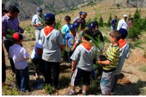
Şekil 3.4. Çocuk Kampı Ağaçlandırma Etkinliği

İlçede doğal yaşamın zarar görmesini en aza indirgeyebilmek için çocuklara ve yetişkinlere yönelik olarak, şekil 3.4.'de görüldüğü gibi, bilinçlendirme faaliyetleri düzenlenmektedir.