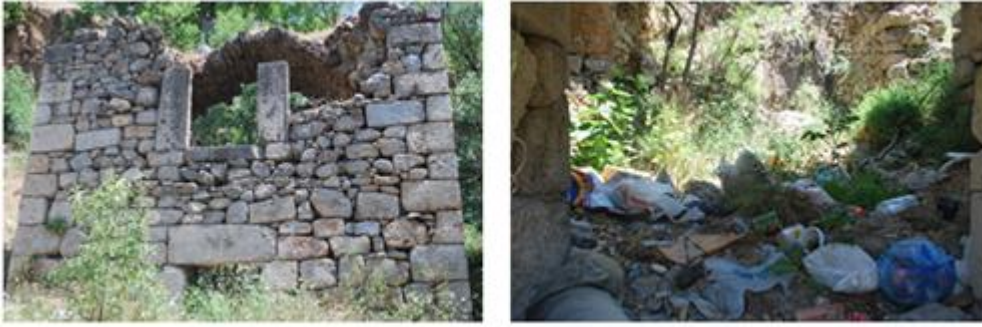
Şekil 3.5. Yuva Köyü Şapel Kalıntısı ve Atıklar

İlçede, ziyaretçilere ve yerel halka yönelik olarak, sürdürülebilir üretim ve tüketim kalıplarının oluşturulmasına yönelik herhangi bir çalışma yoktur. Geri dönüşüm atıkları, ilçenin fiziksel konumu itibarıyla maliyeti artırması nedeniyle, geri dönüşüm tesislerine götürülememektedir. Evsel atıkların bertarafına yönelik de herhangi bir çalışma olmadığı için, şekil 3.5.'te görüldüğü gibi, kültürel miras ve doğal çevre bundan zarar görmektedir.