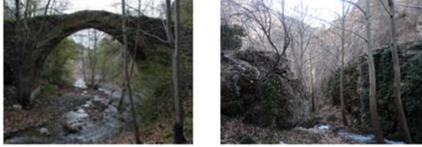
Şekil 3.2. Yuva (Geruşla) Köyü Köprüsü ve Kalıntısı

Eğir'in özgün mimari mirasının bir ayağını da köprüler oluşturmaktadır. Mimari yapısı ve hikâyeleriyle dikkat çeken Eğir köprülerinin bir kısmı baraj yapımı sonrasında sular altında kalmış, bir kısmı suların yükselmesi sonucu yıkılmıştır. Şekil 3.2.'de görülen Yuva Köyü Köprüsü ise 1991 yılında tescilli anıtsal yapılar arasına alınmış olmasına rağmen, günümüzde koruma imkanlarının kısıtlı olmasından dolayı, zamana daha fazla dayanmamıştır ve sadece kalıntıları kalmıştır (ÇEKÜL, 2011, 1).