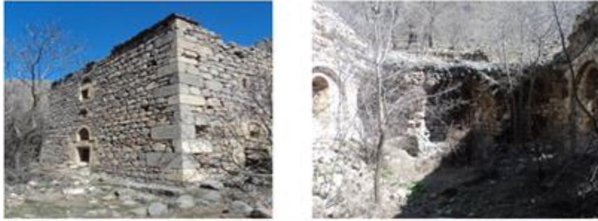
Şekil 3.3. Sorak Köyü Kilisesi Kalıntısı

Eğir kültür mirasının önemli yapı taşlarından birisini de çok kültürlü geçmişin izlerini bugüne taşıyan cami, kilise, türbe vb. gibi dini yapılardır. Ancak birçok dini yapının da gelecek kuşaklara aktarılması, şekil 3.3.'te görüldüğü gibi, şu anki durum itibari ile zor görünmektedir.