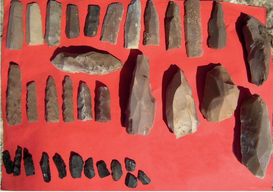
Resim 14. Sumaklı Köyü Besta Faki Mevkii Buluntuları.