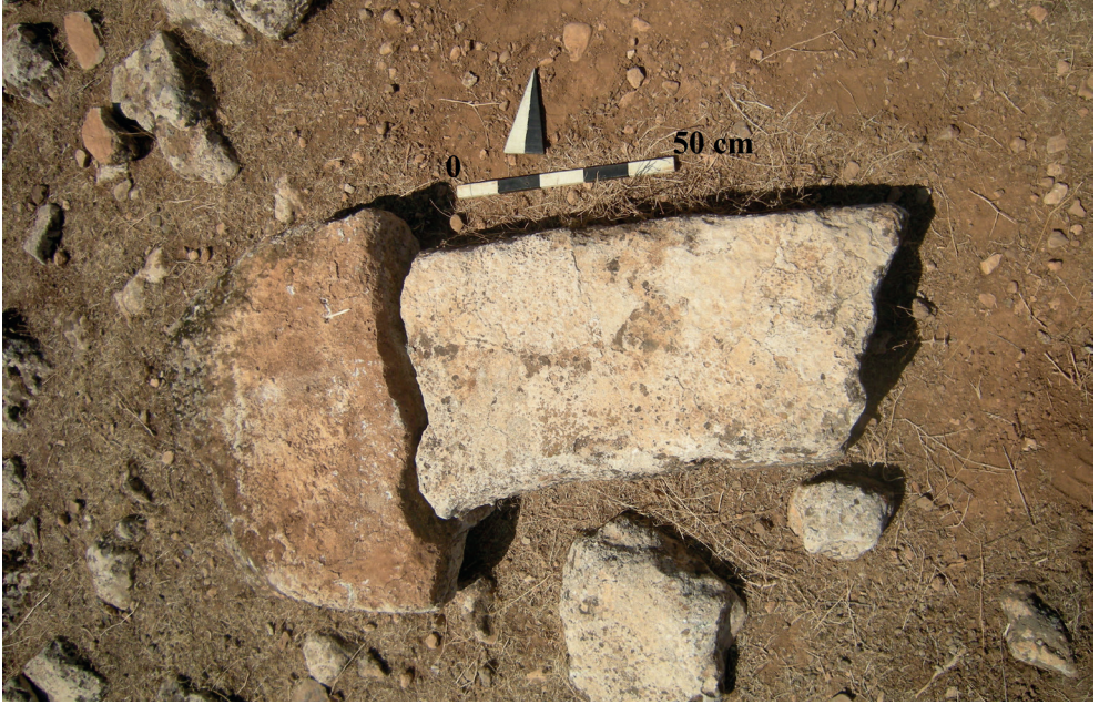
Resim 4. Kırıçı Köyü Çakmak Harabesi'nden "T" Şeklinde Dikmetaş.