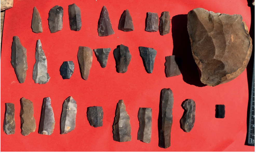
Resim 2. Karakuş Köyü Deride Mevkii Buluntuları.