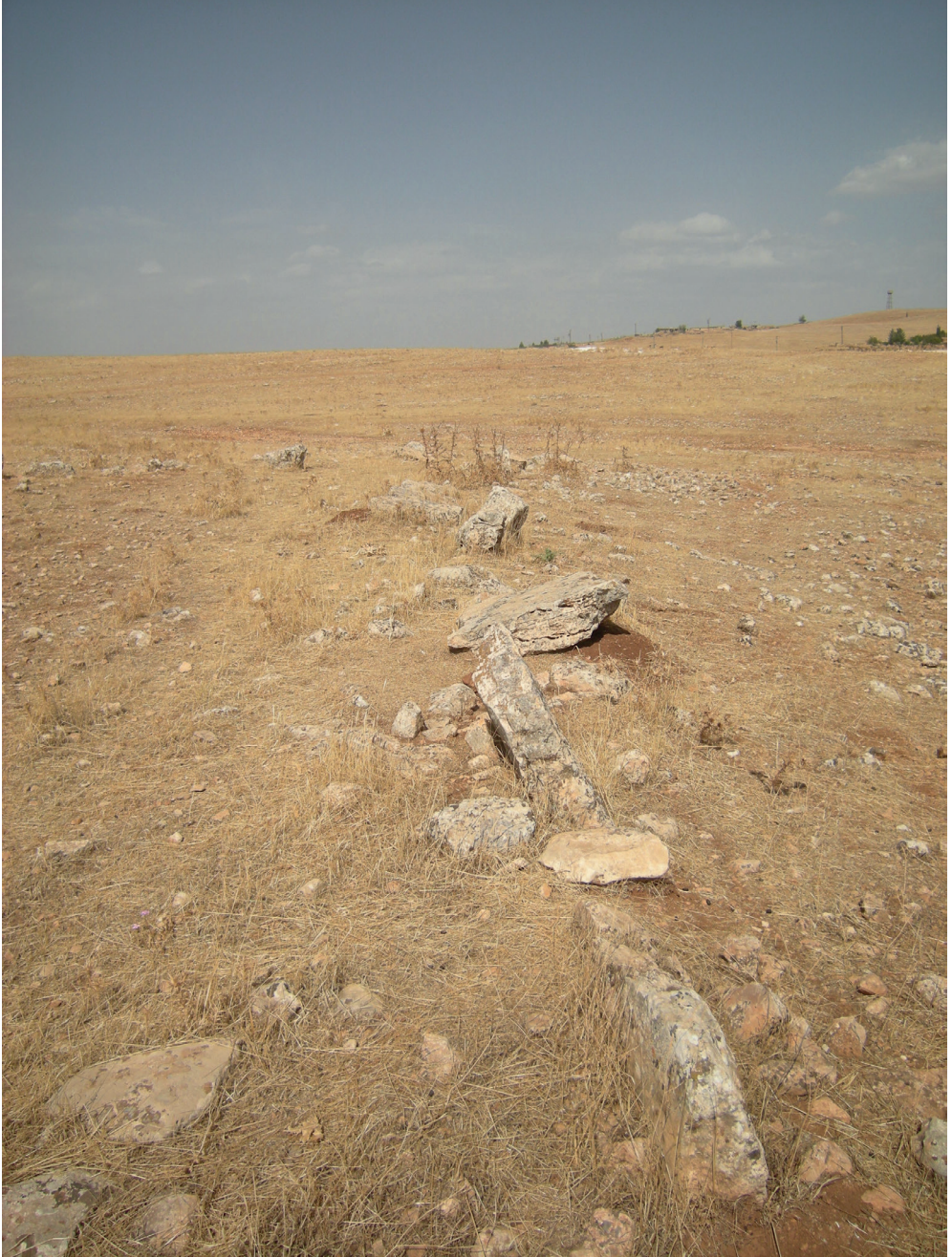
Resim 18. Tahtik Köyü Yabani Hayvanlar için Tuzak Duvarları.