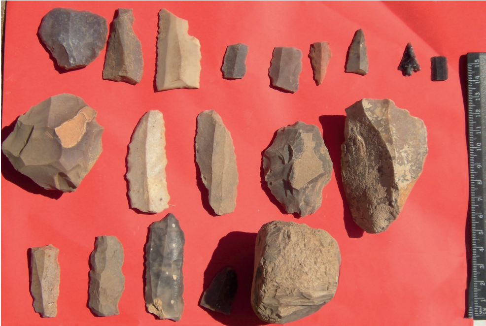
Resim 3. Karakuş Köyü Hacı Şeyh Ahmet Tarlası Buluntuları.