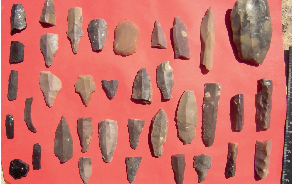
Resim 6. Kırıçı Köyü, Çakmak Harabesi Buluntuları.