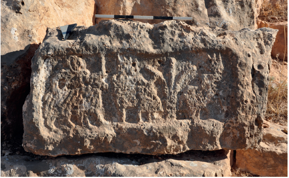
Resim 12. Dağyamacı Köyü Doğu Mevkii'den Bir Kabartma.