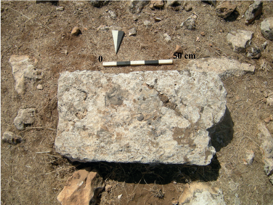
Resim 15. Sumaklı Köyü Besta Faki Mevkii'den Dikmetaş Parçası.