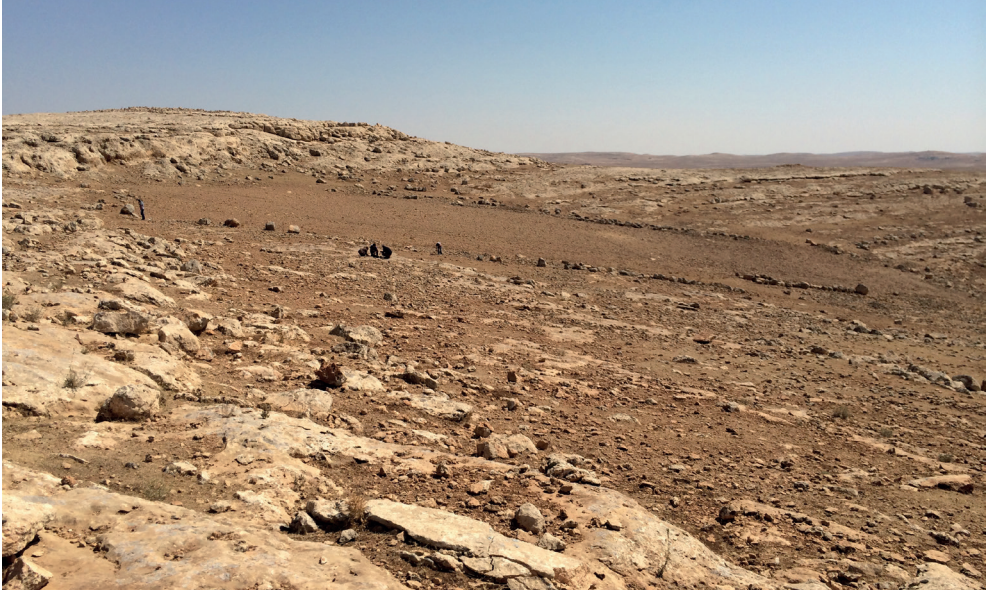
Resim 1. Karakuş Köyü Deride Mevkii Güneybatıdan Görünüm.