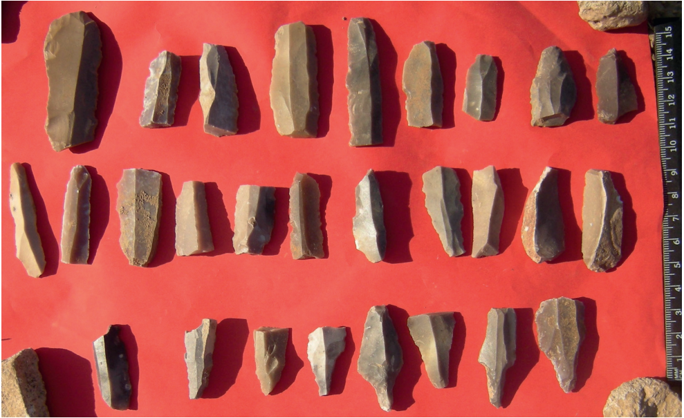
Resim 7. Tosunlu Köyü Deçe Mevkii Buluntuları.