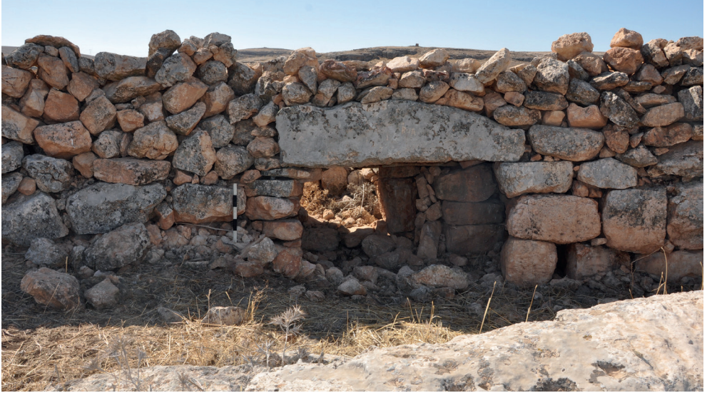
Resim 17. Sumaklı Köyü Yanık Kale'nin içinden bir Görünüm.