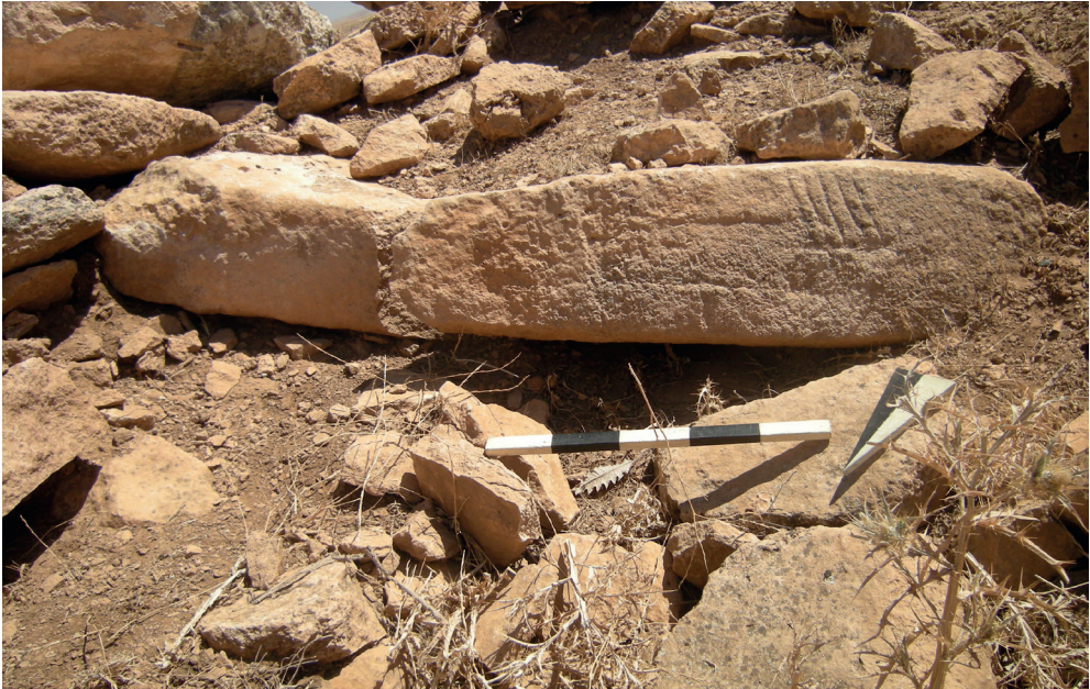
Resim 5. Kırıçı Köyü Çakmak Harabesi'nden Parmak Kabartmalı Dikmetaş.