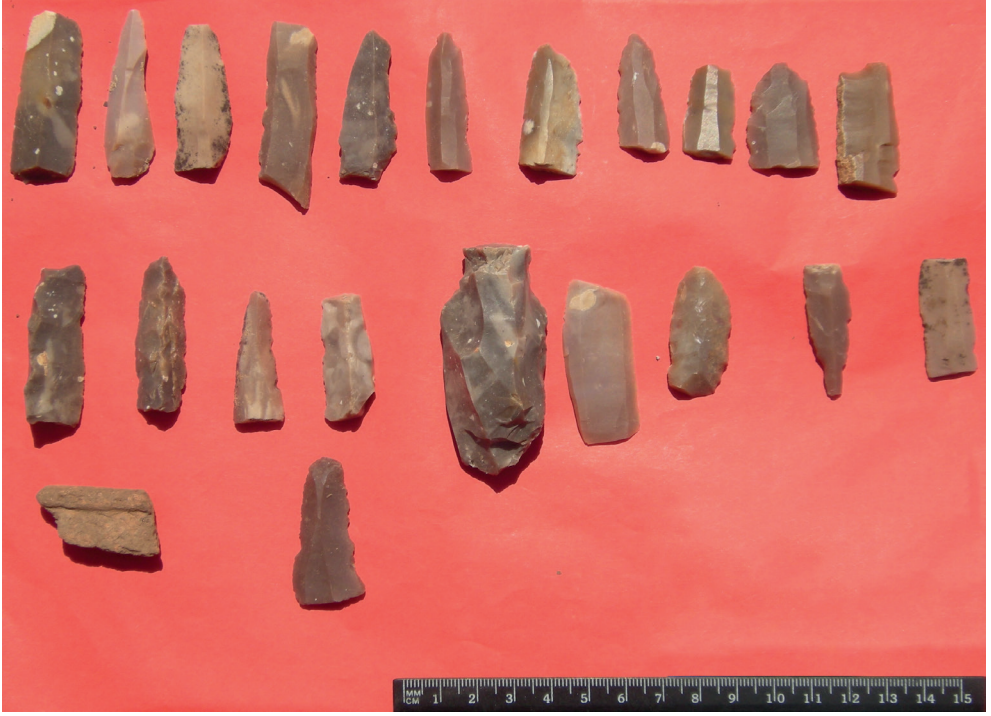
Resim 16. Sumaklı Köyü İsmail Kalesi Yüzey Buluntuları.