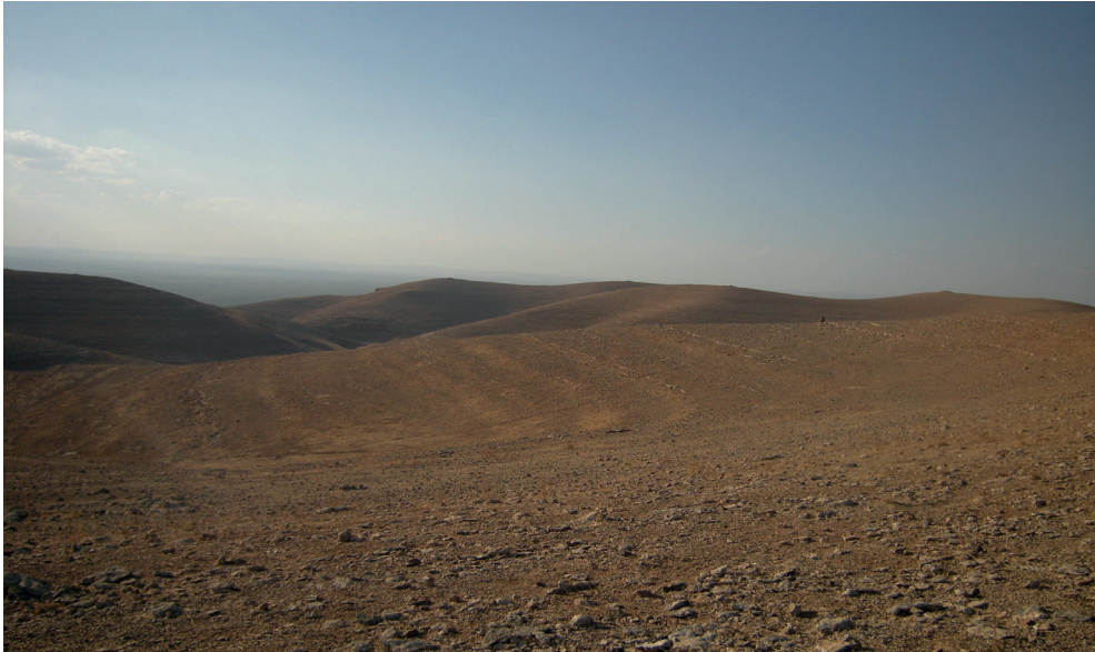
Resim 9. Mabude Köyü Recmelsuvan Mevkii Güneyden Genel Görünüm.