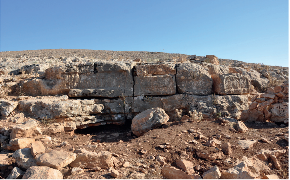
Resim 11. Dağyamacı Köyü Doğu Mevkii'den Ana kayaya Oyulmuş Kabartmalar.