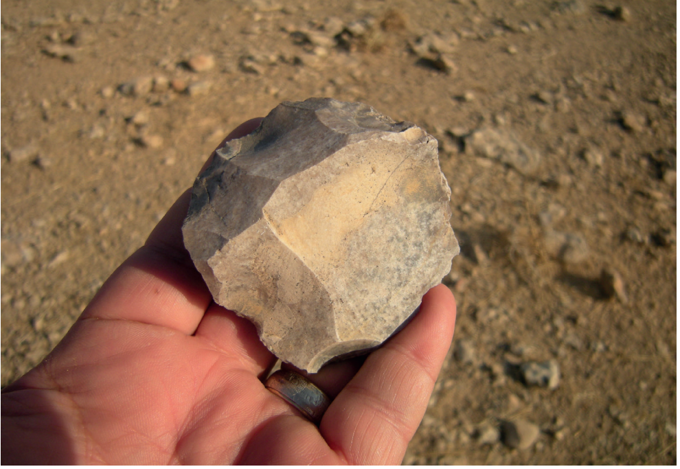
Resim 10. Mabude Köyü Recmelsuvan Mevkii Güneyden bir Levallois Çekirdek.