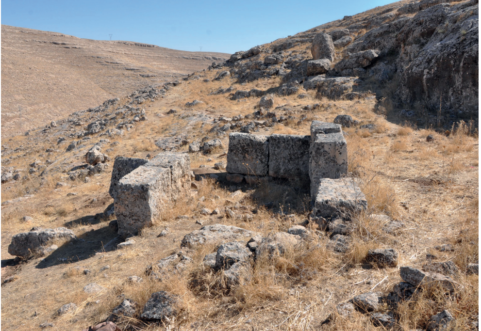
Resim 13. Kapaklı Köyü Kuzey Mevkii Yapı Kalıntısından Görünüm.