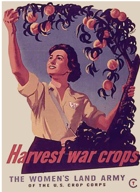
Görsel 3. ABD'de II. Dünya Savaşı Sürecinde Yayınlanan WLAA Afişi