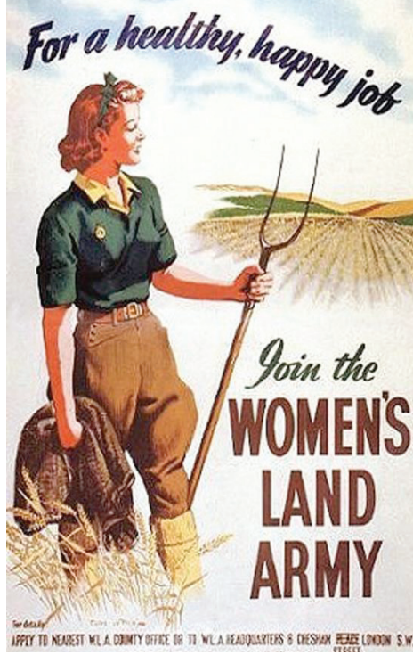
Görsel 1. İngiltere'de II. Dünya Savaşı Sürecinde Yayınlanan WLA Afişi

Dikey olarak tasarlanan afişte WLA üniforması giyen bakımlı bir kadın figürü ile mavi bir gökyüzü ve yeşillenmekte olan tarlalar görülmektedir. "Sağlıklı ve Mutlu Bir İş İçin Kadınların Arazi Ordusu'na Katılın" olarak Türkçeleştirilebilecek bir ifade ve detaylı bilgi için irtibat bilgileri yer almaktadır.