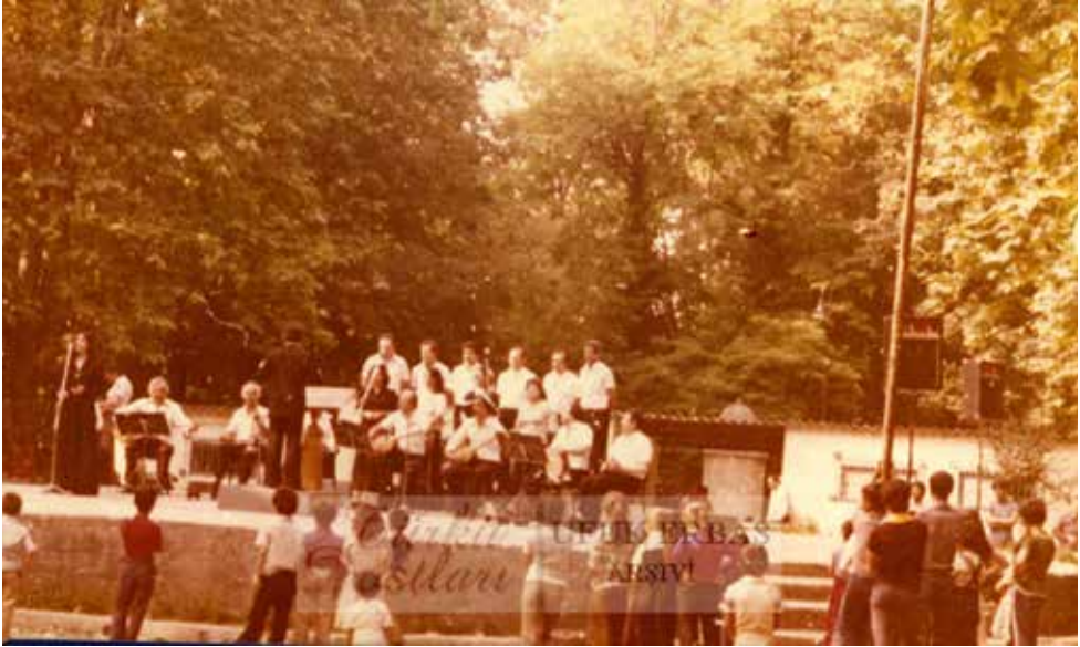
Ek-31: Belediye Konservatuvarı Türk Halk Müziği Topluluğu Konseri (Gülhane Parkı)