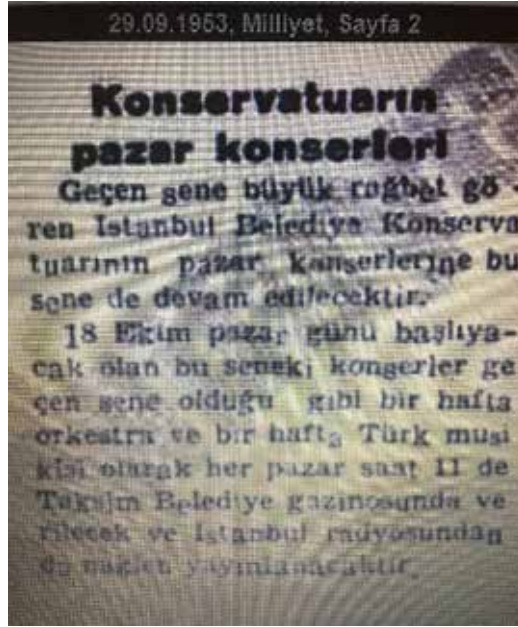
Ek-27: Belediye Konservatuarı Türk Sanat Müziği Topluluğu Konser Duyurusu, (Milliyet, 29 Ekim 1953)