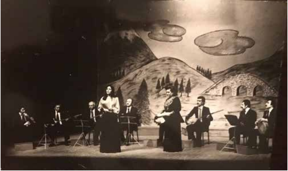
Ek-17c: Konservatuvar Türk Halk Müziği Topluluğu'nun Mizansenli ve Halk Oyunu Eşlikli Konserleri