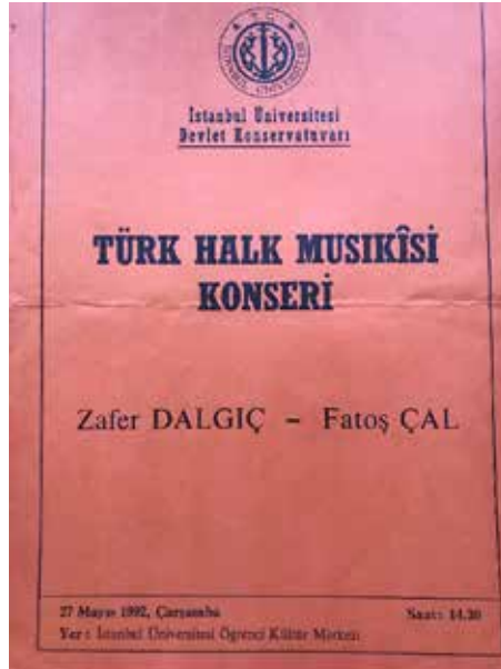
Ek-35: İ.Ü. Devlet Konservatuvarı Türk Halk Müziği Topluluğu Konseri, 27 Mayıs 1992