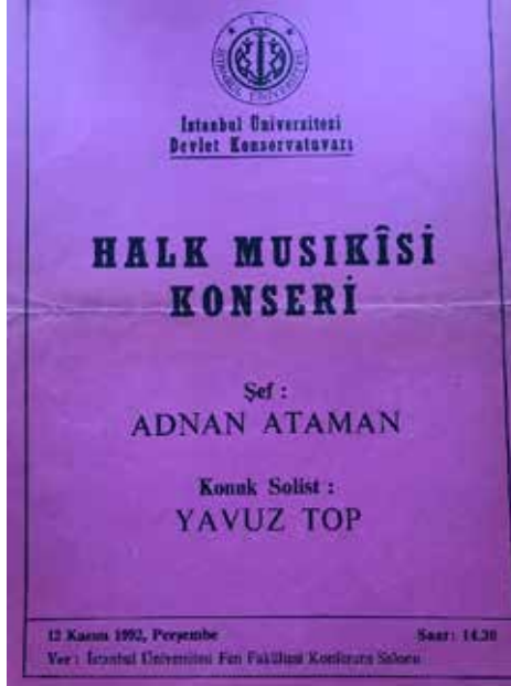
Ek-34: İ.Ü. Devlet Konservatuvarı Türk Halk Müziği Topluluğu Konseri, 12 Kasım 1992