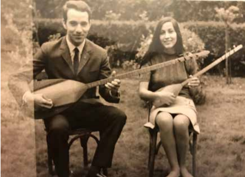
16b: Orhan Gencebay ve Handan Tunca