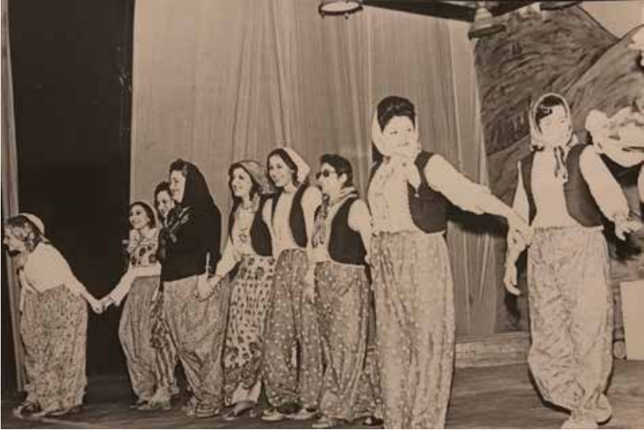
Ek-17a: Konservatuvar Türk Halk Müziği Topluluğu'nun Mizansenli ve Halk Oyunu Eşlikli Konserleri