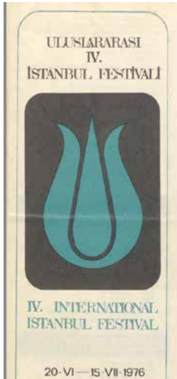
Ek-27: Belediye Konservatuvarı Türk Halk Müziği Topluluğu, 1976 (27. İstanbul Festivali)