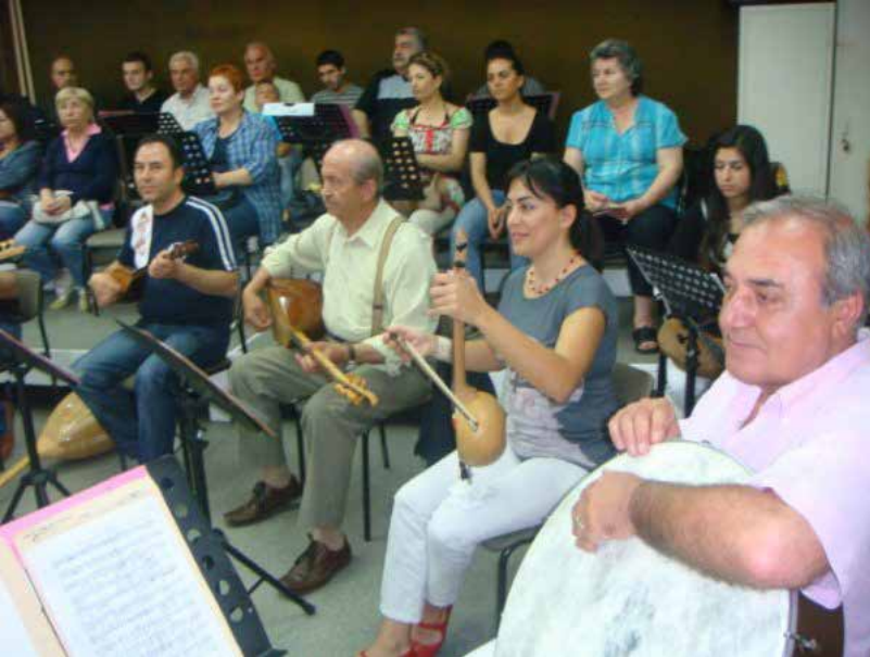
Ek-20: İ.Ü. Devlet Konservatuvarı Türk Halk Müziği Topluluğu Etkinlikleri