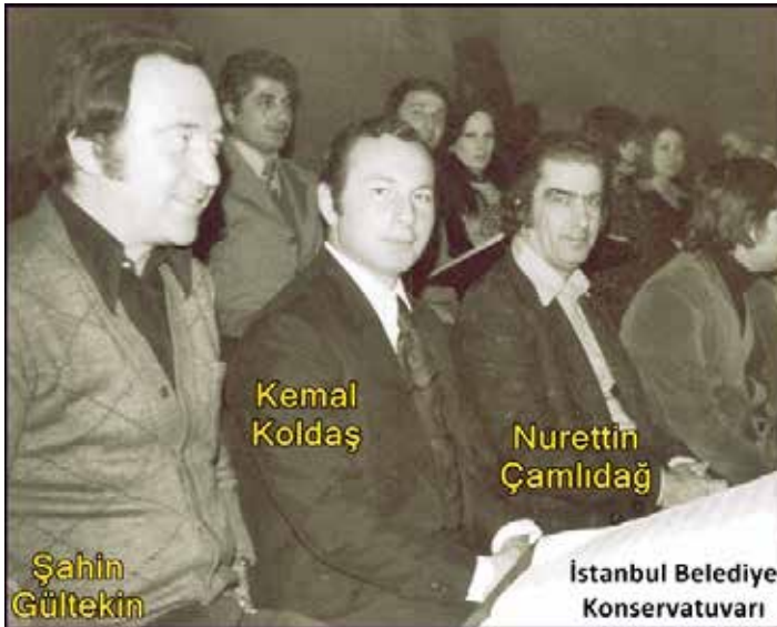
Ek-28: Belediye Konservatuarı Türk Halk Müziği Topluluğu Koristleri, 1970'ler