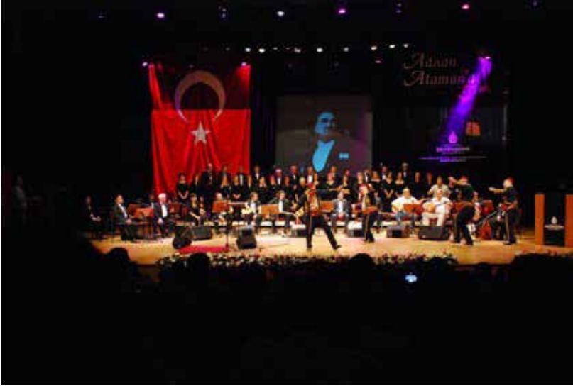
Ek-11a: “Adnan Ataman’a Saygı Konseri” (6 Haziran 2009) Belediye Konservatuvarı Kökenli Türk Halk Müziği Sanatçıları