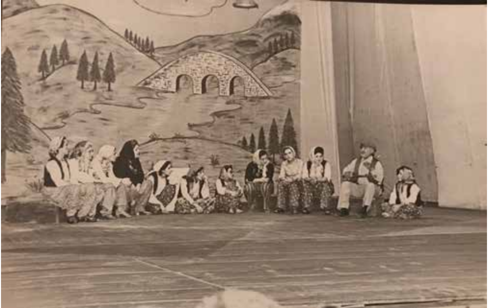
Ek-17b: Konservatuvar Türk Halk Müziği Topluluğu'nun Mizansenli ve Halk Oyunu Eşlikli Konserleri