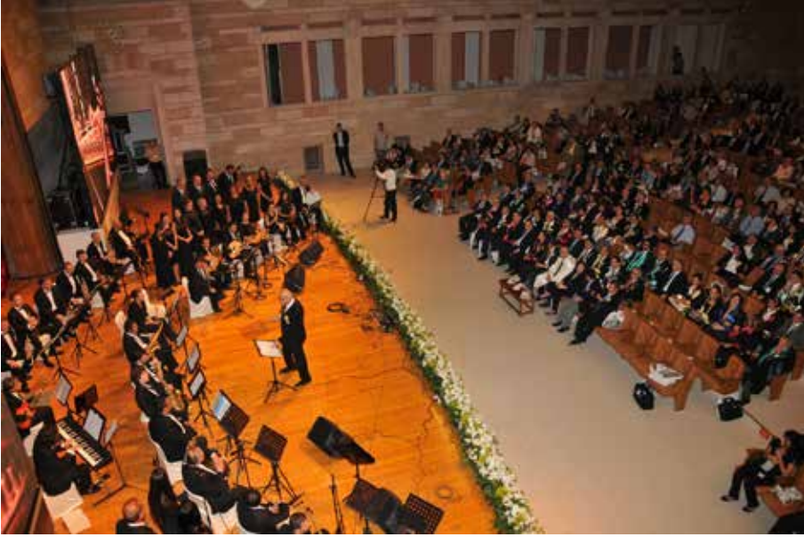
Ek-22: İ.Ü. Devlet Konservatuvarı Türk Halk Müziği Topluluğu Etkinlikleri (İ.Ü. Akademik Açılış Konseri, 2013)