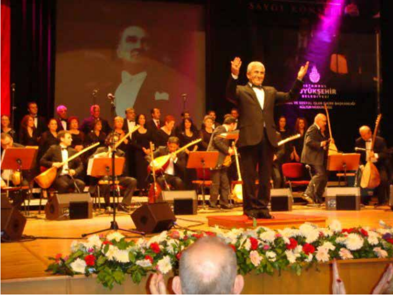
Ek-19: İ.Ü. Devlet Konservatuvarı Türk Halk Müziği Topluluğu Etkinlikleri