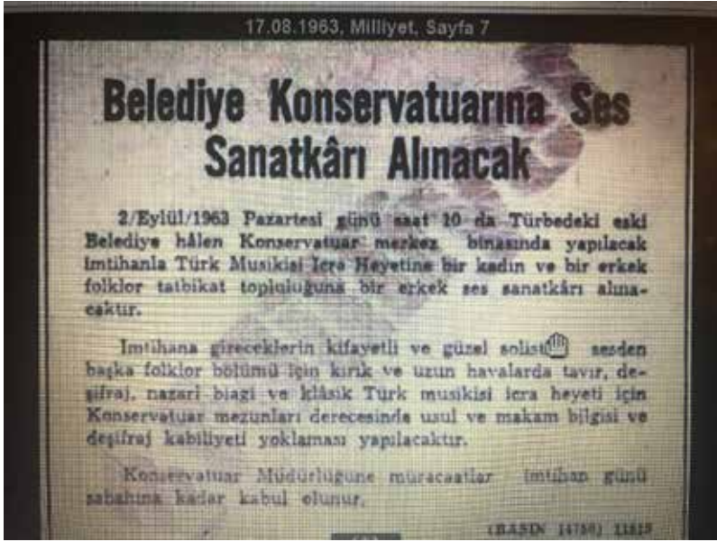
Ek-7: Konservatuvar Ses Sanatkârı Alım İlanı, (Milliyet, 17 Ağustos 1963)