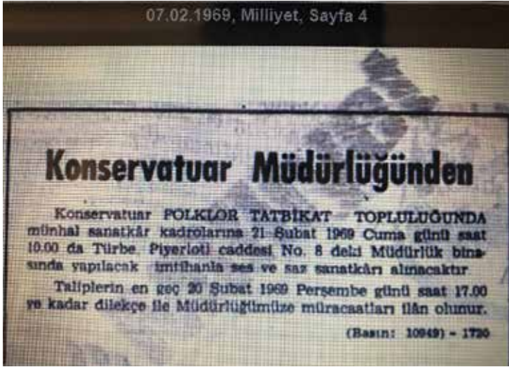
Ek-9: Konservatuvar Ses ve Saz Sanatkarı Alım İlanı ( Milliyet , 7 Şubat 1969)