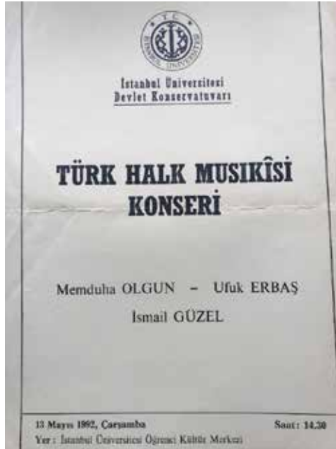
Ek-33: İ.Ü. Devlet Konservatuvarı Türk Halk Müziği Topluluğu Konseri, 13 Mayıs 1992