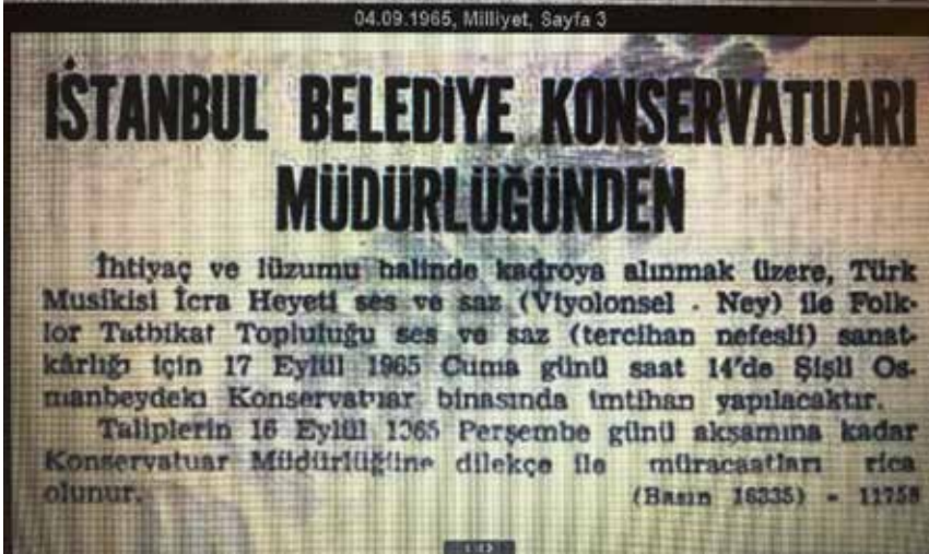
Ek-8: Konservatuvar Ses ve Saz Sanatkârı Alım İlanı (Milliyet, 4 Eylül 1965)