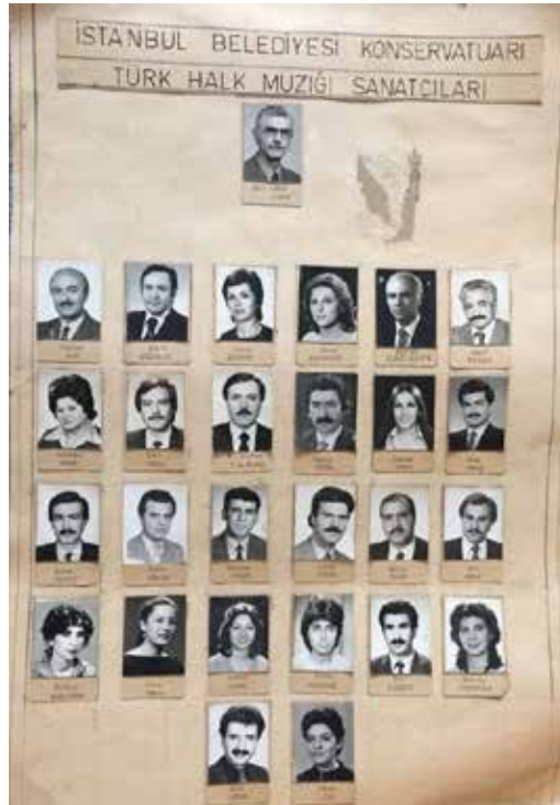
Ek-10: Konservatuvar Türk Halk Müziği Sanatçıları