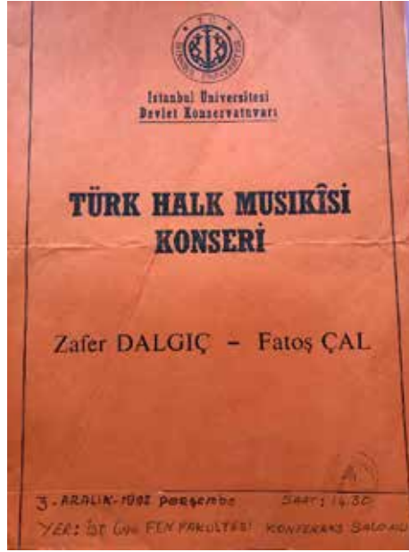
Ek-32: İ.Ü. Devlet Konservatuvarı Türk Halk Müziği Topluluğu Konseri, 3 Aralık 1992