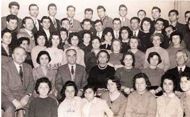
Ek-2: Konservatuvar Türk Müziği Nazariyatı Eğitim Kadrosu, 1960