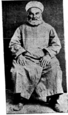
یتیم اوچنجی آلی مفتی علی رضا اقدی : هنکامہ حربہ آلی تاجیح ایدرکن مترابوز آتنتہ معروض قالان شہید مغفور .

Ayrıca, cephede imam ve müftüler yanında, askerlerin şecaatini artırmak, yapılan işin büyüklüğünü anlatmak üzere İstanbul'un ileri gelen hoca efendileri cepheye gönderilmiştir. Bunlar cephede birlikler arasında bir program dâhilinde dolaştırılarak vazifelerini yapmaları sağlanmıştır. Bu maksatla İstanbul'da da Meşîhat Dairesi Ders Vekâleti'nde ilmî heyet oluşturulmuş, camilerde bu heyet tarafından seçilen kişilere her hafta vaaz ettirilmiştir.