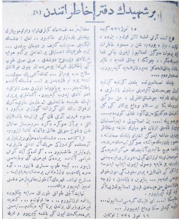
Görsel 1. Behzat Kerim Efendi hatıralarından bir sayfa 1

Bu şuur içinde bulunan askerler muharebe meydanlarında elinden Kur'ân'ı, dilinde ise duayı bırakmamışlardır. Askerler iç ceplerinde başta Kur'ân olmak üzere dua mecmuaları taşımışlardır. (Oral, 2015, s. 410) Çanakkale'de, bir milletin ve onun temsil ettiği medeniyetin nurunu söndürmek için gelmiş düşmana karşı duran askerlerin en önemli teşvik unsuru ise bin yılı aşkın müntesibi olduğu İslam olmuştur. Bu şuurun kazanılmasında ise en önemli etken orduda görevli resmi imamlar ve müftüler olmuştur denilebilir.