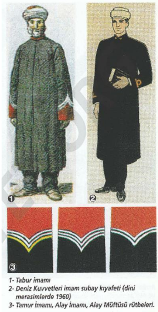
Görsel 2. Osmanlı ordusunda imam kıyafetleri

Osmanlı Devleti de ilan ettiği seferberlik (2 Ağustos 1914) ile birlikte askeri hazırlıklara başlamış bu çerçevede birliklere imam ve müftüler tayin etmiştir (Koral Necmi, 1985, s. 203). Bu usul Yeniçeri Ocağı'nda (Civelek, 07-09 Mayıs 2010, s. 856) Ocak İmamı olarak başlamış, daha sonra kurulan tüm ordularda devam etmiştir. Yeniçeri Ocağı bölük imamlarının başında İmâm-ı Hazret-i Ağa , Ağa İmamı veya Ocak İmamı denilen Büyük İmam vardı. O, bölük imamlarını zaman zaman bir araya getirip bilgilendirir, yeni donanımlara ulaştırırdı. Bu makama, ocaktan yetişen, Orta Camii'ndeki müderristen ders alan, Ağa Kapısı Camii'nin beş müezzininden en yetkilisi tayin edilirdi. Ocak imamı bu camide namaz kıldırır ve seferlere yeniçeri ağasıyla beraber katılırdı. Yine onunla birlikte ayda bir defa Sadrazamı ziyarete gider, bayramlarda da Padişahın muayede merasiminde bulunurdu (Ülker, Osmanlı'dan Cumhuriyet'e Askeri İmamlar, 1999, s. 61).