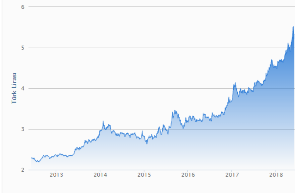
Şekil 1 – Euro'nun Türk Lirası Karşısındaki Değer Artışı

Türk lirasının Euro ve Dolar karşısında giderek artan değeri de Avrupa Birliği'yle olan turizmin büyümesine hizmet edecek gelişmelerden biridir. Her ne kadar paranın hızlı bir şekilde değer kaybetmesi ilk etapta olumsuz bir gelişme gibi görünse de doğru bir strateji çerçevesinde ihracatın ve turizm gelirlerinin artırılabilmesi bir fırsat olarak değerlendirilebilir. Şekil 1'de, Türk lirasının 2012-2018 yılları arasında yaşadığı değişim gösterilmiştir.