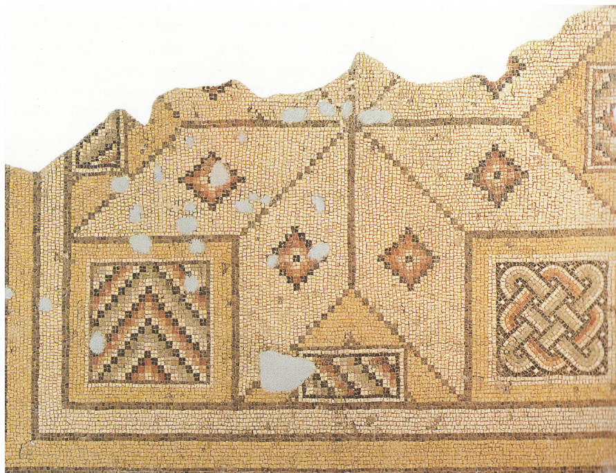
Resim 22 Antiokheia Revellers ve Hetaerae Mozaği geometrik bordür detayı (Cimok 2000: res.120).