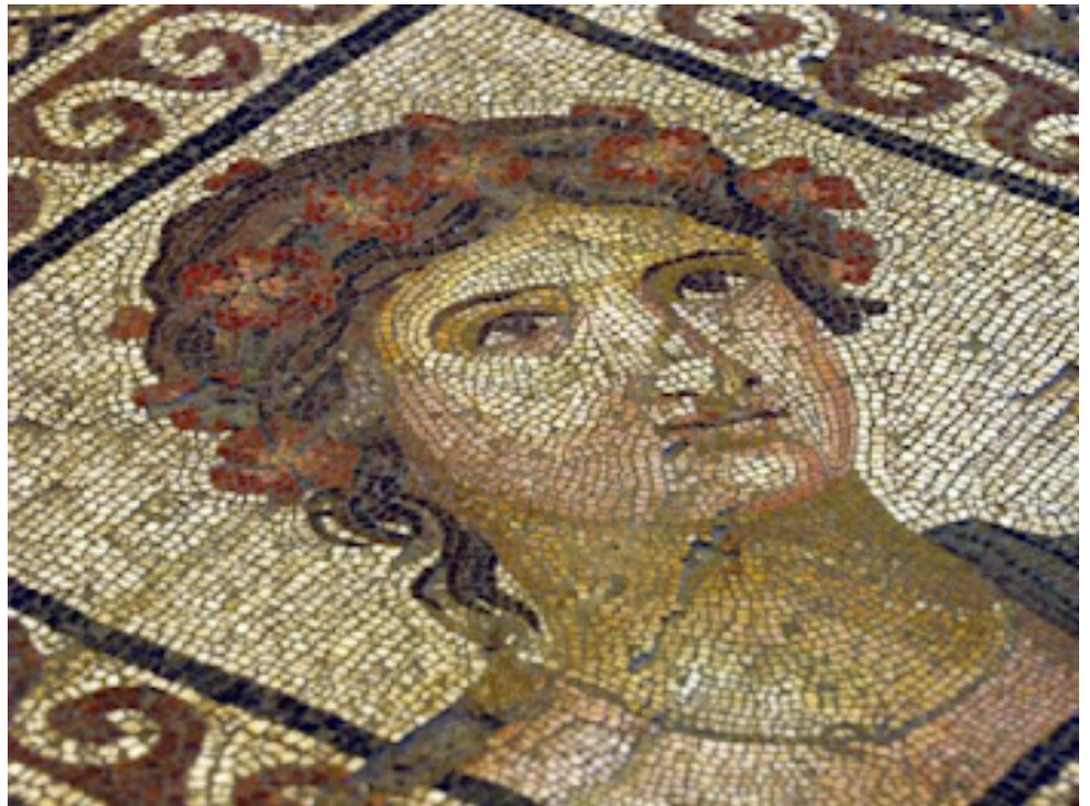
Resim 17 Amisos Akhilleus ve Thetis Mozaïği'ndeki ilkbahar figürü ( https://tarihvearkeoloji.blogspot.com ).