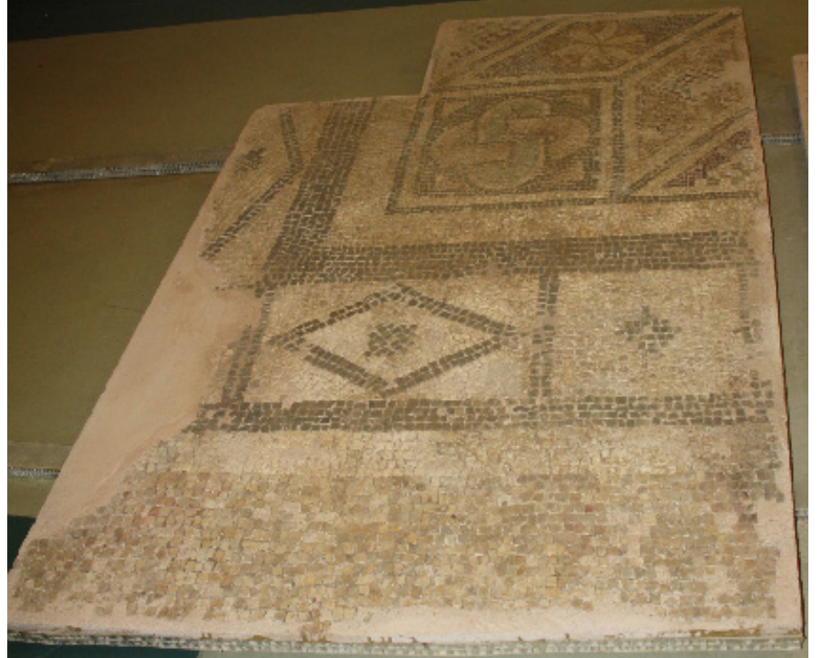
Resim 11 Prusias ad Hypium Akhilleus Mozaïği geometrik bordür ayrıntısı (S. Sezin Sezer).

Mozaïği en dıřta çevreleyen bordürde tek sıra halinde dönuřümlü olarak ilerleyen dar ve geniş metoplara yer verilmiřtir. Hem geniş metoplar ierisindeki eřkenar dörđgenlerin ortasında hem de dar metopların iinde kahverengi tesellerle oluřturulan kare ve kare rozetler bulunmaktadır.