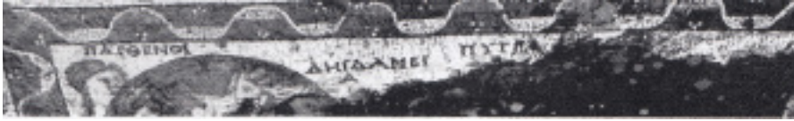
Resim 4 Prusias ad Hypium Akhilleus Mozaïği ana panosu (Dörner 1952: taf. 10).

gibi bu mozaikte Skyros Adası'nda Kral Lykomedes'in Sarayı'nda saklanan Akhilleus'un, Odysseus tarafından ortaya çıkarılması sahnesi tasvir edilmiştir. Ana panonun sol köşesinde 3/4 profilden işlenmiş genç bir kız yer almaktadır. Üç boyut perspektiften verilen genç kız başını hafifçe kendi soluna doğru çevirmiştir. Genç kızın hemen önüne kocaman bir kalkan yerleştirilmiştir. Vücudunu tamamen kapatan bu kalkanın arkasından yalnızca baş kısmı görülebilmektedir. Kalkanın üzerinde oldukça tahrip olduğundan ne olduğu anlaşılabilen bir tasvir bulunmaktadır. Sahnede güçlü ışık-gölge kullanımı ve resimsel düzenleme görülmektedir. Bu ana panonun etrafını tek sıra halinde dalgalı kurdele bandı çevirmiştir. Kurdelelerin aralarına üç nokta biçiminde doldurma motifleri yerleştirilmiştir. Dalgalı kurdele bandı üzerinde farklı renkte tessera kullanımı ile sağlanan ışık-gölge etkileşimi görülmektedir.