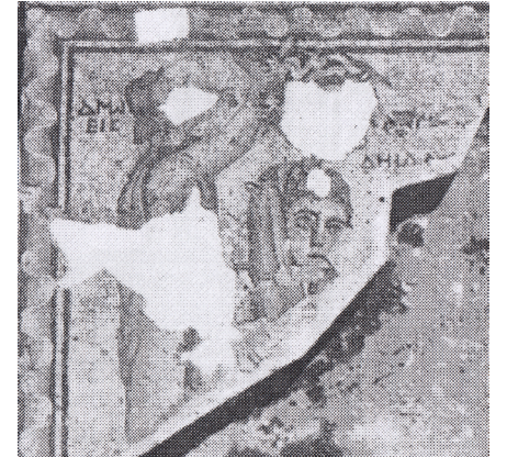
Resim 15 Shechem-Nablus Mozaiği ana pano detayı (Dauphin 1979: pl. 2C).

Prusias ad Hypium mozaiğinin ana panosunun etrafını tek sıra halinde çeviren dalgalı kurdele bandının Antiokheia ve Zeugma mozaikleri üzerinde özellikle ana panoyu çeviren bir bant olarak oldukça sık kullanıldığı görülmektedir. Bunlar arasında Zeugma Poseidon Evi'ndeki Akhilleus mozaiği (İS 2. yüzyıl sonları- 3. yüzyıl başları), (Önal 2009: res. 35); Shechem-Nablus mozaiği (İS 3. yüzyıl ortaları), (Dauphin 1979: pl. 2C); Zeugma Aphrodite'nin Doğuşu mozaiği (İS 2. yüzyıl sonları- 3. yüzyıl başları), (Önal 2009: res. 33); Zeugma Orpheus mozaiği (İS 2. yüzyıl- 3. yüzyılın ilk yarısı), (Görkay 2015: 87); Antiokheia Oceanus ve Tethys mozaiği (İS 2. yüzyıl), (Cimok 2000: res. 46-47); Antiokheia Revellers ve Hetaerae mozaiği (İS 3. yüzyılın ikinci yarısı), (Cimok 2000: res. 121); Tarsus Ganymedes mozaiği (İS 3. yüzyılın ilk yarısı), (Cimok 2000: res. 145); Tarsus Orpheus mozaiği (İS 3. yüzyılın ilk yarısı), (Cimok 2000: res. 147); Antiokheia Eroslar mozaiği (İS 3. yüzyıl), (Cimok 2000: res. 173); Antiokheia Oceanus ve Tethys mozaiği (Cimok 2000: res. 187) ve Antiokheia balık tutan Eroslar mozaiği (İS 3. yüzyıl), (Cimok 2000: res. 188) bulunmaktadır.