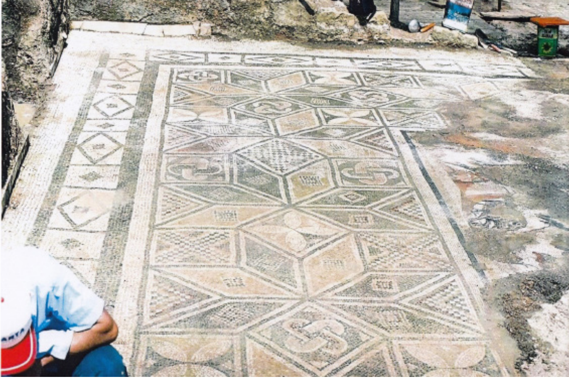
Resim 7 Prusias ad Hypium Akhilleus Mozaïği geometrik bordür (Konuralp Müzesi Arşivi).

birbirleriyle aralarında kalan kare şeklindeki boşlukların içerisine dönüşümlü olarak Süleyman Düğümü, dört yapraklı rozet ve çapraz biçimde dama tahtası motifi yerleştirilmiştir. Yıldızların üst ve alt kolları arasında kalan üçgen şeklindeki boşlukların içerisinde yine üçgen biçiminde dama tahtası motifi bulunmaktadır.