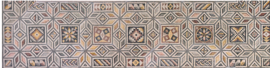
Resim 19 Zeugma Pasiphae ve Daedalos Mozağine bitişik olan Dionysos Mozaği geometrik bordür detayı (Önal 2009: res. 25).