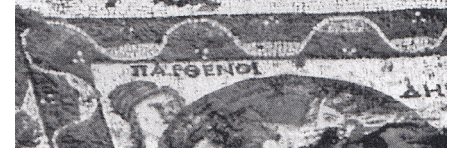
Resim 13 Prusias ad Hypium Akhilleus Mozaiği ana pano detayı (Dörner 1952: taf. 10).