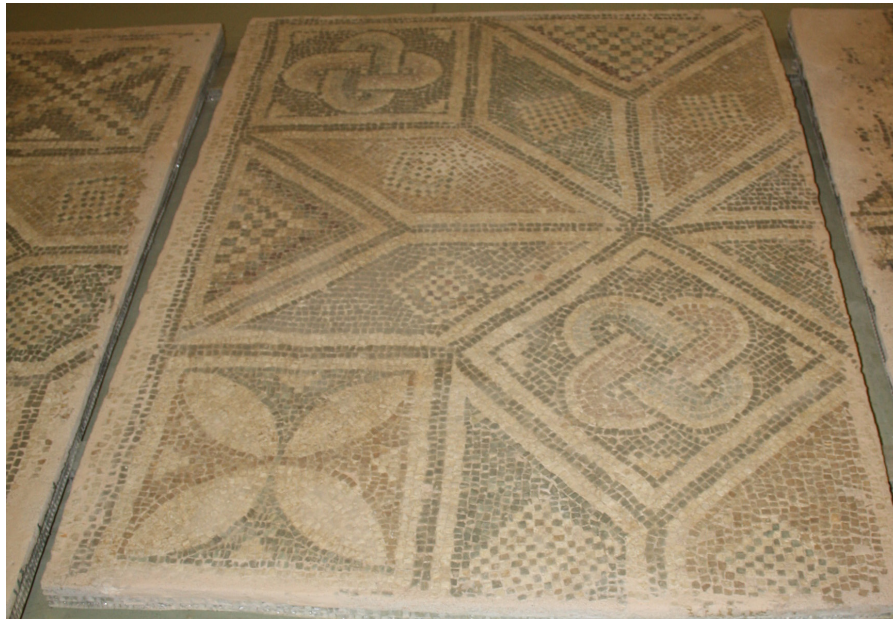
Resim 8 Prusias ad Hypium Akhilleus Mozaïği geometrik bordür ayrıntısı (S. Sezin Sezer).

Dört yapraklı rozetin yaprakları krem rengi iken yaprak aralarındaki boşluklar dönüşümlü olarak kahverengi ve yeşildir. Dama tahtası motifindeki küçük kareler dönüşümlü olarak kahverengi ve yeşildir. Süleyman Düğümü'nde de yine kahverengi ve yeşil renkler mevcuttur. Yıldızın diğer kollarında krem rengi, kahverengi ve yeşil renklere yer verilmiştir. Bordürleri ve motifleri ayıran kalın ve ince düz bantlarda koyu kahverengi kullanılmıştır.