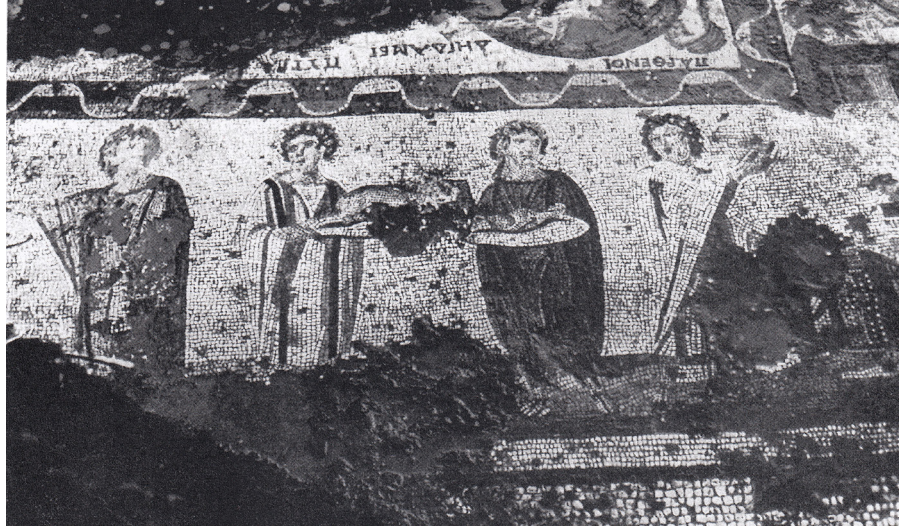
Resim 3 Prusias ad Hypium Akhilleus Mozaïği, 1952 yılındaki genel görüntüsü (Dörner 1952: taf. 10).

Mozaïğin ortasındaki merkez panoda Skyros Adası'nda Kral Lykomedes'in Sarayı'nda saklanan Akhilleus'un, Odysseus tarafından ortaya çıkarılması sahnesi tasvir edilmiştir (Res. 4). Merkez panonun etrafını ziyafete hazırlık sahnesi (Res. 5) ve av sahnesinden (Res. 6) oluşan geniş figürlü bir bordür çevirmiştir. Figürlü bordürün etrafı geniş bir geometrik bordür (Res. 7 - 11), (Çizim 1) tarafından çevrilmiştir.