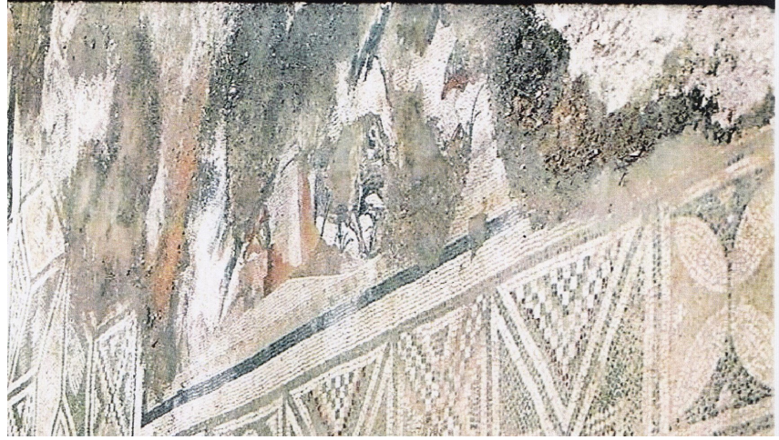
Resim 6 Prusias ad Hypium Akhilleus Mozaïği av sahnesi.

Av sahneleri mozaikler üzerinde İÖ geç 4. yüzyıldan itibaren görülmeye başlamış 12 ve oldukça sık tasvir edilmiştir 13 .