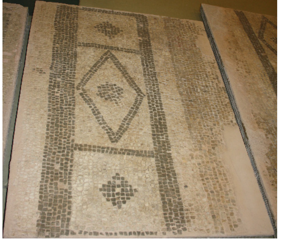
Resim 10 Prusias ad Hypium Akhilleus Mozaïği geometrik bordür ayrıntısı (S. Sezin Sezer).