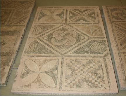
Resim 9 Prusias ad Hypium Akhilleus Mozaïği geometrik bordür ayrıntısı (S. Sezin Sezer).