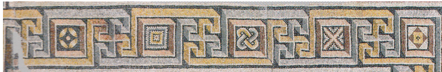
Resim 21 Zeugma Quintus Calpurnius Eutykhes Evi'ndeki Akhilleus Mozaği'ne bitişik olan Theonoe Mozaği geometrik bordür detayı (Önal 2009: res. 89).