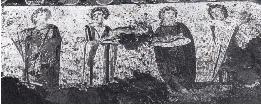
Resim 5 Prusias ad Hypium Akhilleus Mozaği ziyafete hazırlık sahnesi (Dörner 1952: taf. 10).

Sol baştaki birinci kadın figürü ayakta durmaktadır ve giyimlidir. Ayak bileklerine kadar uzun tunik üzerine himation giymiştir. Himationun kenarları kalın şeritlerle süslenmiştir. Gövdesi hafifçe sağa dönük iken başı ise kendi soluna dönüktür. Başına bitkisel bir çelenk yerleştirilmiştir. Sağ kolunu yukarıya doğru kaldırmış ve yana açmıştır, sol kolu tahrip olmuştur. Soldan ikinci kadın figürü ise ayak bileklerine kadar uzun bir tunik üzerine himation giymiştir. Himationun kenarları kalın şeritlerle süslenmiştir. Gövdesi hafifçe soluna dönük iken başı ise kendi sağına dönüktür. Başına bitkisel bir çelenk yerleştirilmiştir. Her iki kolunu dirsekten bükerek öne uzatmıştır ve elinde taşıdığı tepsi içerisinde muhtemelen et (?) bulunmaktadır. Soldan üçüncü kadın figürü de ayak bileklerine kadar uzun tunik üzerine himation giymiştir. Himationun kenarları kalın şeritlerle