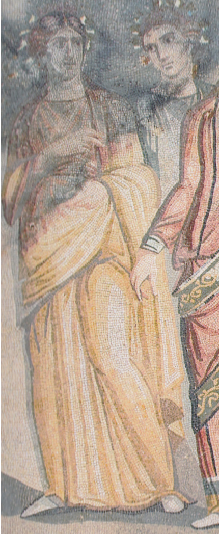
Resim 16 Zeugma Quintus Calpurnius Eutykhes Evi'ndeki Akhilleus Mozaïğine bitişik olan Theonoe Mozaïği'ndeki kadın figürü detayı (Önal 2009: res. 89).