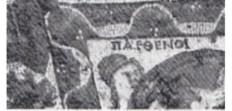
Resim 24 Prusias ad Hypium Akhilleus Mozaği ana pano yazıt detayı (Dörner 1952: taf. 10).