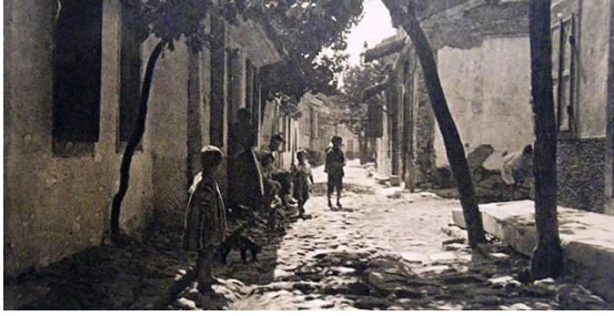
Şekil 8. Şinadika Mahallesi

Yangında yok olan Aya Demetrios, Aya Nikola ve Çikudya mahalleleri ise şimdiki Kültür Park alanı içinde kalan Basmane'nin bulunduğu bölgedir (Şekil 9).