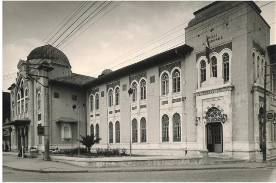
Şekil 13. Milli Kütüphane Caddesi (Nadir Nadi Caddesi olarak değiştirilmiş, daha sonra yeniden Milli Kütüphane Caddesi ismini almıştır)

Konak'a, Hatuniye ismi Kurtuluş'a ve Tepecik ismi Yenişehir'e dönüşmüştür. 2. Kahramanlar Ege, Karşıyaka Mersinlisi Çınarlı ismini almıştır. 1990'lı yıllarda bir belediye yönetiminin Milli Kütüphane Caddesi'nin ismini Nadir Nadi Caddesi olarak değiştirmesi, yerine gelen diğer belediye yönetiminin de yeniden Milli Kütüphane Caddesi ismine geri dönmesini de bu çerçevede değerlendirmek mümkündür (Şekil 13).