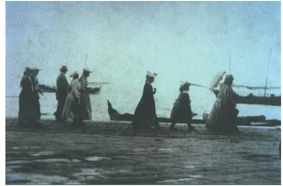
Şekil 1. Kordon'da Frenk kadınları

1850'li yıllarda bu mahallelerde ticaret evleri kurulmuş; bu oluşum İzmir'in sosyo-ekonomik yapısının değişiminde ve gelişiminde etken olmuştur. İzmir'in gündelik yaşam pratikleri değişmeye, Rum ve Levanten toplumunun yeni yaşam biçimleri İzmir'in başta Kordon olmak üzere mekânsal görünümünü farklılaştırmaya başlamıştır (Şekil 1).