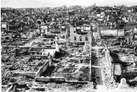
Şekil 9. Aya Demetrios, Aya Nikola ve Çikudya mahalleleri

Yukarıda sözü edilen birlikteliğin, kültürün ve sosyal hayatın yansıması olan mahalle, sokak ve semt adlandırmaları, etnik izlerin sosyal yaşantı uzantılarıdır