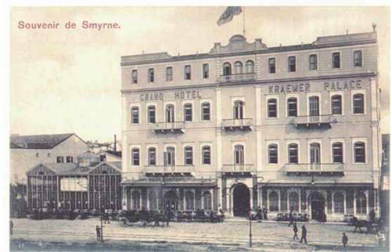
Şekil 2. Kramer Palas Oteli ve Club Hellenique

Rum ve Levanten toplumu, Kordon bölgesinde kendi yaşam alışkanlıklarını sürdürecek mekânlar yaratmışlardır. Özellikle yüksek gelir gruplarına yönelik pek çok kulüp ve dernek binası bu semtlerde oluşmuştur.