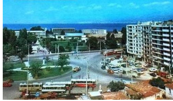
Şekil 12. Kennedy Meydanı

1.Dünya Savaşı yılları, II. Meşrutiyet’in ilânıyla birlikte yavaş yavaş benimsenmeye başlanan milliyetçilik hareketi, diğer yandan başta İngiltere olmak üzere, karşı safta yer alan yabancı devletlere karşı bir tepkinin ortaya çıkmasına neden olmuştur. Bu ülke vatandaşlarının yoğun biçimde bulunduğu İzmir’de tepki, daha hissedilir bir şekilde gerçekleşmiştir. Bu çerçevede, Vilayet ve Belediye encümenleri, Yunanca, İngilizce ve Fransızca olan bazı yer isimlerinin değiştirilmesini kararlaştırmıştır.