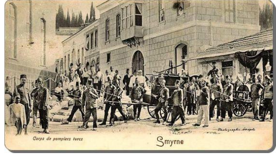
Şekil 5. Fasula Meydanı (At arabacılar meydanı)

Geçmişte, renkli ve hareketli esnafıyla İzmir'in en önemli meydanı Fasula Meydanı'dır (Şekil 4,5).