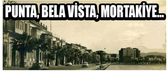
Şekil 6. Punta (Alsancak), Bela Vista (Gündoğdu), Mortakiye (Kahramanlar) (Eski ve yeni adlandırılmaları ile Yunan mahalleleri)

Yüz metreden fazla uzunluğu olan Fasula Meydanı'nın sona erdiği nokta Frenk Sokağı'dır (Yaranga, 2000). Yerleşim döneminde bu meydan çoğunlukla arabacıların bulunduğu meydandır.