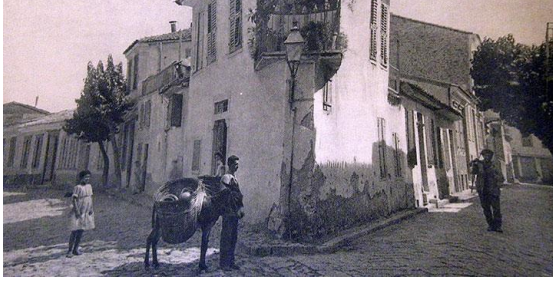
Şekil 7. Aya Vukla Mahallesi