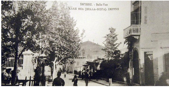
Şekil 4. Fasula Meydanı

Geçmişte, renkli ve hareketli esnafıyla İzmir'in en önemli meydanı Fasula Meydanı'dır (Şekil 4,5).