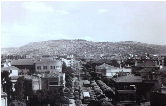
Şekil 11. Voroşilov Bulvarı, (1930'larda ismi İzmir’de bir caddeye verilen Sovyet generalin adıdır. I. Dünya Savaşı sonrası bozulan ilişkiler sebebiyle bu caddenin ismi Plevne Bulvarı olarak değiştirilmiştir).

Sokak isimlerinin değiştirilmesine yönelik, Cumhuriyet’in ilk yıllarına ait sokak ilan listeleri bir araya getirilince, şehrin sahip olduğu yeni mahallelerin isim listeleri ortaya çıkmaktadır. Mahalle, sokak, semt, cadde isimlerindeki değişiklikler, etnik isim değişikliklerine ilaveten büyük oranda milliyetçi izlerle oluşturulan mahalle isimlerinde gerçekleşmiştir (Şekil 11).