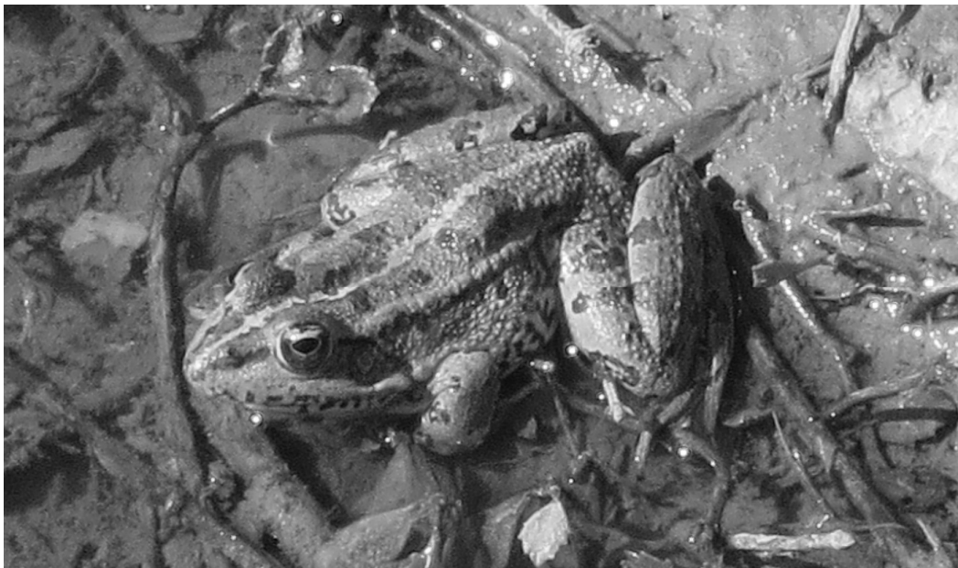
Abb.2. Ein Letoon-Frosch

Der erste Forschungsreisende, der am Originalschauplatz vorbeikam, war Charles Fellows am 17. April 1840: