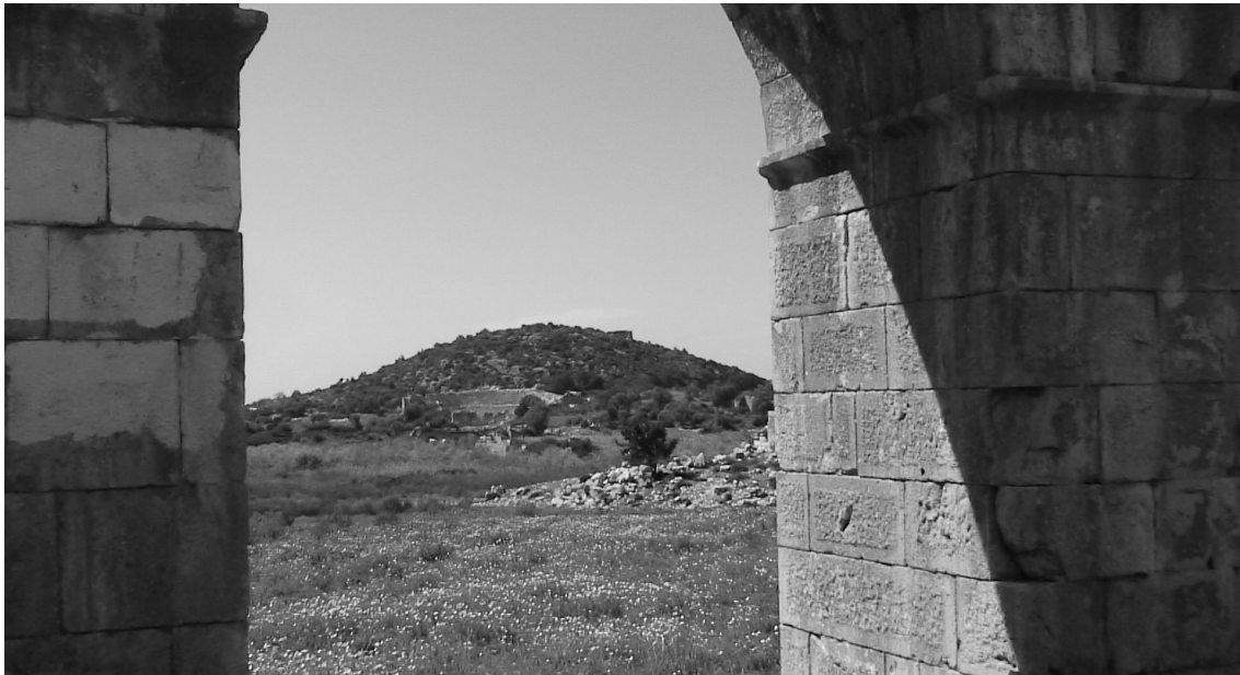
Abb.4. Der MONS Pa-tarali ?

Der Name dieser Stadt geht nach der bei Stephanos von Byzanz bewahrten Gründungssage auf ein Wort παταρα zurück, das κίστη bedeute, und Neumann hatte ihn deswegen 1955 (= 1994, 164ff.) mit hethitisch pattar/n- ‚Korb‘ verbunden. Diese Etymologie wird erst durch MONS Pa-tarali verständlich, als Vergleich des Hügels mit einem umgekehrten Korb.