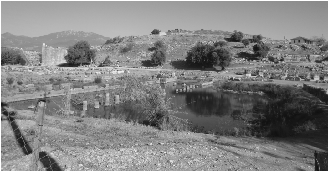
Abb.1. Der „rocky hill“ heute. Links das Theater.

Darstellen ließ diese Metamorphose der Bauern Ludwig XIV. im Latonabrunnen von Versailles und ebenso der spinnerte Bayernkönig Ludwig II. in seiner Versailles-Imitation auf der Herreninsel im Chiemsee: Diese Brunnen traten also an die Stelle des ursprünglichen Ortes.