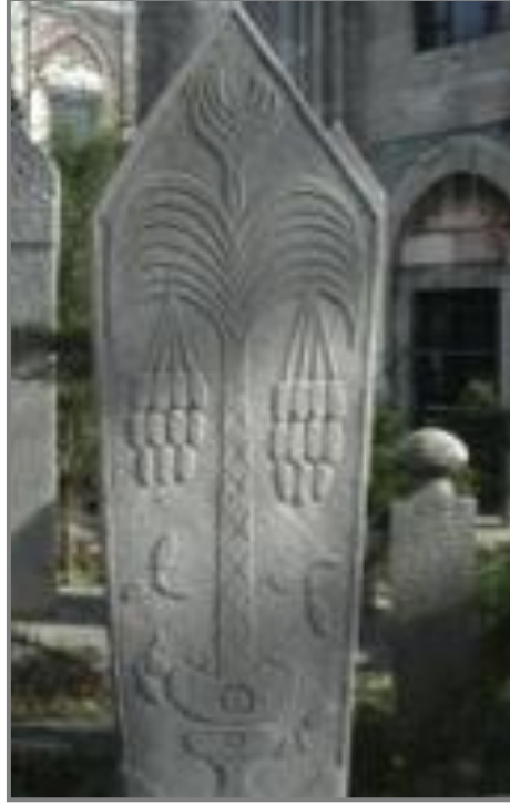
Şekil 7. 1830 tarihli Mehmet Kamil'e ait ayakucu şahidesi (Kaynak: Erdal, 2015).

Hurma, Osmanlılarda ve Selçuklularda; dokuma, işleme, örgü, bakır-taş işçiliği, çini yazma ve minyatürlerde kullanılmıştır (Serin, 2002). Hurma motifine 17. yy da Ladik seccadesinde rastlanılmaktadır. Aslanapa Ladik seccadelerinin kompozisyonunda, mihrabın alt veya üst tarafında yan yana sıralanan uzun sap halinde lale, çiçek veya hurma motifi (Şekil 8) ya da palmiyeye benzer ağaç motifleri karakteristik olduğunu belirtmiştir (Aslanapa, 1997; Aslanapa, 2005).