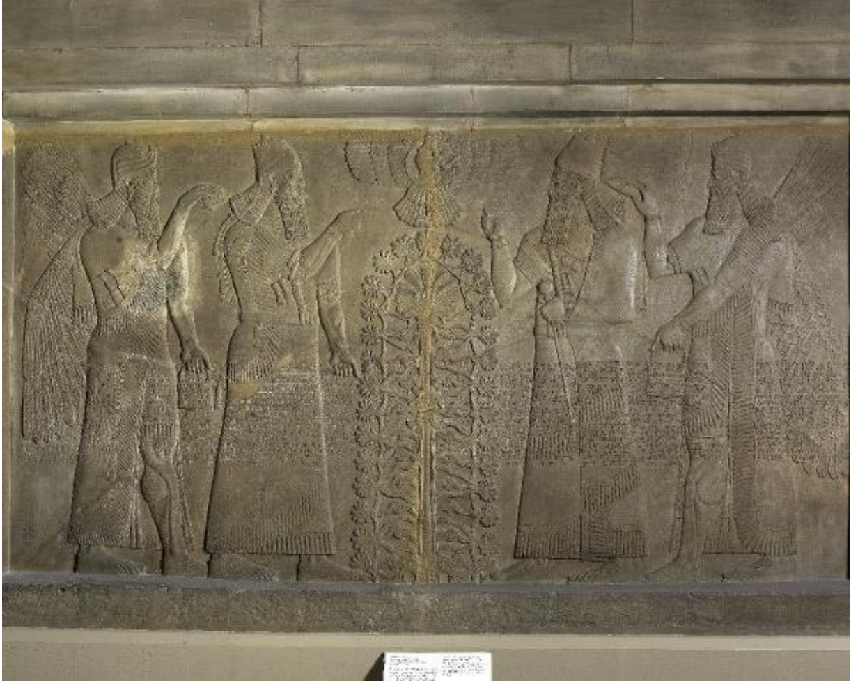
Şekil 1. Nimrud Antik Kenti'nde bulunan kuzeybatı sarayında sarayın duvar kabartması (Kaynak: URL-1, 2016).

bunun her iki yanında kral, kralın arkasında koruyucu tanrılar ve tüm sahnenin üzerinde de kanatlı disk sembolü içinde baş tanrı Asur gökten yere iner durumda betimlenmiştir (Ateş, 2012). Bu tasvirde hayat ağacı, ortada bir hurma ağacının etrafına dizilmiş stilize edilmiş 29 adet hurmayla çevrilmiş şekilde çizilmiştir (Şekil 1).