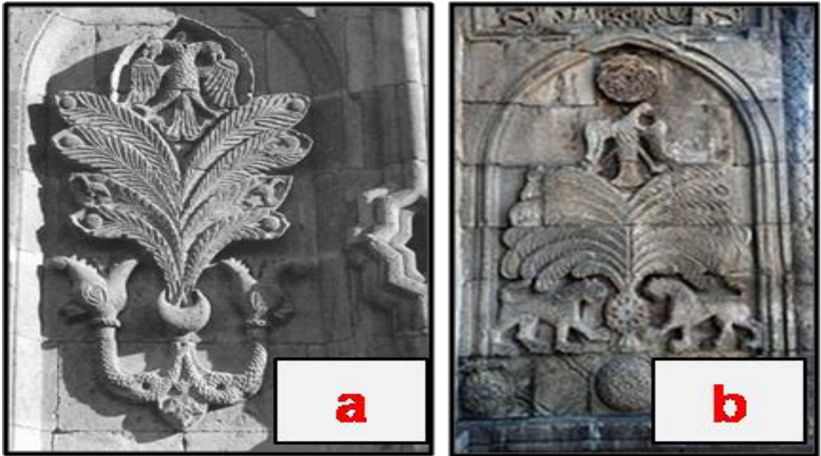
Şekil 5. a-Hayat ağacı simgesi-Erzurum Çifte Minareli Medrese b-Erzurum Yakutiye Medresesi (Kaynak: Kuban, 2008).

Her iki yanında hayvan figürü bulunan hayat ağacı motifinin güzel örneklerine Selçuklu dönemine ait Erzurum'da bulunan Yakutiye Medresesi ve Çifte Minareli Cami'nin dış cephelerinde görülmektedir (Şekil 5a, b).