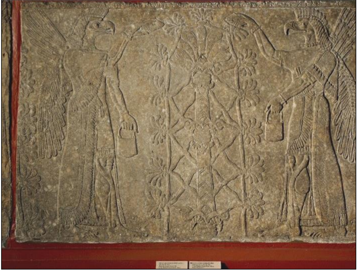
Şekil 4. Nimrud Antik Kenti'nde bulunan kuzeybatı sarayında sarayın duvar kabartması.

Her iki yanında hayvan figürü bulunan hayat ağacı motifinin güzel örneklerine Selçuklu dönemine ait Erzurum'da bulunan Yakutiye Medresesi ve Çifte Minareli Cami'nin dış cephelerinde görülmektedir (Şekil 5a, b).