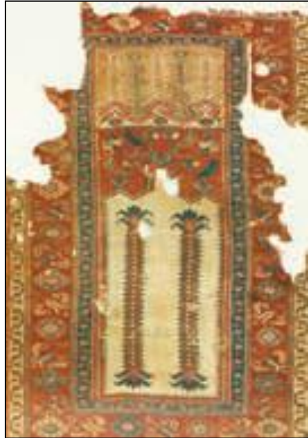
Şekil 8. 17. yy Ladik Halısı'nda hurma ağacı (Kaynak: Yurteri ve Ölmez, 2008).

Hurma, Osmanlılarda ve Selçuklularda; dokuma, işleme, örgü, bakır-taş işçiliği, çini yazma ve minyatürlerde kullanılmıştır (Serin, 2002). Hurma motifine 17. yy da Ladik seccadesinde rastlanılmaktadır. Aslanapa Ladik seccadelerinin kompozisyonunda, mihrabın alt veya üst tarafında yan yana sıralanan uzun sap halinde lale, çiçek veya hurma motifi (Şekil 8) ya da palmiyeye benzer ağaç motifleri karakteristik olduğunu belirtmiştir (Aslanapa, 1997; Aslanapa, 2005).