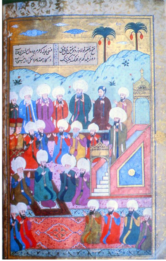
Şekil 9. 17. yy minyatürlü yazmada hurma ağacı (Kaynak: Seçkin, 2007).