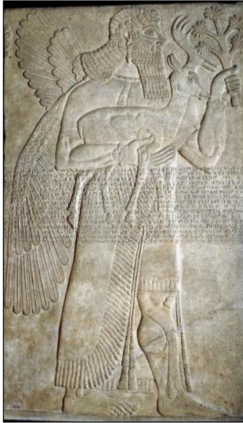
Şekil 3. Ashurnasirpal II, kuzeybatı saray duvarı kabartması (Kaynak: URL-2, 2016).