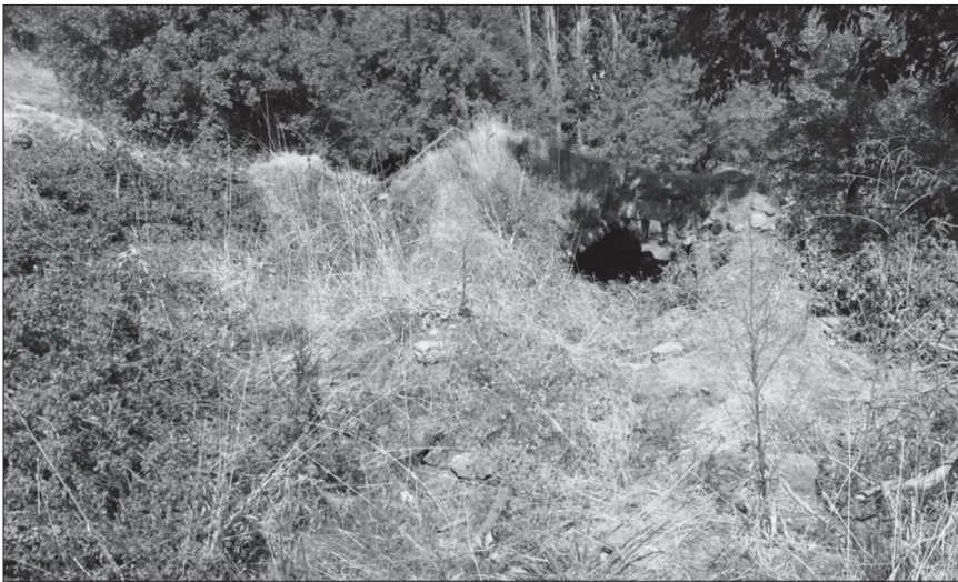
Sûretêk ji Kavilê Medreseya Mîr Hesênê Welî