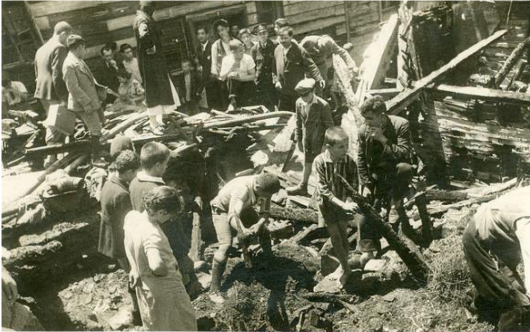
EK-3. Ankara Tahtakale Yangını 1929 ( http://www.hafizakaydi.org/buyukankarayangini/ )