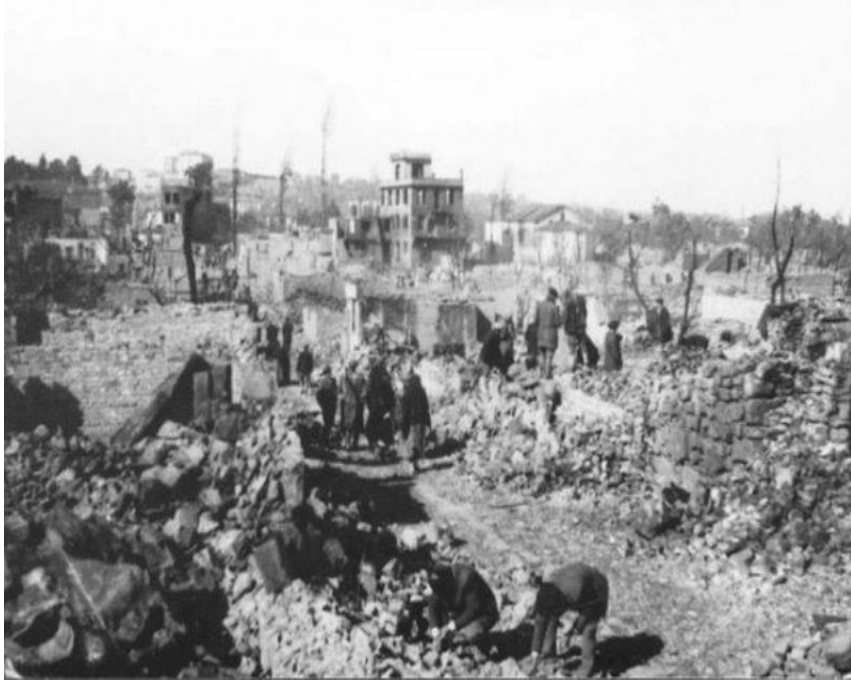
EK-4. Gerze Yangını 1956 ( http://www.vitrinhaber.com/gundem/unutulmayan-trajedi-buyuk-gerze-yangini-h8987.html )