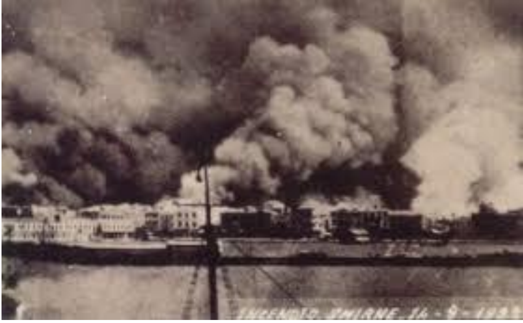
EK-2. İzmir Yangını 1922 ( https://www.turkcebilgi.com/1922_izmir_yang%C4%B1n%C4%B1 )