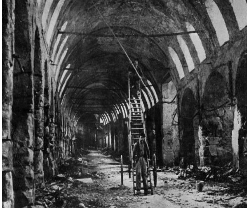
EK-5. Kapalı Çarşı Yangını 1954 ( http://www.dunyabulteni.net/haberler/236381/tarihte-bugun-kapalicarsi-tarihinin-en-buyuk-yanginini-yasadi )