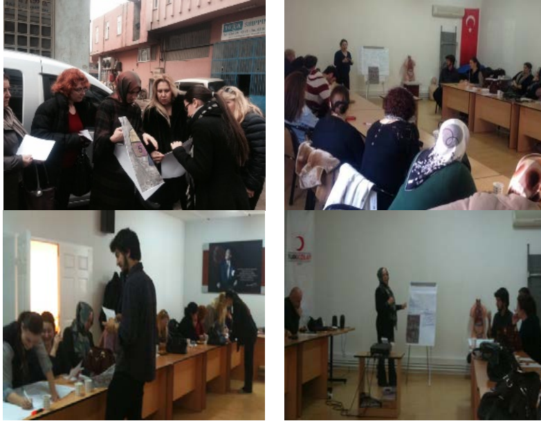
Şekil 1. Tuzla ilçesinde mahalli risk tespit saha ve masa başı çalışmaları (Okay ve diğ. 2014).

Kadınların planlama süreçlerine katılımının sağlanması, sosyoekonomik kapasite güçlendirme eğitimlerinin yanısıra afet eğitimi, acil eylem planlarına yönelik tatbikat ve tahliye eğitimlerinin de verilmesi gerekir. Bu kapsamda, yerel ve gönüllü organizasyonların kadının toplumsal rollerine ve sosyal kapasitesine yönelik verdikleri eğitimlerin genellikle tek yönlü bilgi akışı şeklinde olduğu gözlenmektedir (Takeuchi ve diğ. 2012; Okay ve diğ. 2014; 2016). Sadece riske yönelik tek-yönlü bilgi verilmesi yeterli olmamaktadır. Halkın kapasitesi, ihtiyaçları ve görüşlerinin anaakımlaştırıldığı bir risk iletişimi yaklaşımı daha başarılı olacaktır. Bu bağlamda, İstanbul'da İSKA tarafından desteklenen Tuzla İlçesi Afet Risk Yönetiminin Geliştirilmesi Projesi kapsamında toplumsal risk yönetimi çalışmaları gerçekleştirilmiştir (Okay ve diğ. 2014). Kızılay, belediye ve üniversite işbirliğinde, temel afet bilinci eğitimleri verilmiştir. Yerel gönüllü kadın grubu ile zarar azaltma planlaması ve risk azaltma stratejileri geliştirilmesinde mahalle risk tespit ve stratejik planlama çalışmaları yürütülmüştür (Şekil 1). Bölgede yapılan bu uygulamalı eğitim, saha ve masa-başı çalışmalarla mahalli riskler değerlendirilmiştir. Böylelikle, yerel kadın organizasyonunun afetlere karşı sosyal anlamda dirençliliğin sağlanması ve geliştirilmesi için karar verme kapasitelerini arttırmaya yönelik katılımcı planlama çalışmaları gerçekleştirilmiştir (Okay ve diğ. 2014).