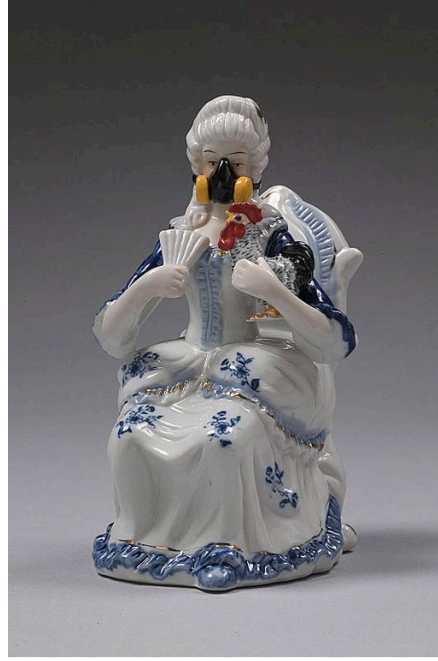
Görsel 5. Penny Byrne, 2006, H5N1. myModernMet . URL4

Kürk ticaretinin vahşeti ve evcil hayvanların derilerinin yüzülmesindeki artışı eleştiren, She Had Blood on Her Hands adlı yeniden yorumlanmış bir biblo çalışması ise hayvan postlarının bilinçli olarak farklı türler şeklinde etiketlenmesi ve bu ürünlerin moda endüstrisi tarafından “uyum” adı altında benimsenmesi, etik dışı uygulamaların estetik ve görkem uğruna nasıl sürdürüldüğünü ortaya koymaktadır. 2015 yılında ise EuropeEurope serisinde (Görsel 6) ise Avrupa’daki göçmen krizine odaklanırken, aynı zamanda tekneyle Avustralya’ya ulaşmaya çalışan mültecilerin durumuna da atıfta bulunuyor.