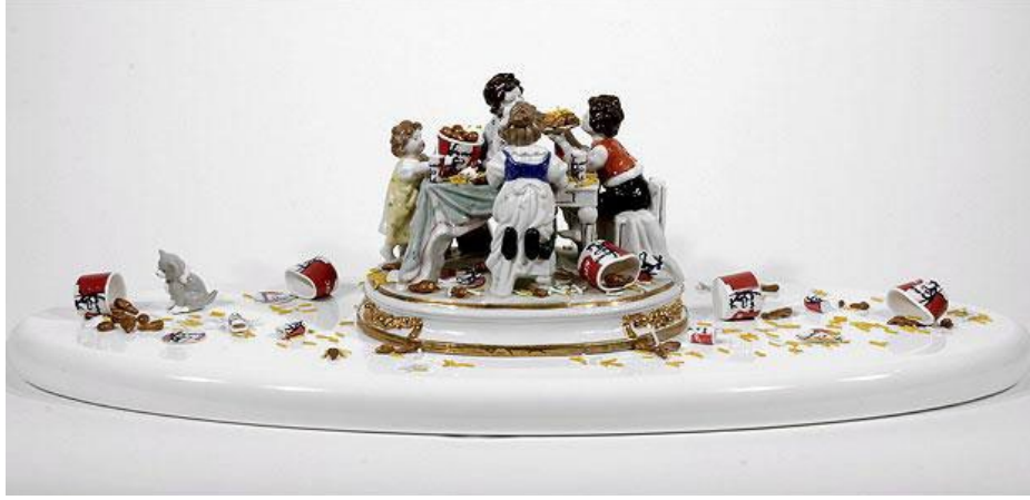
Görsel 8. Barnaby Barford, 2009, Aile Ziyafeti / Family Feast. The Good, The Bad, The Belle serisinden. BarnabyBarford . URL7

Disiplinlerarası üretim pratiğini seramik, heykel ve görsel hikâye anlatımı arasında kurduğu bağlarla şekillendiren Barford, bu yaklaşımını zamanla hareketli görüntü alanına da taşımıştır. Sanatçının animasyon alanındaki ilk denemesi olan Görsel 9'daki Damaged Goods , Barford'un animasyon dünyasına attığı ilk adımı ve porselen karakterleri için yenilikçi bir evren yarattığı bir yapım olarak öne çıkmaktadır. Antik bir eşya dükkanında yaşayan porselen figürlerinin oynadığı trajik bir hikâyeyi anlatmaktadır. Bu film, seramiklerin değer anlayışları üzerinden yasaklı aşk, maddi zenginlik ve sınıf ayrımları gibi kavramları derinlemesine keşfederken, aynı zamanda klasik yoksulluktan zenginliğe giden yolun tersine çevrildiği bir anlatım sunmaktadır. Barford, "Filmin rafları, karakterler için tüm dünyayı oluşturuyor," diyerek, "Bu karakterler, soylulukla değil, maddi zenginlik aracılığıyla toplumun farklı kesimlerini temsil ediyor; üst raflar, lüks kristal, gümüş ve altın eşyalarla süslenmişken, zemin yalnızca kırık, terkedilmiş eşyalarla dolu," şeklinde açıklamaktadır. Bu açıklama, karakter ve mekân tasarımında dramatik anlatımın nasıl etkili bir şekilde yakalandığını ortaya koymaktadır. Barford, animasyon projesi üretme fikrini ise her zaman eserlerini bir film sahnesi olarak hayal etmesi ve izleyicilerin her birinin farklı hikâyeler oluşturmasını sağlamayı hedeflemesiyle açıklamaktadır (Barnaby Barford, 2009).