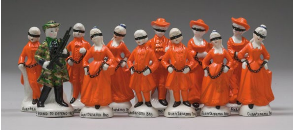
Görsel 4. Penny Byrne, 2007, Guantanamo Körfezi Hatıraları / Guantanamo Bay Souvenirs. Artlink.URL3

Penny Byrne; emaye boyalar ve epoksiyle birleştirerek oluşturduğu biblolarıyla, dünyanın mevcut durumuna eleştirel bir bakış sunmaktadır. Bryne, porselen bibloları yalnızca dekoratif ya da işlevsel bir unsur olarak değil, politik ve toplumsal eleştiriyi dile getiren bir araç olarak kullanma noktasında önemli bir yaklaşım sergilemiştir. Bu tutumunu, 2007 yılında gerçekleştirdiği Blood, Sweat and Fears adlı (Görsel 4) ilk büyük solo sergisiyle somutlaştırmıştır. Porselen figürinlerini yeniden modle ederek onların anlamlarını yapılandırmakta ve çağdaş toplumsal, politik meselelerle ilişkilendirilen eserler üretmektedir. Bryne bu müdahaleyi şöyle dile getirmiştir; "Eski porselen figürleri alıp kullanım amaçlarına müdahalede bulunarak, onları çağdaş dünyaya entegre ediyor ve 21. yüzyıla güncelliyorum. Bu antika objenin üzerine modern katmanlar eklemek, çoğu zaman beklenmedik ve çarpıcı bir kontrast yaratıyor." Byrne'in sanatsal pratiği, geleneksel seramik formlarını hem estetik hem de kavramsal düzeyde yeniden ele alarak, seramiğin yalnızca dekoratif bir öge olarak değerlendirilmesine karşı güçlü bir eleştiri sunmaktadır. Sanatçının figürinleri manipüle ederek onlara yeni bir anlam katması, seramiğin toplumsal meseleleri ele alma potansiyelini sanatın güçlü bir ifade aracı olarak gözler önüne sermektedir (Walton, 2017, s. 431).