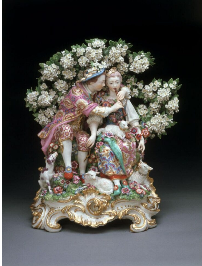
Görsel 1. Anonim, 1765, Müzik Dersi / Music Lesson. Victoria and Albert Museum, London. Antikalar . URL1

daha sınırlıdır. Özellikle 1760'lı yıllarda üretilen figür grupları ve vazolar, detaylı süslemeler, canlı renkler ve Sévres tarzı altın yıldız bezemeleriyle dikkat çekmektedir. François Boucher'ın gravürlerinden ilham alınarak tasarlanan Görsel 1'de yer alan Müzik Dersi ve Dans Dersi isimli porselen heykel, dönemin sanatsal beğenisini yansıtan önemli örneklerdendir. 1750 yılında Derby'de kurulan porselen fabrikası, Chelsea fabrikasının üretimiyle rekabet edebilecek kalitede figüratif porselenler üretmiş ve bu alanda önemli bir rol üstlenmiştir. Derby fabrikası, Rokoko üslubunda Çin figürleri ile dönemin modasına uygun kıyafetler giymiş hanımefendi ve beyefendi tasvirleriyle tanınmıştır. Bu gelişmeler, İngiltere'nin porselen üretiminde yalnızca teknik değil, estetik anlamda da Avrupa'daki diğer öncü üreticilerle yarışır bir düzeye ulaştığını göstermektedir (Coutts, 2001, s. 144-152).