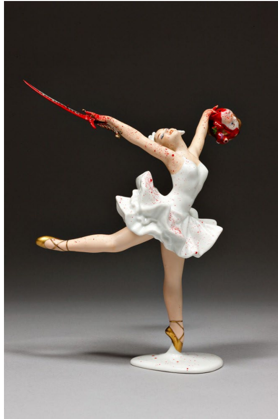
Görsel 3. Penny Byrne, 2010, Dans Pistinde Cinayet Var / It's Murder on the Dance Floor . HiFructose: The New Contemporary Art Magazine .URL2

alandaki çalışmalarını 2004 yılına dek sürdürmüş, aynı yıl Melbourne Fringe Festivali kapsamında Görsel 3'te yer alan It's Murder on the Dance Floor başlıklı eserle sergiye katılmıştır. Byrne'in elinde, onarımı mümkün olmayan bir porselen biblo bulunduğundan, söz konusu nesneyi ilk asamblaj (birleştirme) çalışmasının temel malzemesi olarak kullanmaya karar vermiştir. Ortaya koyduğu eser, bir elinde kılıç sallayan, diğer elinde ise kanlı ve kesik bir baş tutan bir balerini betimlemektedir. Byrne, bu bağlamda şu ifadeleri kullanmaktadır: "Konservasyon perspektifinden bakıldığında yaptığım şey tamamen uygun değildir. Nesnelere kutsal kabul edilir; onlara zarar verilmemeli, tahrip edilmemeli ya da herhangi bir biçimde dönüştürülmemelidir. Bu nesnelere yaptığım şey tam anlamıyla dehşet verici." Bununla birlikte, kitsch (bayağı süs eşyası) figürinlerin hem estetik niteliklerine hem de kendilerine özgü tuhafıklarına karşı bir yakınlık ve takdir geliştirdiğini de dile getirmektedir. "Bir bakıma onları kurtarıyor ve onlara yeni bir yaşam olanağı sunuyorum," ifadesiyle bu yaklaşımını açıklamaktadır. Yine de sanat üretimi ile restoratörlük görevini aynı gün içinde sürdürebilmenin mümkün olmadığını ve bu iki uğraşı ayrı günlerde gerçekleştirdiğini belirtmektedir (Weiss, 2013, s. 42).