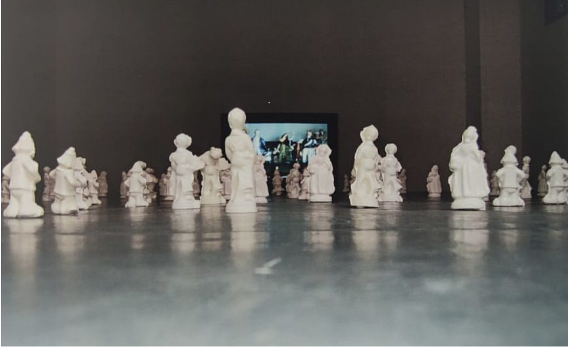
Görsel 11. Andrew Livingstone, 2007, Ünlü Takıntısı / Celebrity Obsession.

Livingstone, kilin maddeselliğini kavramsal bir araç olarak kullanır ve figürin nesnesinin hem ev içi hem de müze bağlamlarında belirgin bir anlamsal değere sahip olduğunu vurgular. Figürinlerin seramik üretim süreci içerisindeki dönüşümü, seramik disiplini açısından anlamlı bir etki yaratır. Bu bağlamda, pişmemiş ve pişirilmiş materyaller arasında kurulan simbiyotik ilişki dikkat çeker. Görsel 11’deki Livingstone’ın aynı yıl ürettiği bir diğer çalışması olan “Celebrity Obsession” videonun yerleştirmeye dahil edilmesiyle birlikte, sanatçının karma medya pratiğinde kayda değer bir ilerlemeye işaret eder. Elisa Siegel’in “Into the Room of Dream” adlı eserine benzer biçimde, bu yerleştirme izleyiciye, başka bir izleyici kitlesine tanıklık ediyormuş hissi uyandırır. Ancak bu bağlamda söz konusu olan izleyici kitlesi, geleneksel tekniklerle biçimlendirilmiş ancak tamamlanmamış seksen adet sırsız porselen figürden oluşur.