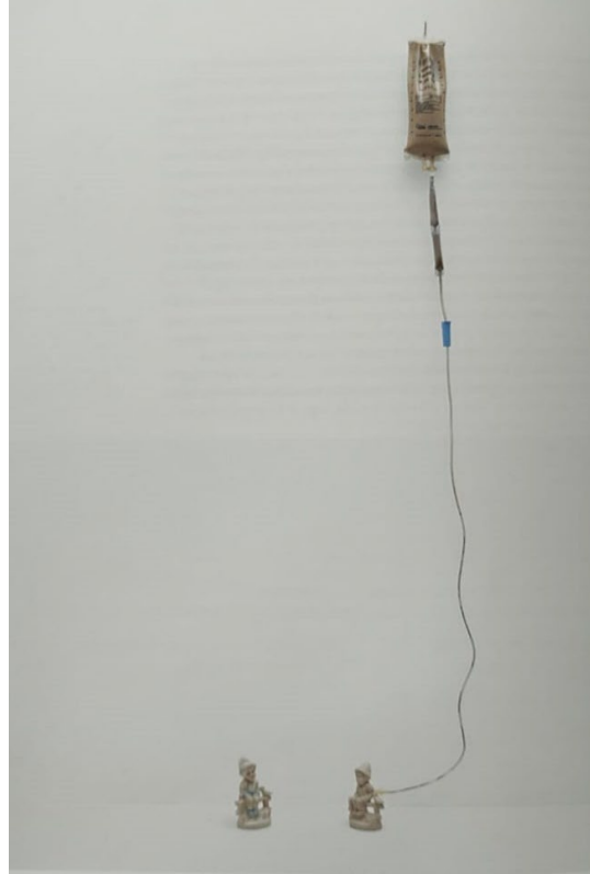
Görsel 10. Andrew Livingstone, 2006, Otomaddesellik / Automateriality.

Andrew Livingstone, Görsel 10'daki Automateriality adlı eserinde, figürün temsiline dair geleneksel anlayışları tersine çevirerek eleştirel bir yaklaşım sergilemektedir. Eserde, bir tarafta geleneksel lederhosen (deri pantolon) giymiş bir Alman çocuğunun stilize edilmiş bir porselen biblosu yer alırken, diğer tarafta bu figürün pişirilmemiş bir kopyası bulunmaktadır. Bu kopya, seramik astar sıvısı ile beslenen bir formda olup, damarsal besleme yöntemiyle sürekli olarak ıslak kil ile beslenmektedir. ıslak kilin sürekli olarak figüre verilmesi, sanatçının eserin "canlı" olduğu fikrini vurgulamasına olanak tanır. Bu durum, hazır ve değişimden yoksun olan biblo ile karşılaştırıldığında, canlılık ve sürdürülebilirlik kavramlarını çağrıştırarak güçlü bir zıtlık yaratmaktadır. Livingstone, bu sürecin özellikle figürün hasta olduğu ve hayatta tutulduğu gerçeğiyle izleyiciye şok edici bir görsel deneyim sunduğunu belirtmektedir. Eserdeki ıslak kil sıvısı, kan ve vücut sıvılarının yerini alarak anlam katmanlarını derinleştirir (Strauss, 2012, s. 265).