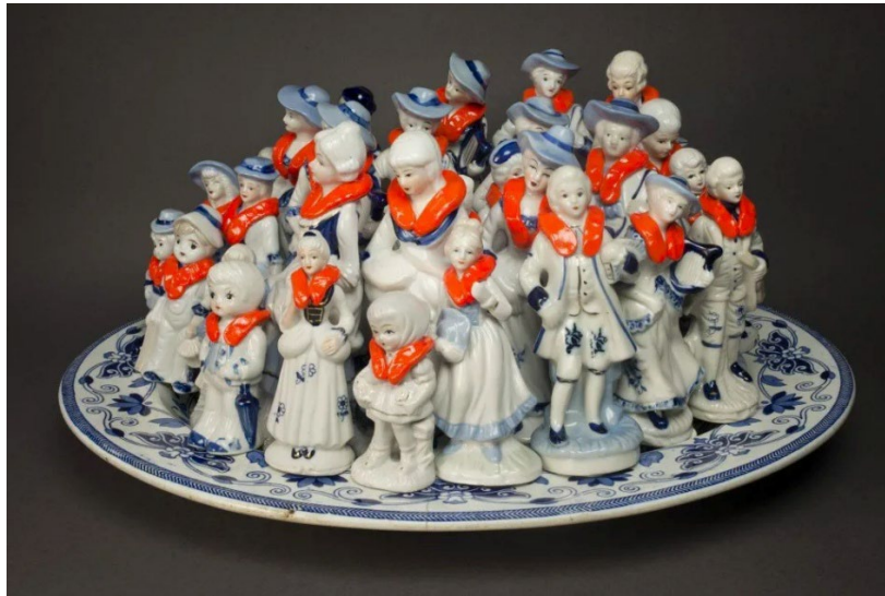
Görsel 6. Penny Byrne, 2015, AvrupaAvrupa/EuropeEurope. Pennybyrneartist . URL5

Kürk ticaretinin vahşeti ve evcil hayvanların derilerinin yüzülmesindeki artışı eleştiren, She Had Blood on Her Hands adlı yeniden yorumlanmış bir biblo çalışması ise hayvan postlarının bilinçli olarak farklı türler şeklinde etiketlenmesi ve bu ürünlerin moda endüstrisi tarafından “uyum” adı altında benimsenmesi, etik dışı uygulamaların estetik ve görkem uğruna nasıl sürdürüldüğünü ortaya koymaktadır. 2015 yılında ise EuropeEurope serisinde (Görsel 6) ise Avrupa’daki göçmen krizine odaklanırken, aynı zamanda tekneyle Avustralya’ya ulaşmaya çalışan mültecilerin durumuna da atıfta bulunuyor.