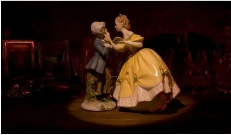
Görsel 9. Barnaby Barford (Yönetmen: Barnaby Barford), 2008, Hasarlı Mallar/Damage Goods. Stop-frame ve 2D animasyon, 10 dk., 16:9, SD digital file. Motionographer . URL9

Disiplinlerarası üretim pratiğini seramik, heykel ve görsel hikâye anlatımı arasında kurduğu bağlarla şekillendiren Barford, bu yaklaşımını zamanla hareketli görüntü alanına da taşımıştır. Sanatçının animasyon alanındaki ilk denemesi olan Görsel 9'daki Damaged Goods , Barford'un animasyon dünyasına attığı ilk adımı ve porselen karakterleri için yenilikçi bir evren yarattığı bir yapım olarak öne çıkmaktadır. Antik bir eşya dükkanında yaşayan porselen figürlerinin oynadığı trajik bir hikâyeyi anlatmaktadır. Bu film, seramiklerin değer anlayışları üzerinden yasaklı aşk, maddi zenginlik ve sınıf ayrımları gibi kavramları derinlemesine keşfederken, aynı zamanda klasik yoksulluktan zenginliğe giden yolun tersine çevrildiği bir anlatım sunmaktadır. Barford, "Filmin rafları, karakterler için tüm dünyayı oluşturuyor," diyerek, "Bu karakterler, soylulukla değil, maddi zenginlik aracılığıyla toplumun farklı kesimlerini temsil ediyor; üst raflar, lüks kristal, gümüş ve altın eşyalarla süslenmişken, zemin yalnızca kırık, terkedilmiş eşyalarla dolu," şeklinde açıklamaktadır. Bu açıklama, karakter ve mekân tasarımında dramatik anlatımın nasıl etkili bir şekilde yakalandığını ortaya koymaktadır. Barford, animasyon projesi üretme fikrini ise her zaman eserlerini bir film sahnesi olarak hayal etmesi ve izleyicilerin her birinin farklı hikâyeler oluşturmasını sağlamayı hedeflemesiyle açıklamaktadır (Barnaby Barford, 2009).