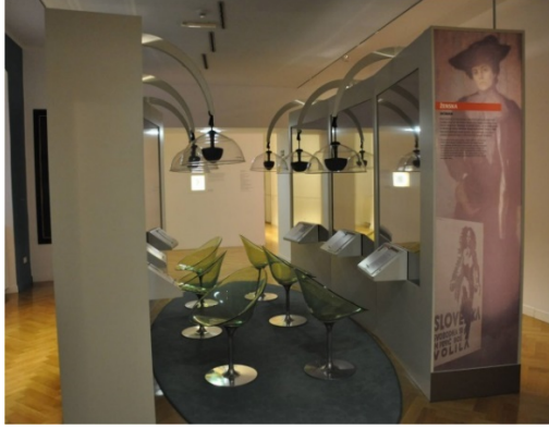
Resim 12 (sol). Ljubljana Kent Müzesi (Slovenya)'ndeki Mikro Galeride müze koleksiyonunun bilgisayarlar aracılığıyla ayrıntılı olarak incelenebildiği bir dijital öğrenme alanıdır.