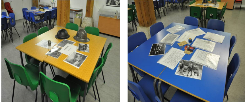
Resim 10 ve 11. Londra Docklands Müzesi, II. Dünya Savaşı temalı Eğitim Çalışması Nesnelere.

Türü ne olursa olsun müzelerde dokun-yap (hands-on) etkileşimine olanak sağlamak müzede öğrenmeyi kolaylaştırmakta ve pekiştirmektedir. Bu yolla öğrenme ve eğlenme bir arada gerçekleşirken aynı zamanda koleksiyona ve temaya ilişkin konu nesne bağlamında öğretilebilir. Dokunmalı ve etkileşimli sergilerin bireylerin ya da grupların gerçek nesnelere ya da gerçek olguları fiziksel keşfetme yoluyla birlikte anlama girişimlerini cesaretlendiren açık eğitsel hedefleri vardır.