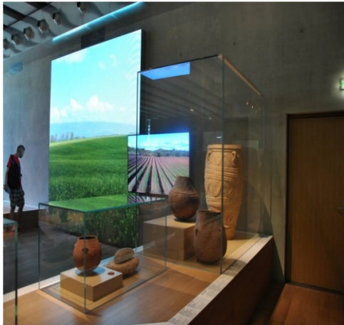
Resim 4 (sağ). MUCEM’de Akdeniz’de Tarım Temalı Etkileşimli Sergi.