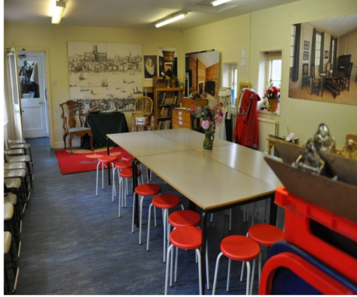
Resim 13 (sağ). Geffrye Müzesi Keşif Galerisi. Galeride aynı zamanda eğitim atölyesi olarak kullanılmaktadır.