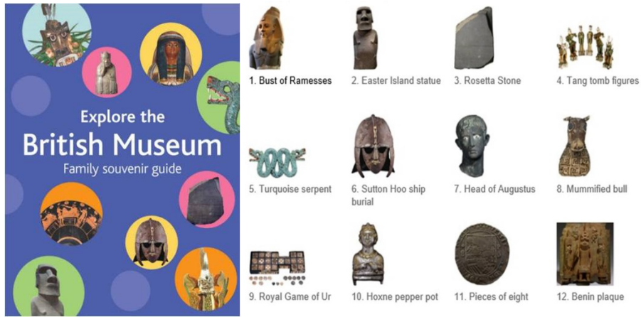
Resim 5 ve 6. Aile Rehberi ve Çocuklarla birlikte Görülebilecek 12 Nesne, British Müzesi.

görseller, videolar, basit video oyunları, etkileşimli haritalar, bilgi ve görevler ter almaktadır. Aileler için hafta içi belli gün ve saatlerde müze rehberleri turları Müzenin eğitim merkezi Samsung Dijital Keşif Merkezi'nde her hafta sonu dijital öğrenme atölyeleri (dijital çizim ve 3 boyutlu modelleme çalışmaları gibi) hazırlanmaktadır. Öte yandan müzenin sürekli ya da geçici sergilerle bağlantılı aile rehber kitapları da bulunmaktadır. Müzede sınırlı sayıda olmakla birlikte Antik Yunan, Mısır Uygarlığı, Roma Uygarlığı, Afrika Macerası, Muhteşem Meksika ve Arkeolog Olmak adlı etkinlik çantaları bulunmaktadır. Bu çantalar randevu sistemiyle aileler tarafından alınan ve 90 dakika boyunca farklı malzemelerle çocuklarla birlikte müze galerilerinde aile eğitimine olanak sağlayan paketler biçiminde tasarlanmıştır. Müze aileler için hazırlanan tüm etkinlik programlarını aylık bir e-gazete ile internet üzerinden düzenli olarak duyurmaktadır.