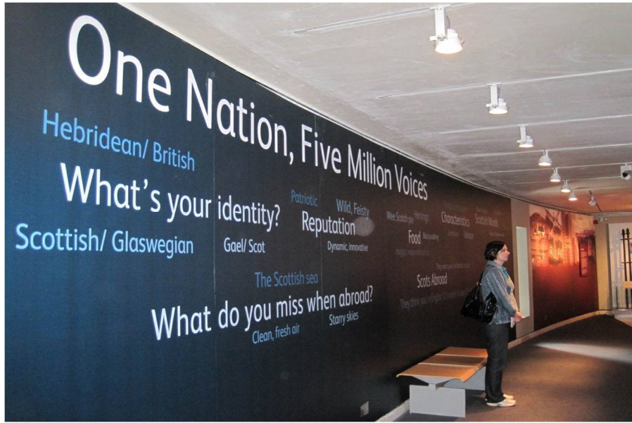
Resim 9. Bir Ulus Beş Milyon Ses Sergisi, İskoç Tarih Müzesi.

İskoç Tarih Müzesi 'nin üç sergisinde izlenmektedir. İlk sergi, İskoç Krallığı adıyla ziyaretçiyle buluşmuştur. İkinci sergi İskoçya: Değişen Toplum 'dur. Sergi, insanlar, sınırlar ve devinimler temasına odaklanmaktadır. Üçüncü sergi Bir Ulus: Beş Milyon Ses 'tir (Whitehead, Mason ve Eckersley, 2012). İskoçya: Değişen Toplum sergisi , bir toplumu şekillendiren tarihi ve politik olaylar bağlamında değişimi ele almaktadır. Bu değişimi ele alırken müze uzmanları ve tasarımcılar tarih kurumları, üniversiteler ve medya kuruluşlarıyla işbirliği kurmuşlardır. Sergide I. Dünya Savaşı'ndan günümüze İskoçya'nın yaşadığı politik, ekonomik ve sosyal olaylar, ülkenin tarihine damga vuran iç ve dış göçler, endüstrileşme, gündelik yaşam vb. bireysel hikâyeler, filmler, videolar, müzik ve şiir dinletileri aracılığıyla anlatılmaktadır. Sergi, "İskoçlar, Biz Kimiz?" sorusunun yazılı olduğu ve farklı yaş, cinsiyet ve ırktan insanın fotoğraflarının bir araya getirilerek oluşturulduğu bir kolaj ile tanıtılmaktadır. Tasarıma ilişkin kolaj fikri müze izleyicilerine aittir.