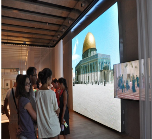
Resim 3 (sol). MUCEM (Akdeniz Medeniyetleri Müzesi) Kudüs Etkileşimli Görsel Sunum