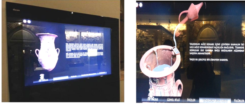
Resim 1 ve 2. Anadolu Medeniyetleri Müzesi İnadık Vazosu Etkileşimli (interaktif) Ekran.

Müzeler günümüzde yaşamlarına devam etmek için koleksiyonlarına değişmez bir anlayışla bakmaktan vazgeçmekte, sergileme ve sunumun çoğu zaman nesneden bile önemli olduğunu iddia etmektedir. Klasik müzenin durağan ortam algısından, yeni sunum ve anlatım yöntemlerinin kullanıldığı ve kültür ünitesi olarak yeniden kurgulanan çağdaş müzecilik anlayışının benimsenmesi etkilerini müze eğitiminde de göstermektedir. Müze eğitimi, ziyaretçilerine kendi yorumlama stratejilerini ve dağarcıklarını harekete geçiren bir görsel öğrenme ortamı sunar (Greenhill, 2000). Dolayısıyla görsel kültür unsurlarını müze koleksiyonunu anlatmak amacıyla yönelik kullanmak çağdaş müzenin öncelikleri arasındadır. Koleksiyonu anlatmak sürecinde Artar'ın (2010) da vurguladığı gibi ziyaretçilerin sergi bileşenlerini anlamlandırması için geçerli öğeler üzerine yoğunlaşmak gerekmektedir. Müzede eğitsel düzenlemelerde izleyicinin ne göreceği, nasıl yön belirleyeceği, neye odaklanması gerektiği ve dikkat çekici olmanın neden önemli olduğu görsel kültür unsurları kullanılarak vurgulanmalıdır. Bu bağlamda müze sergilerinde aynı zamanda teknolojik deneyimlerin ve görüşlerin paylaşılması da amaçlanarak bilgisayar ekranları, hologram (dijital karşılayıcı), sanal gezi, etkivizyon, üç boyutlu tarama, simülasyon, üç boyutlu modelleme ve dijital uygulamalar gibi görsel kültür unsuru eğitsel yardımcı materyaller yer almaktadır.