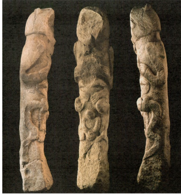
Res. 20: Totemik Heykel