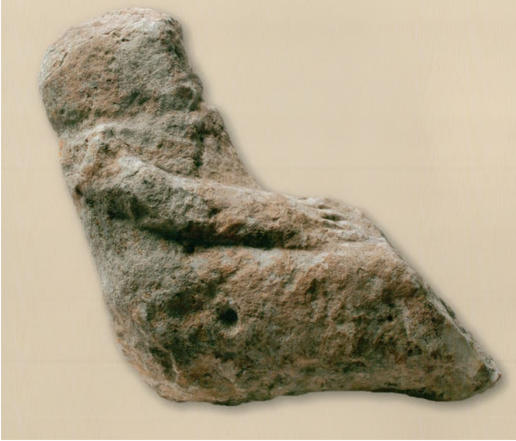
Res. 15: Oturan İnsan Heykelciği