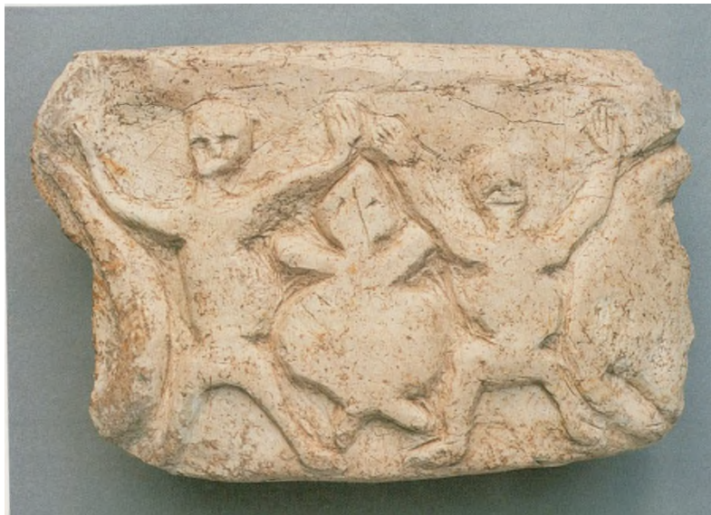
Res. 22: Dans eden erkekler (Kaynak: Rosenberg 2011:Fig. 22)