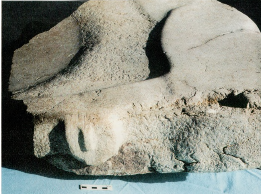
Res. 6: Terrazzo Yapısından Stilize İnsan Yüzü Kabartması