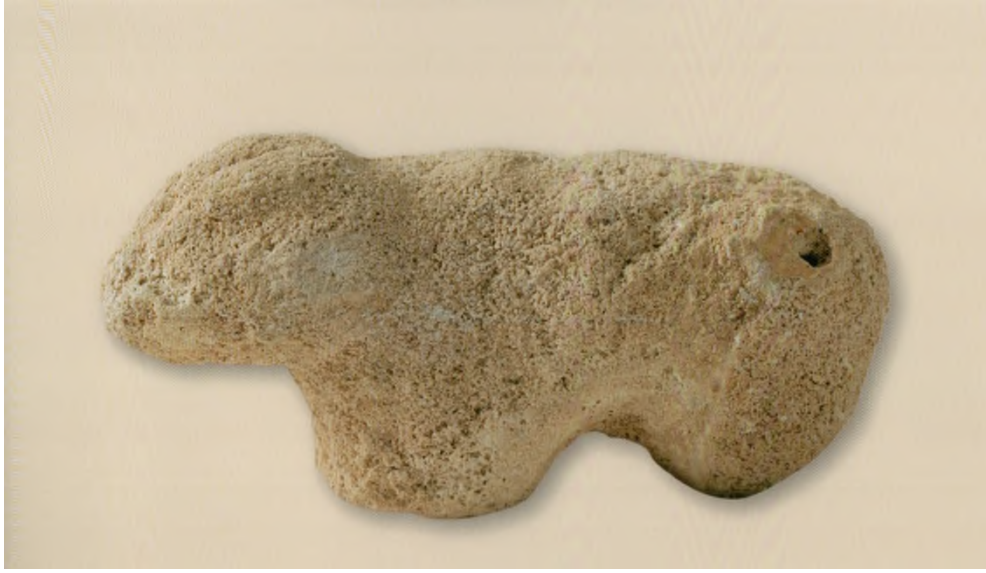
Res. 18: Hayvan Heykelciği