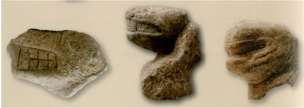
Res. 21: Saldırı Pozisyonundaki Hayvan Başları