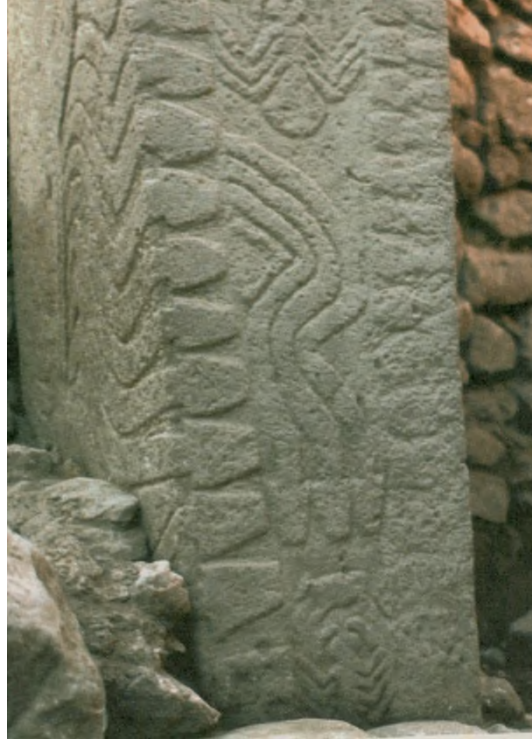
Res. 14: Dikilitaş 33'deki Yılan Kabartması