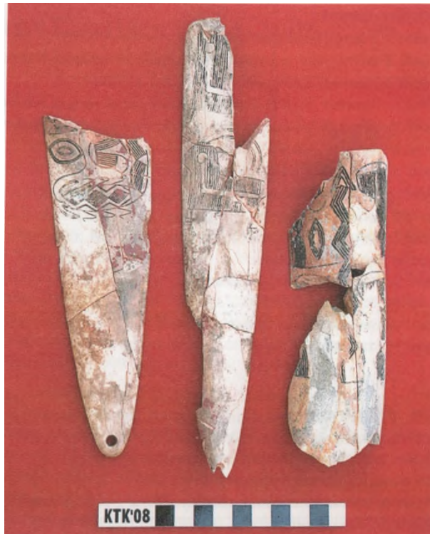
Res.12: Kemik RitüelObjesi