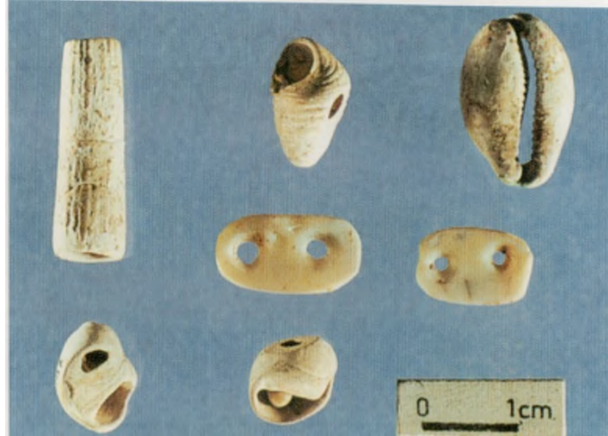
Res. 7: Deniz Kabuğu Mezar Hediyesi