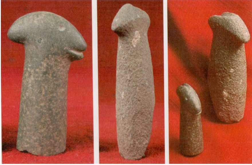
Res. 3: Havan Elleri