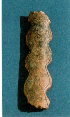
Res. 5: Kemik Nesneleri (Kaynak; Rosenberg 2011b: Fig. 16)