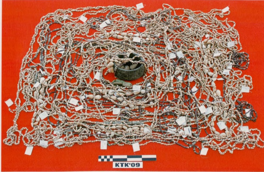
Res.10: Çeşitli Mezar Hediyeeri