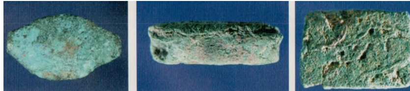
Res. 8: Bakır ve Malahit Mezar Hediyesi