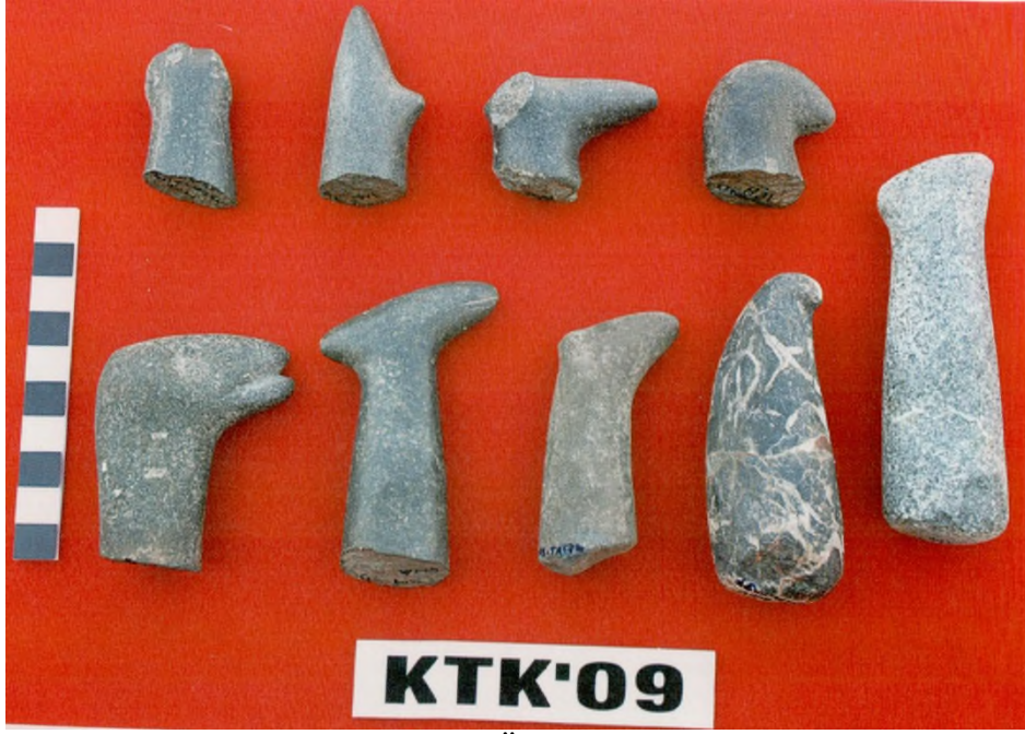
Res.13: El Baltaları (Kaynak: Özkaya ve Coşkun 2011: Fig.24)