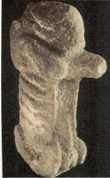
Res. 19: Erekte Falluslu Heykel (Kaynak: Schmidt 2011: Fig.24)