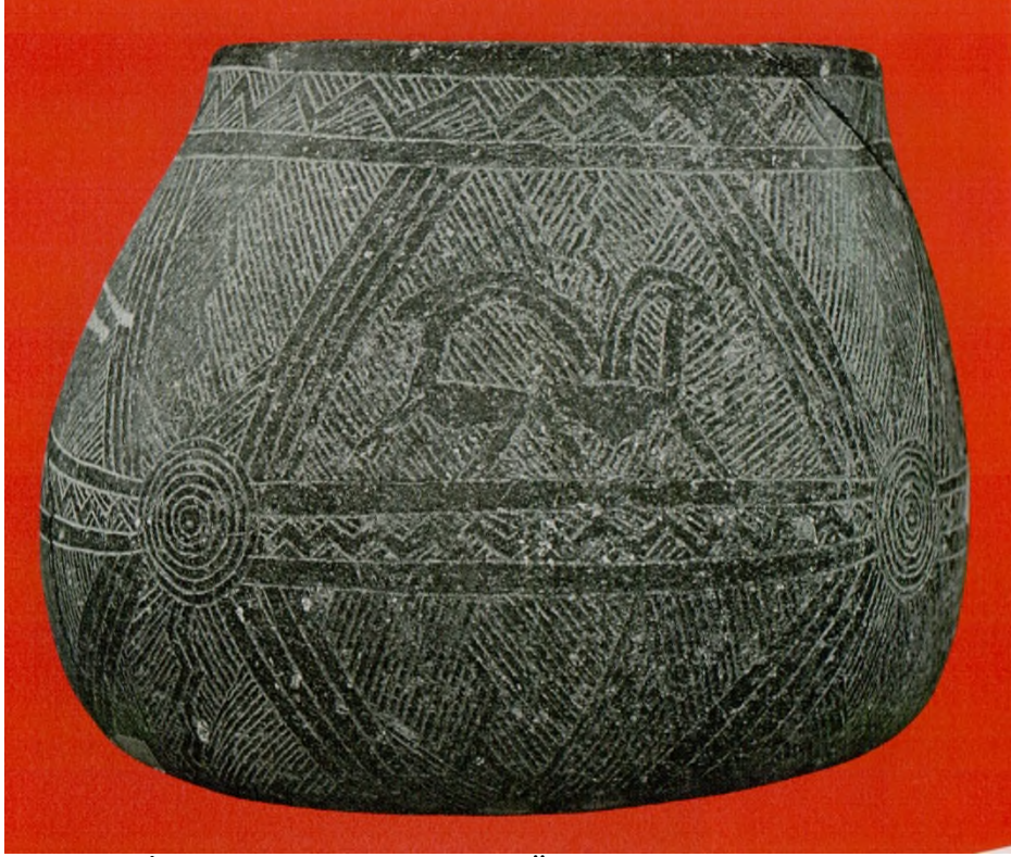
Res. 9: İşlemeli Taş Kap