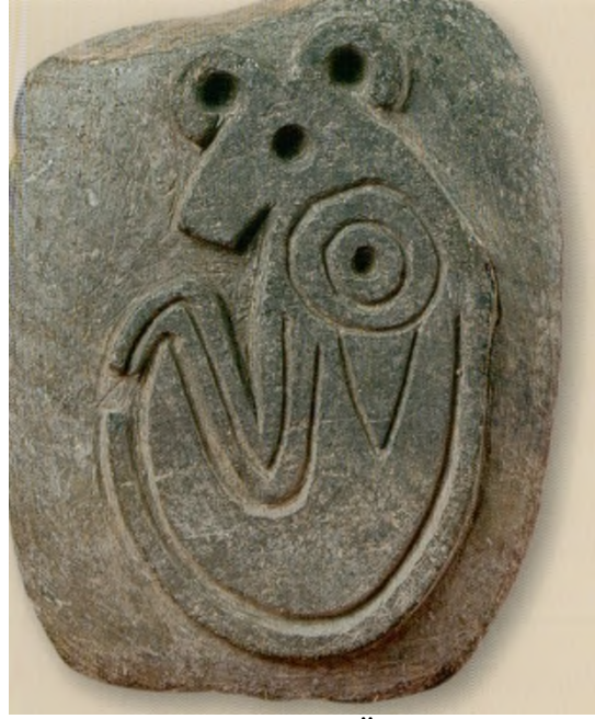
Res. 11: Figürlü Taş Ritüel Objeler