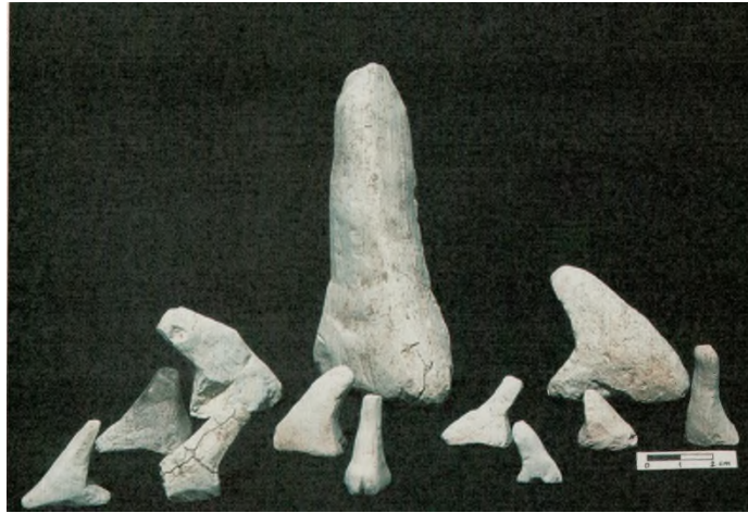
Res. 24: Phalluslar (Kaynak: Özdoğan2011:Fig. 24)