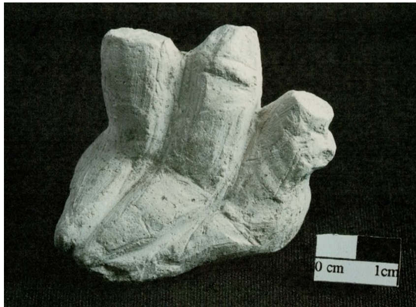
Res. 25: Üçlü Phalluslar