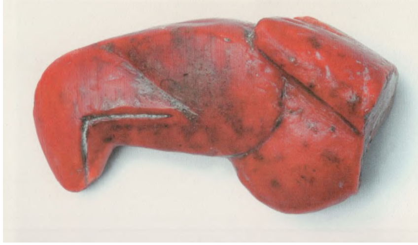
Res. 17: Akbaba Başı