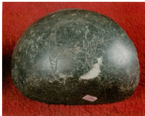
Res. 2: Tören Kabı (Kaynak; Rosenberg 2011b: Fig. 11)