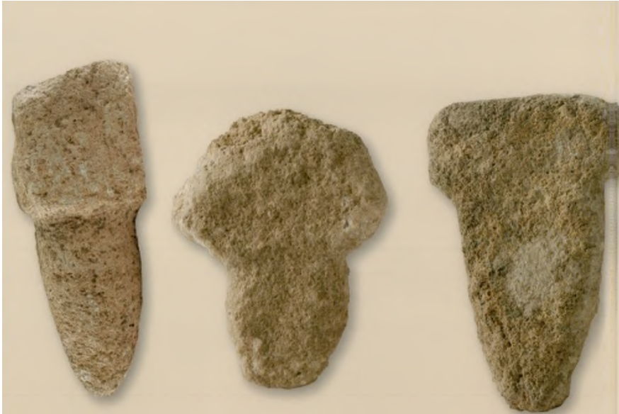
Res. 16: Minyatür Dikilitaşlar