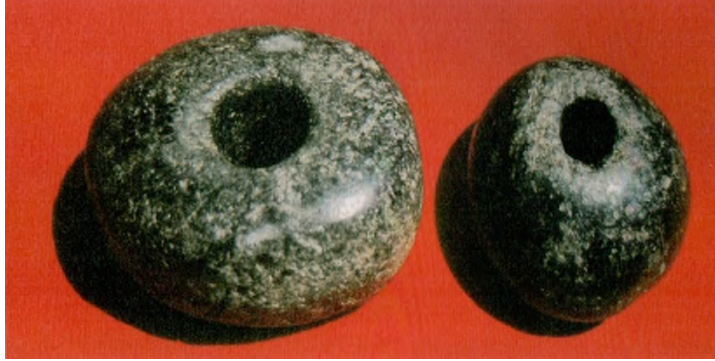
Res. 4: Topuz Başları (Kaynak; Rosenberg 2011b: Fig. 17)