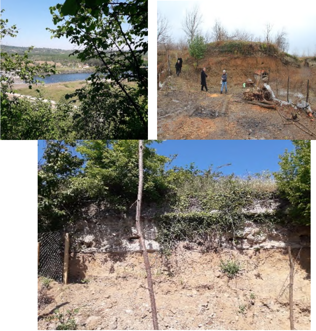
Resim 8: Kaleden Genel Görünüm