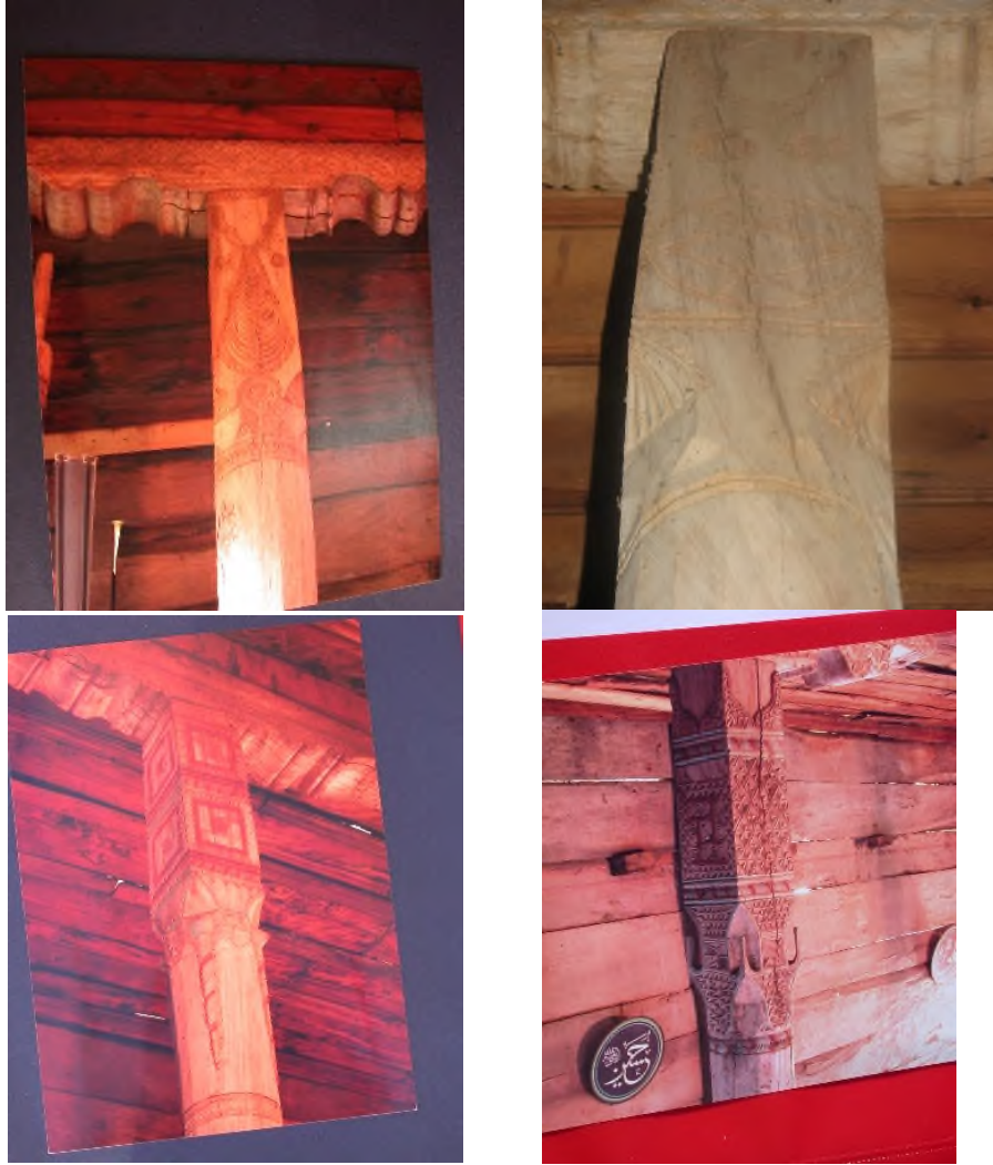
Resim 5: Her Biri Sanat Eseri Olan Ahşap Sütunlar

1 No'lu sütun: Mihrabın sağındaki birinci sütunun kaide kısmı pahlanmış olup, gövdesi köşeli, başlık kısmı ise silindirik formludur. Rozet, Selvi Ağacı motifleri oyma tekniğinde işlenmiştir. Yivli yastığın harime bakan yüzeyi ise yıldız şeklinde rozetlerle süslüdür. Sütun başlığı zikzak, yıldız rozet, sekizgen gibi geometrik bezeme ve stilize edilmiş bitkisel tezyinata sahiptir.