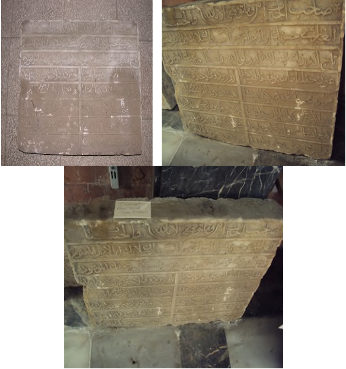
Resim 10: Müzede Bulunan Kitabe (Vakıfla İlgili Olup, Bir Kopyası Yapılarak Türbe Kapısına Yerleştirilmiştir)