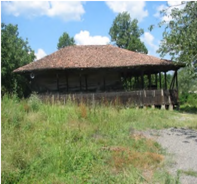
Resim 3: Camii ve Kapı-Pencere Madeni Süslemeleri

Ordu Köyü/Mahallesinde, Kılcanlı Sokak, 112 ada, 25-26-33-34 parsellerde yer almaktadır. Samsun Kültür ve Tabiat Varlıklarını Koruma Kurulu'nun 06.06.2001 tarih ve 195 sayılı kararı ile tescil edilmiş olup, restorasyonuna yönelik 09.03.2002 tarih ve 379 sayılı ek karar alınmıştır. Orijinal yeri bugünkü konumunun yüz elli metre kadar kuzeyindedir. Su baskını nedeniyle birkaç defa yer değiştirdiği bilinmektedir. Ordu Köyü Camii çadırvari görüntüsü ile dıştan Göğceli, Karacalı, Şeyh Hâbil ve Engiz Camiileri ile benzeşmekte olup, iç mekan düzenlemesinde de aynı mimari anlayışın ürünü olduklarını gösteren bir plan sergilemektedir. Halen bölge halkı tarafından Cuma Camii olarak kullanılan yapı bir hayli bakımsız kalmış, ancak zaman zaman yapılan korumaya yönelik müdahalelerle ayakta kalabilmiş, son yıllarda da Samsun Vakıflar Bölge Müdürlüğüne kapsamlı bir restorasyon çalışması planlanmıştır. Cami, Kale ve Türbe'deki tahribatlar ve Yasa dışı kazıların önüne geçebilmek adına gerek Köy/Mahalle ve Bölgenin Tarihi gerekse Türbe, Kale ve Camii ile ilgili olarak yöre halkını bilgilendirme çalışmaları 1999-2005 yılları arasında hız kazanmış, defalarca yapılan sunumlarla halkın bilgilendirilmesi-bilinçlendirilmesi hedeflenmiş ve büyük oranda başarı sağlanmıştır.