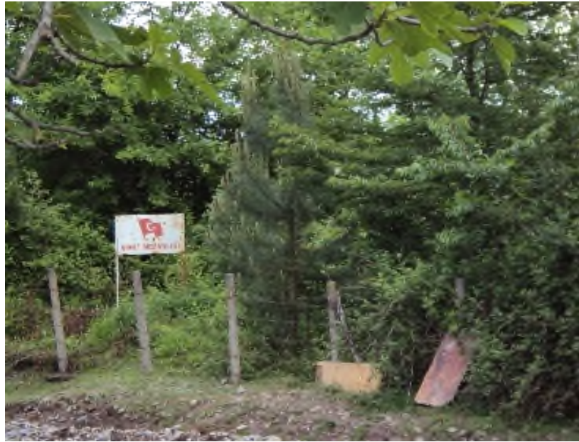
Resim 7: Caminin Yakın Mesafesinde Etrafı Tel Örgü İle Korumaya Alınmış Bir Şehitlik Bulunmaktadır.