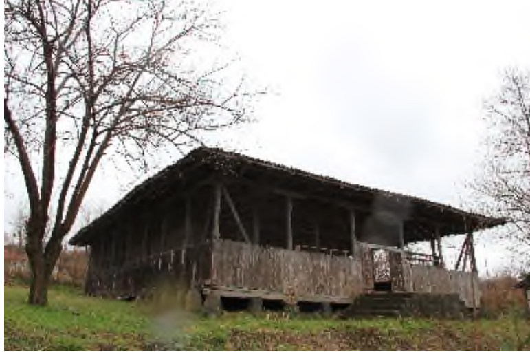
Resim 6: Ordu Camii'nin 1997-2013 Yılları Arasında Çekilmiş Fotoğrafları