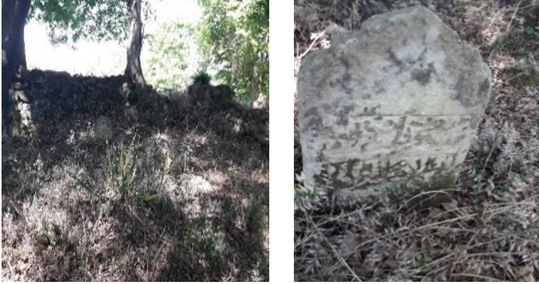
Resim 9: Türbenin Eski ve Yeni Hali ile Hazire'nin Genel Görünümü/ Mezar Taşı