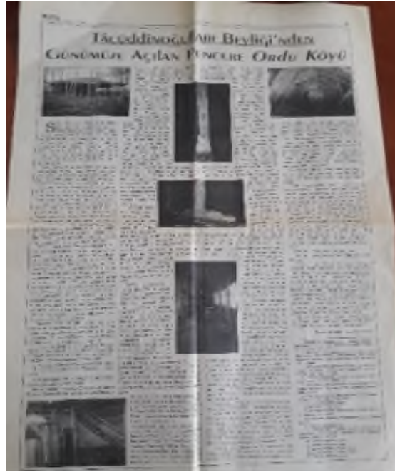
Resim 1: Tarafımdan Hazırlanmış Olan ‘‘Tacüddinoğulları Beyliği’nden Günümüze Açılan Pencere Ordu Köyü’’ Adlı Makale -Samsun Barış Gazetesi. Not: Makale Samsun Barış Gazetesi, 22 Mayıs 2001 (Yıl 12-sayı 395) tarihinde Yayımlanmıştır.

14.yy.da, bugünkü Samsun İli sınırları dahilinde hüküm süren mahalli Beyliklerden birisi olan Tacüddinoğulları Beyliği Çarşamba İlçe Merkezi yanı sıra Ordu Köyünü (Ordu Başı) yaşam alanı olarak kullanmıştır. Beyliğin ve Rufai Şeyhleri olan Beylerinin Selçuklu (son dönem) ve Osmanlı (erken dönem) tarihindeki yeri önemlidir. Gerek Çarşamba gerekse Ordu Köyü/Mahallesinde eserleri olan Beyliğin bölge tarihi ile bütünleşerek tanıtımının yapılması sağlanmalıdır. Bu kapsamda ilk çalışmalar 2001 yılında tespit-tescil, basın yoluyla tanıtım (Resim:1) ve bölge halkının bilgilendirilmesi (Resim:2) şeklinde gerçekleştirilmiştir.