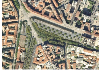
Fotoğraf 1. Zamansal ve mekânsal bir sürekliliğin üretimi - Feltrinelli Porta Volta, Herzog & de Meuron, Milano, Porta Volta, 2008-2016

Carlo Cattaneo'dan hareketle, gösterdiği şey "büyüklük geleneği"dir. Projenin fikri iki temel unsur üzerine gelişmiştir: İlk olarak Milano mimarisinin tekrara dayanan cömert ölçeği "büyüklük"; ikinci olarak ise uzun bir boşluk olan alanın geometrisi ve İkinci Dünya Savaşı sırasında uğradığı hasarların hatırlatıcısı olarak boşluk/duvar fikri. İlk bileşen temelinde yapı Aldo Rossi'nin Gallarate'deki konut binasından ilham almaktadır (Herzog & De Meuron, 2016) (Fotoğraf 3). Ortam koşullarına öznenin özel yönelimi, kendi ifadeleri ile alanın geometrisine "tabiatın gizli geometrisi" böylece dahil edilmiştir. Uzunluk ve dar yapı sonsuz strüktür tekrarı ile birleşince "tabiatın gizli geometrisi"nin "çarpıcı" formu ve etkisi ortaya çıkmıştır: Ortam koşullarıyla deneysel bir etkileşimin ürettiği sürekliliğin ama aynı zamanda başkılığın yarattığı gerilim.