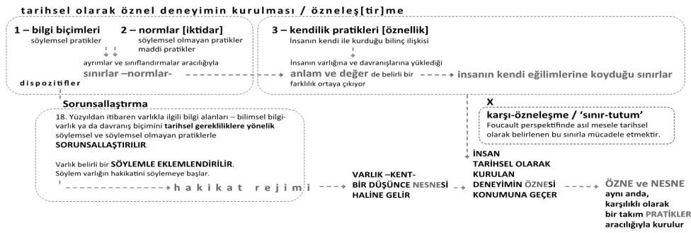
Şekil 1: Tarihsel olarak öznel deneyimin kurulma süreci.

Bu noktada önemli olan üçüncü eksen olarak tarif edilen "kendilik pratikleri" eksenini, yani bu hakikati kabullenme sürecidir: İnsan, varlığına ve davranışlarına yüklediği anlamda ve değerinde belirli bir farklılık olduğu zaman deneyimin öznesi konumuna geçer (Foucault, 1988, 9, 31-40). Dolayısıyla sorunsallaştırma sürecinde varlık ya da davranış biçimi düşünce nesnesi haline gelirken, fikir ve pratikler de yönlendirilmiş olur ki bir özne olma biçimi üretilir. 5