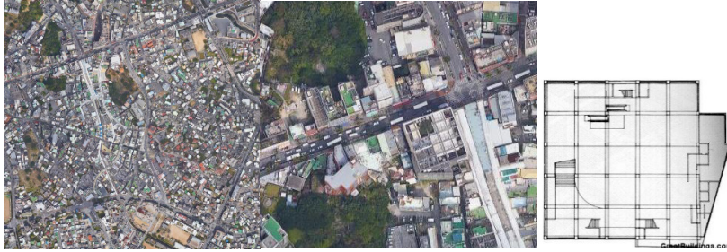
Fotoğraf 4. Kentsel ortam ve bir mikrokosmos - Festival, Naha, Okinawa, 1984 Kentsel ortam ve yakın çevre (sol ve orta) ( http://virtualglobetrotting.com/map/festival-by-tadao-ando/view/google/- ) - Zemin kat planı (sol) ( http://www.greatbuildings.com , adreslerinden 29.12.2017 tarihinde 09:00'da alınmıştır ).

Bu anlamda Ando "kent gerillası" hedefini, kentsel projelerinde insanların bir araya gelebileceği "yohaku" veya "boşluklar" yaratarak gerçekleştirmiştir. Bu yaklaşım, Ando'nun küçük ölçekli kamusal binalarından 2000 yılı sonrasına uzanan Omotesando Hills, Tokyu gibi kentsel yapılarında izlenebilmektedir. Bu Frampton'a (1995) göre Ando'nun "duvarları yenmek için duvarları kullanma" stratejisiydi. Bundan sonra bu yaklaşımı Ando, 1984 tarihli "Festival" olarak bilinen yapı gibi erken çalışmalarında, etrafında dönen beton duvarlarla korunan avlu fikri ile kaotik Japon kentlerinde üretmiştir (Frampton, 1995) (Fotoğraf 4).