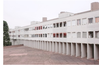
Fotoğraf 2. (solda) Biçimin kurucusu olarak Milano mimarisinin tekrara dayanan cömert ölçeği: "Büyüklük" - Porta Volta, 2008-2016, Milano, - Fotoğraf 3. (sağda) Porta Volta'nın referanslarından biri – Gallarate konut bloğu, 1946-1967, Rossi & Carlo Aymonino.

Porta Volta'nın bir tasarım pratiği aracılığıyla yeniden tanımlanması aynı zamanda Milano'nun ünlü olduğu bir dizi sembolik binaya yol açan tarih boyunca Milano şehirciliği olarak bilinen şeyi sürdürür. Böylece Herzog & de Meuron (2005) mimarlığı görünmeyen imgesi ile ilişkilendirirler. Bu imge hem mevcut koşulları hem de geleneği içerir. "Gelenek" bünyeye dahil olan analogik