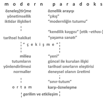
Şekil 2: Modern paradoks: Tarihsel olarak deneyimin sınırların belirlenmesi ve başka tutumların olabilirliğinin imkânı.

Bu düşünce içinde tasarım pratiği “oluşum” 15 ( Entstehung ) olarak tanımlanabilir. Bu bağlamda tasarım ortamın farklı kuvvetlerinin “olay”ın tekil rastlantısında belirmesidir ki kentsel ortam ve öznenin özel yönelim isteği arasındaki gerilim ve etkileşimle ortaya çıkar. Belli bir toplumda iktidar gevşeyen, dönüşebilen, gelişebilen hareketli ilişkileridir. Dolayısıyla farklı tutumların, “oluşum”un imkânı söz konusudur. Kent de bu düşüncenin dışında kalmaz. Bu bağlamda kentsel ortam özel “kendilik pratiklerini”, farklı eğilimleri ve tasarım pratiklerini potansiyel olarak barındıran bir şey olarak ortaya çıkar.