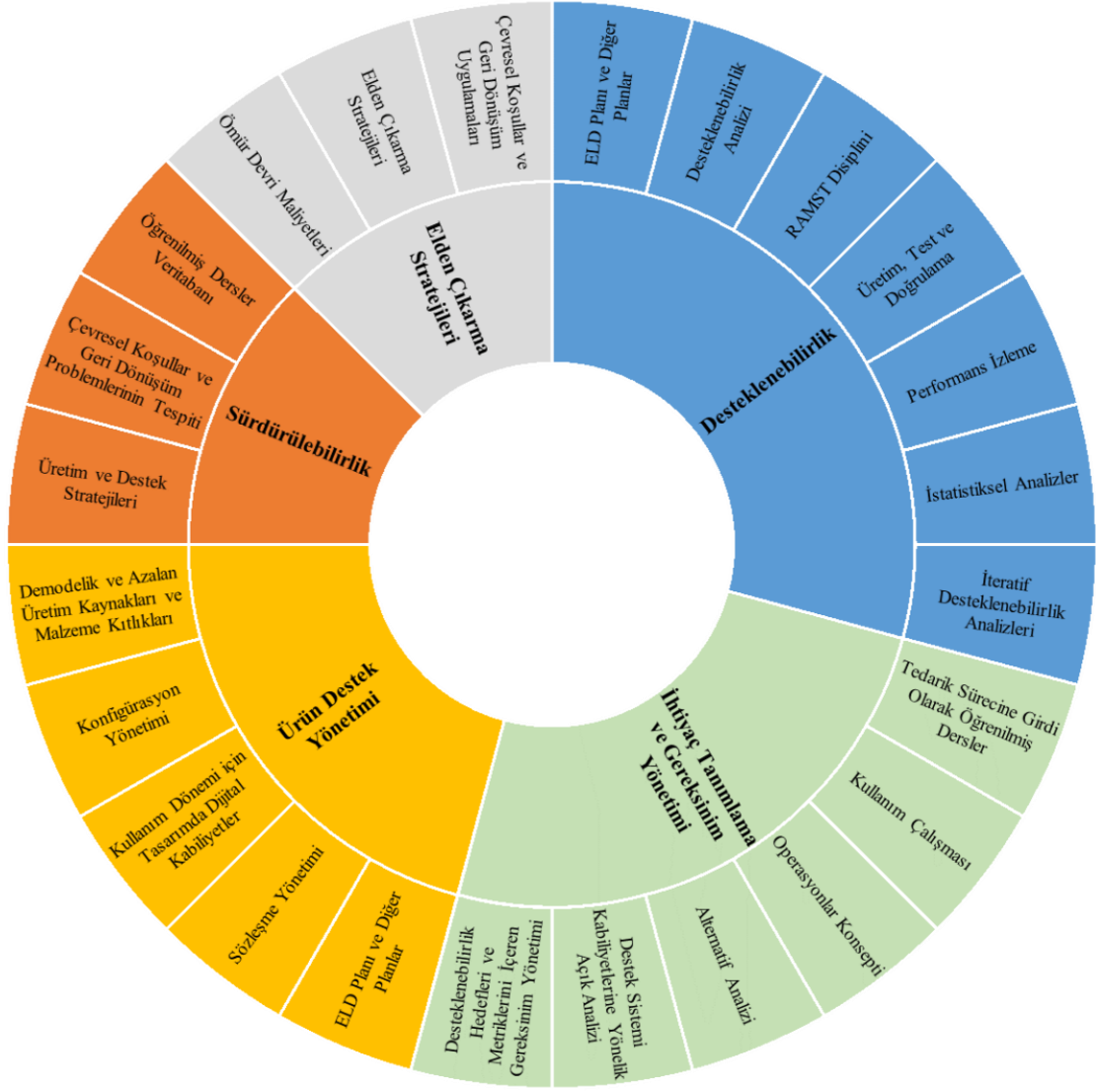
Şekil 3: Sistem ömür devri yönetiminde 5 anahtar aşama.