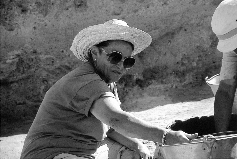
F.3- Şarhöyük kazısında, 2001 (Çaykara, 2002, s.348)