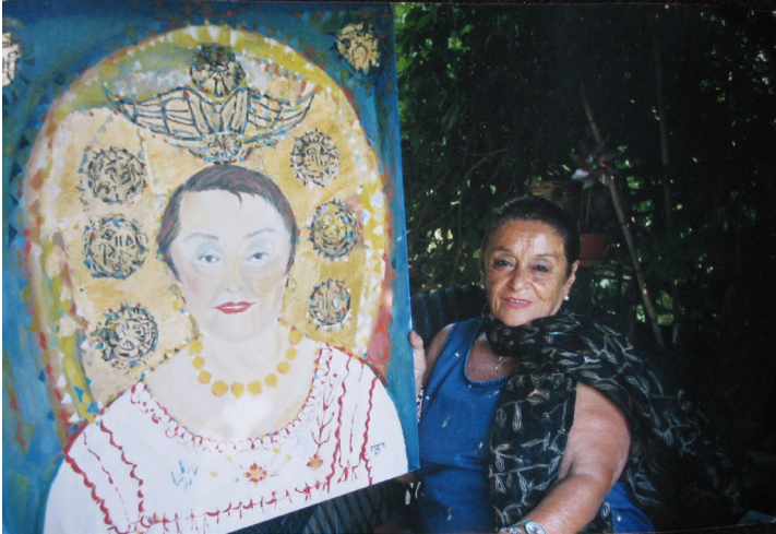
F.8- Berna Türemen'in yaptığı Puduhepa portresiyle