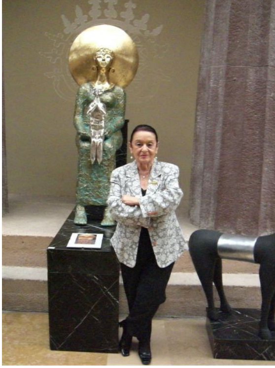
F.7- İstanbul Arkeoloji Müzesi'ndeki Erdiñç Bakla'nın Tanrıçalar sergisinde, (Engin Uludağ Objektifi)