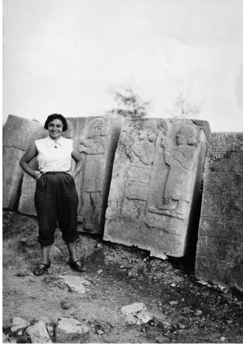
F.2- Karatepe kabartmaları nnde (aykara, 2002, s.173)