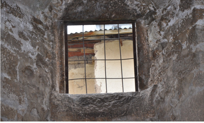
F. 22- Surp Sarkis Kilisesi kuzey yan nefte pencere açıklığı ve duvar dokusu