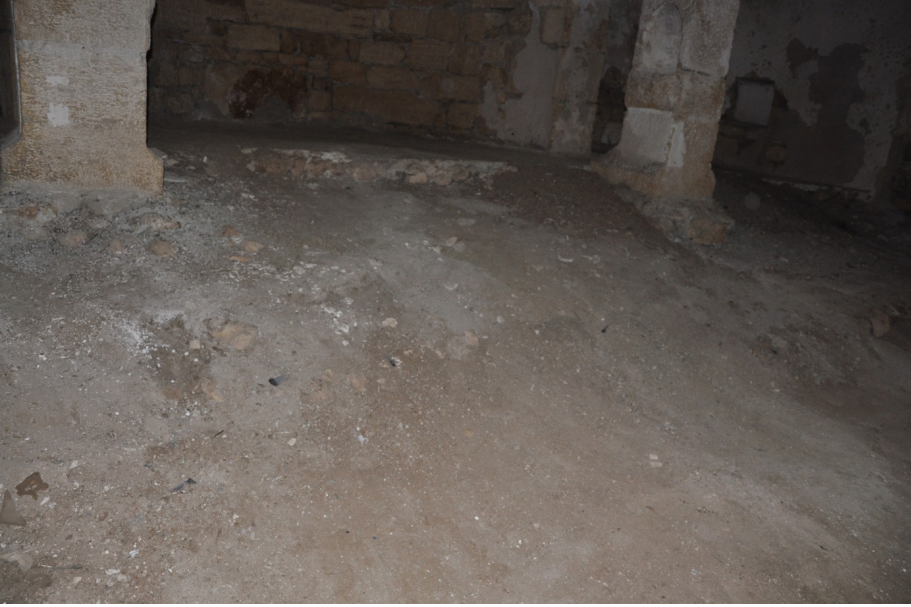
F. 32- Surp Sarkis Kilisesi ana neften apsis önündeki platform kalıntıları