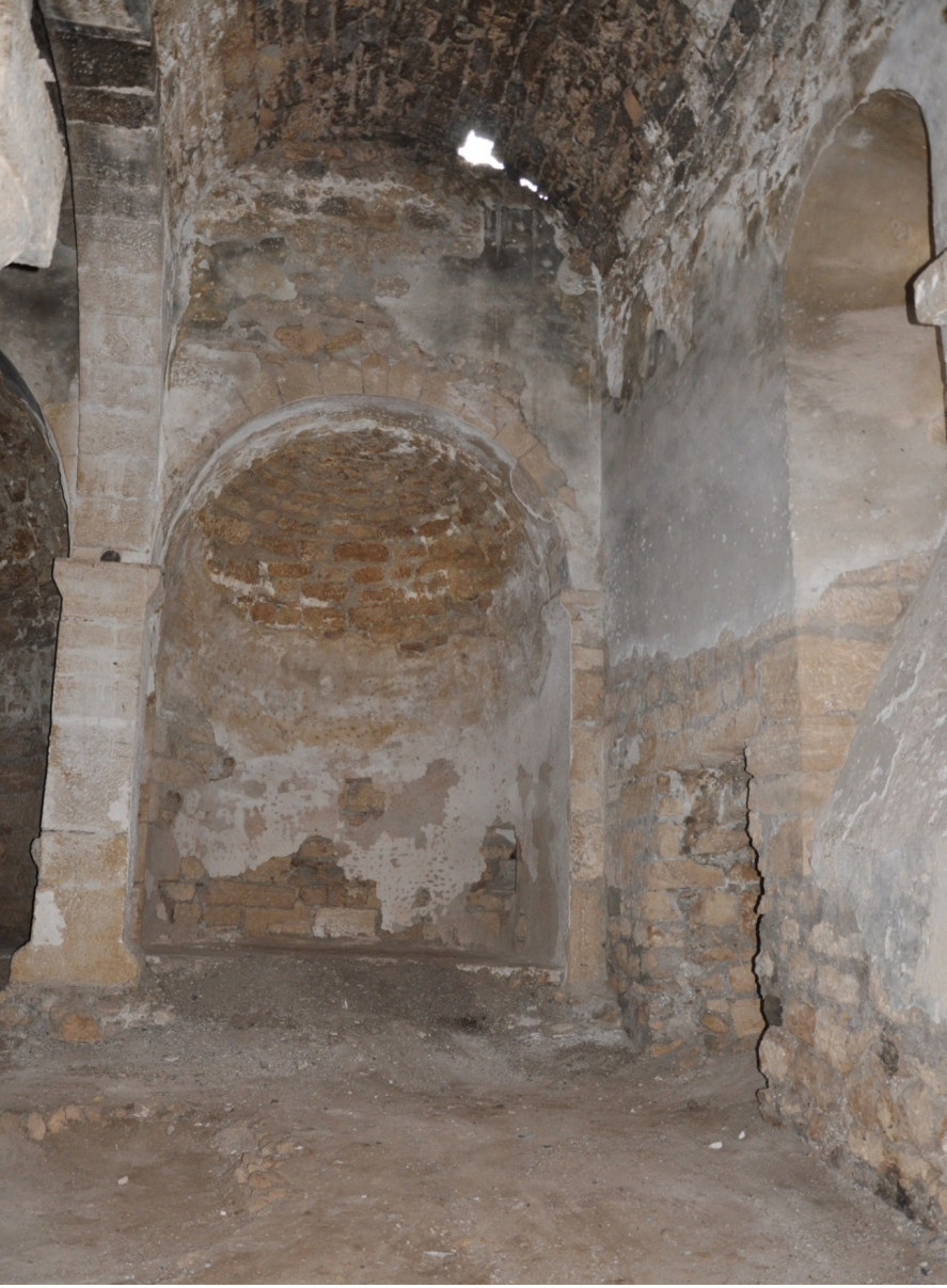
F. 25- Surp Sarkis Kilisesi güneydoğu yan apsis, platform kalıntıları, güney yan şapeli girişi