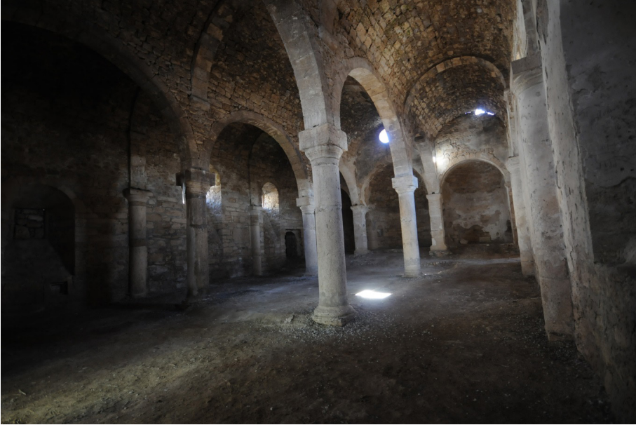
F. 6- Surp Sarkis Ermeni Kilisesi güney yan neften iç mekan taşıyıcı sütunlar, gergi delikleri