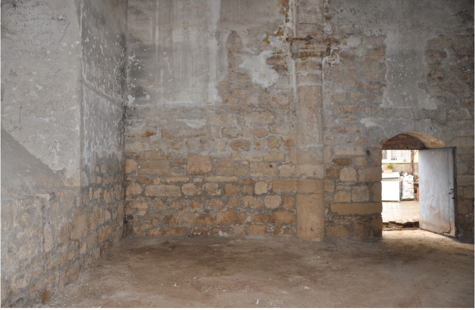
F. 17- Surp Sarkis Kilisesi güneybatıdan, ana giriş, yükselen zemin kotu