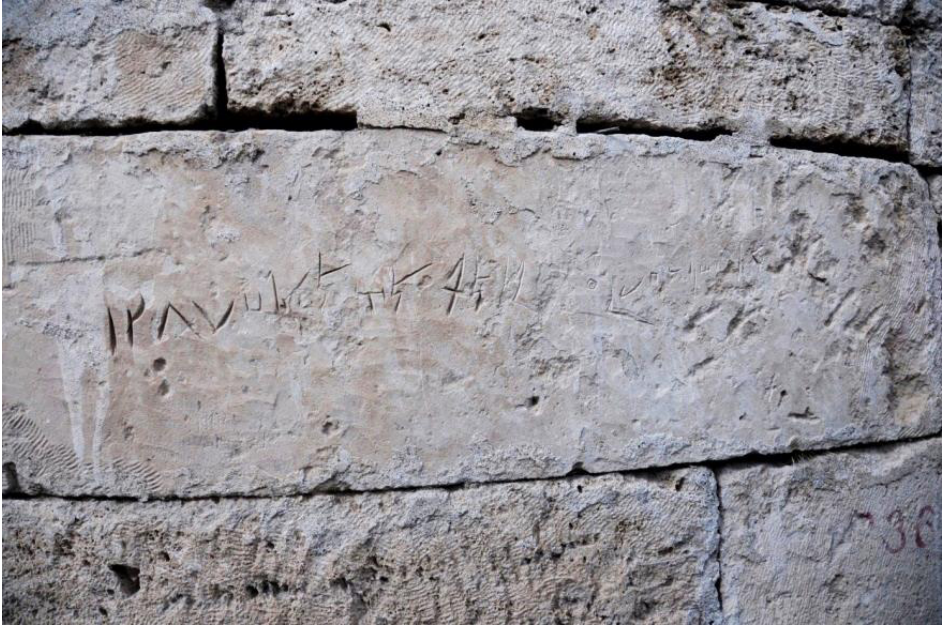
F. 42- Surp Sarkis Kilisesi apsis cephesindeki kayıtlar