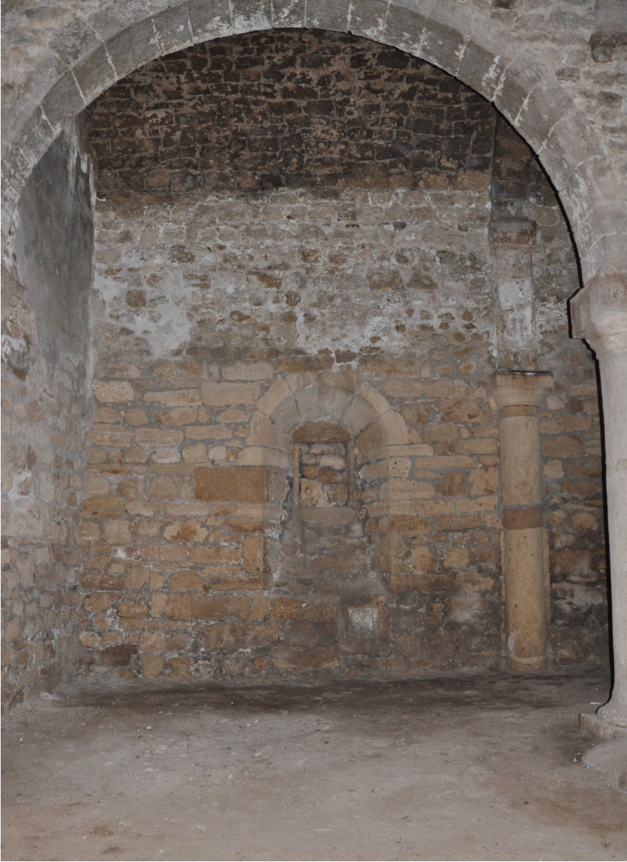
F. 21- Surp Sarkis Kilisesi kuzey yan nefte kapatılmış pencere