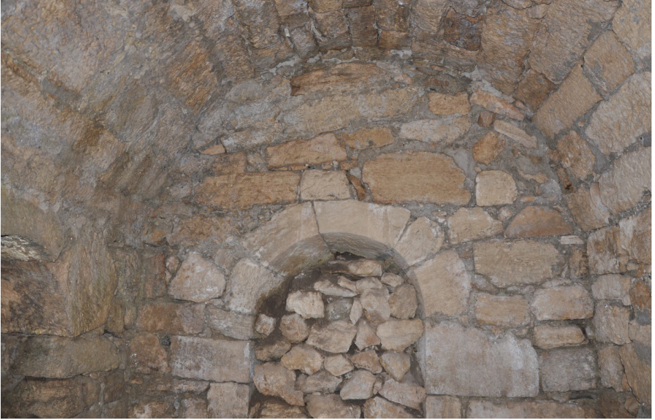
F. 9- Surp Sarkis Kilisesi kuzey yan şapeli