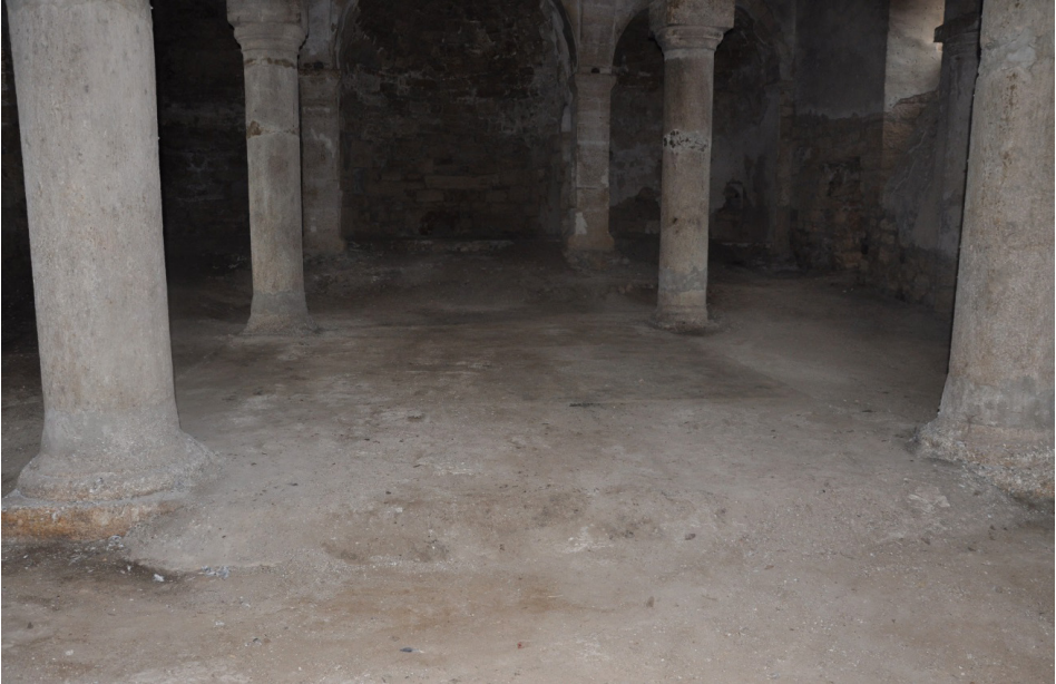
F. 18- Surp Sarkis Kilisesi iç mekan yükselen zemin kotu