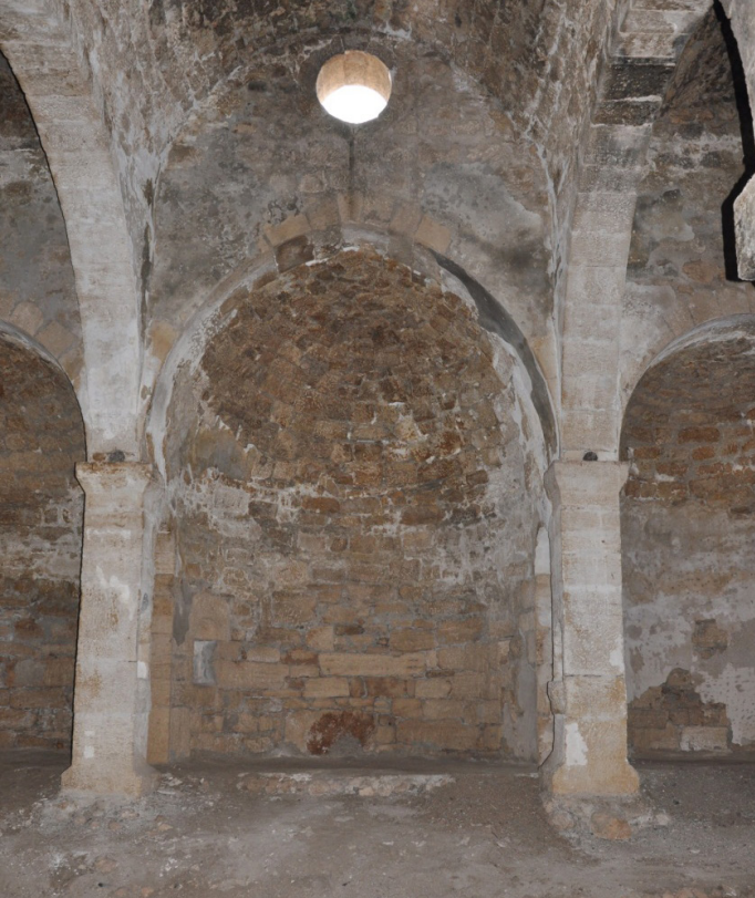
F. 23- Surp Sarkis Kilisesi, ana apsis ve yan apsisler, yıkık platform, kare kesitli iki sütun