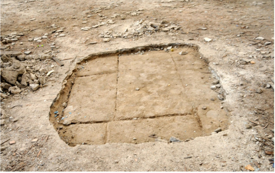
F. 19- Kayseri Surp Asdvadzadzin Kilisesi özgün taban döşemesi (Z. Mildanoğlu Arşivi)