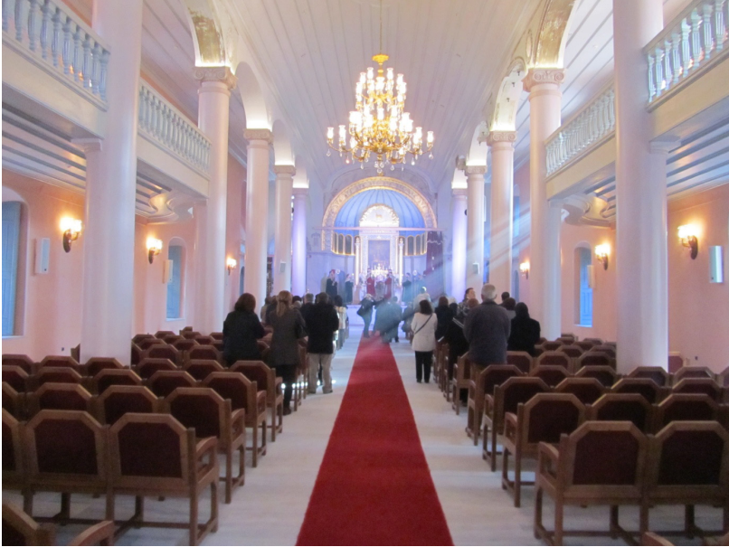
F. 35- Kumkapı Surp Vortvots Vorodman Kilisesi Patrik Mesrob Mutafyan Kültür Merkezi