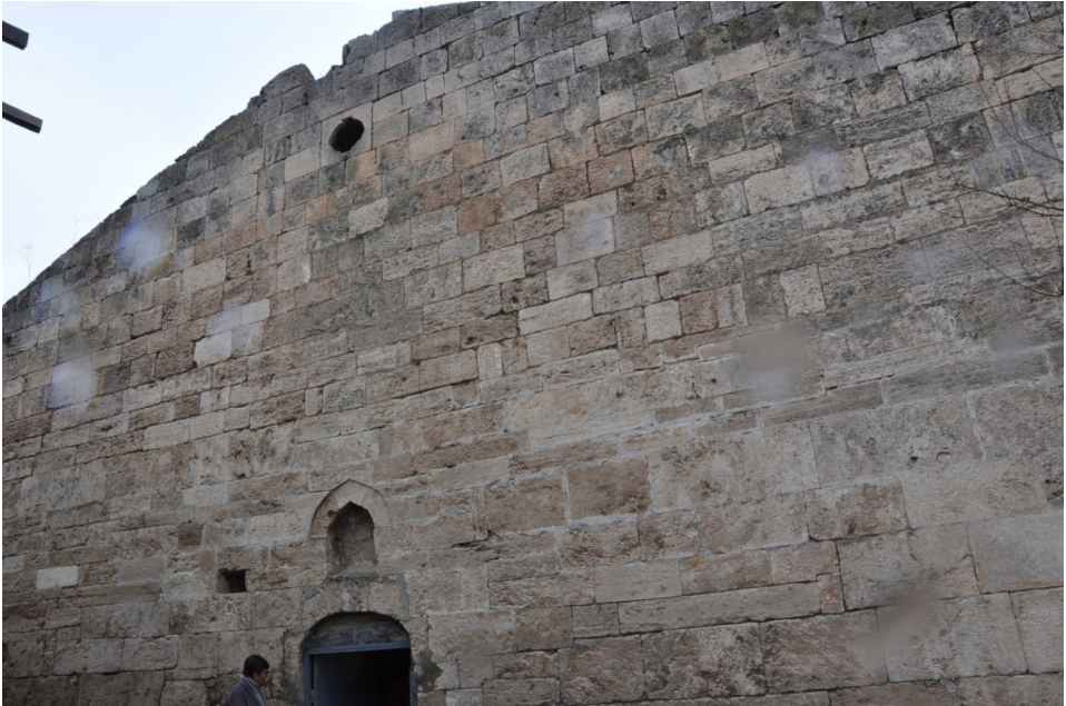
F. 15- Surp Sarkis Kilisesi batı cephesi - detay