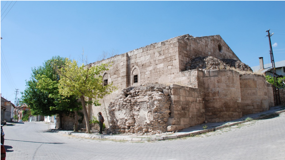
F. 30- Surp Sarkis Kilisesi güneydoğudan görünüş, güney yan şapel