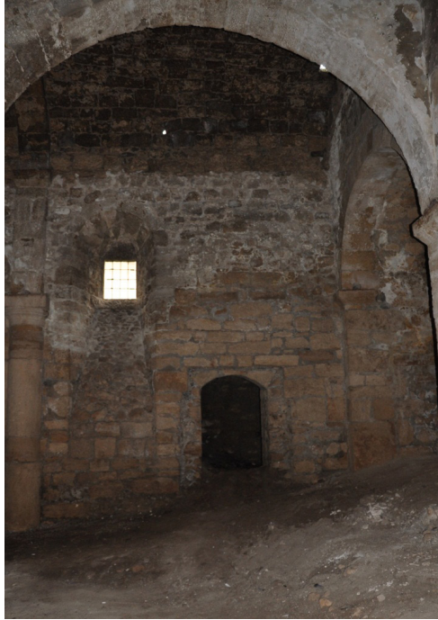
F. 27- Surp Sarkis Kilisesi güneyden kuzey yan şapel girişine doğru koro bölümü