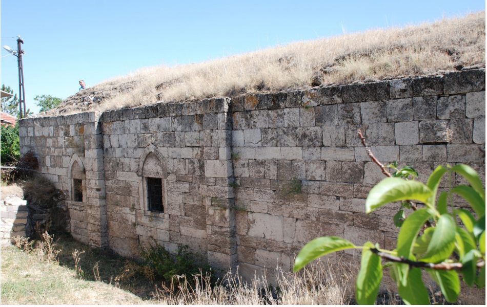
F. 14- Surp Sarkis Kilisesi kuzey cephesi ve üst örtüsü