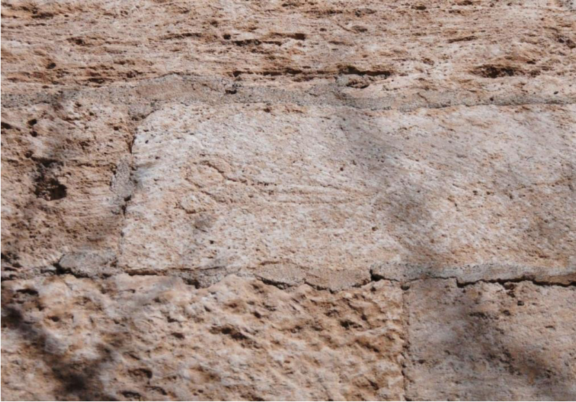
F. 40- Surp Sarkis Ermeni Kilisesi güney cephede bezeme