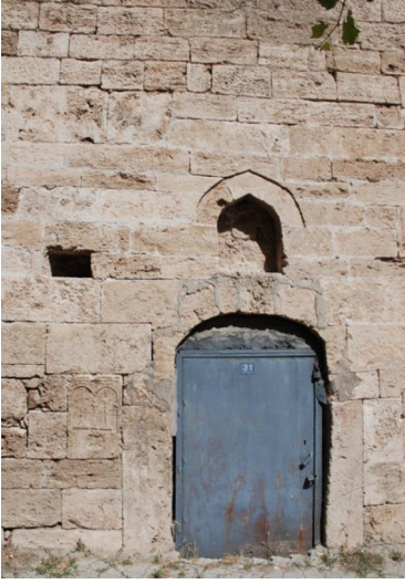
F. 36- Surp Sarkis Kilisesi batı girişi, kabartma bezeme, kapı üzerinde niş