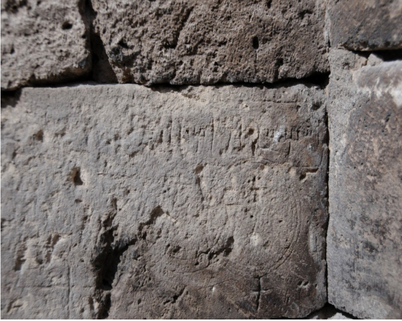
F. 39- Surp Sarkis Kilisesi girişı sađında kazıma bezemeler, üstünde okunamayan bir kayıt