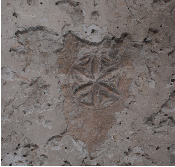
F.34- Surp Sarkis Kilisesi iç mekan güney duvarı orta pencere altı sıva üstü rozet bezeme