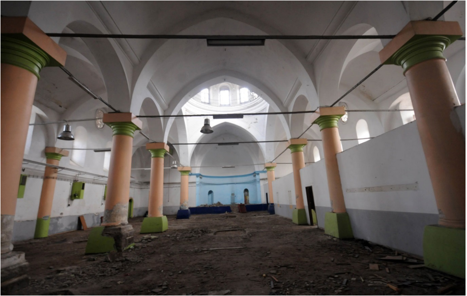
F. 16- Kayseri Surp Asdvadzadzin Ermeni Kilisesi, gergiler