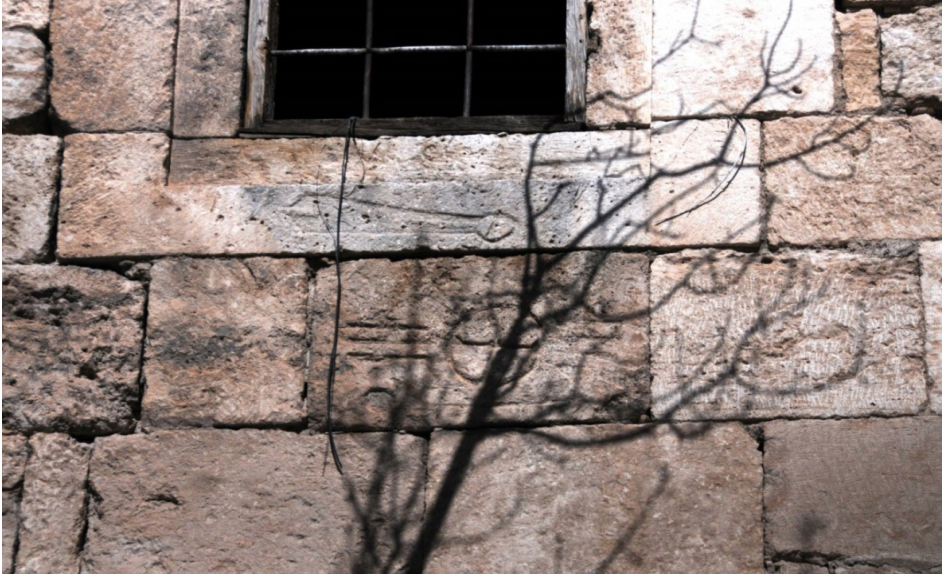
F. 41- Surp Sarkis Kilisesi güney cephede bezeme