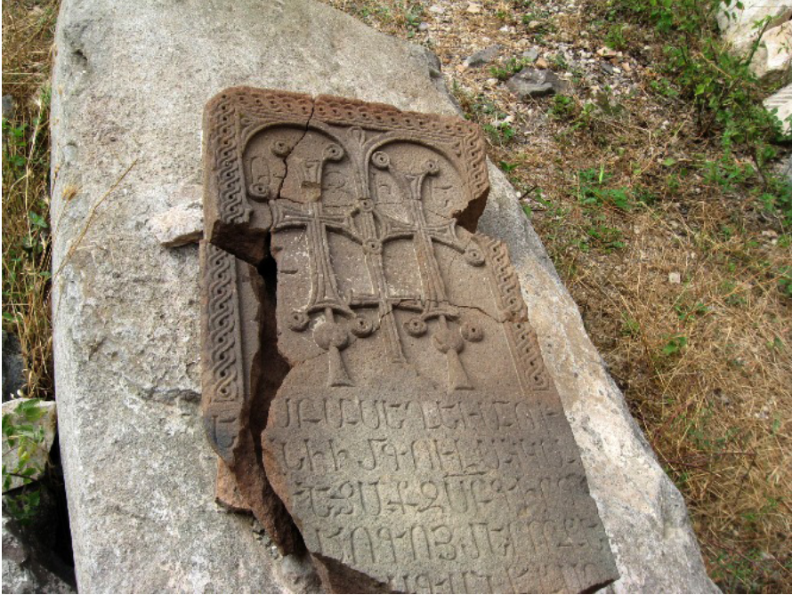
F. 38- Khaçkar örneği