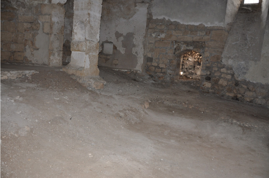
F.33- Surp Sarkis Kilisesi kuzey yan neften güneye, koro bölümünde platform kalıntıları