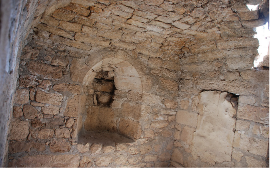
F. 10- Surp Sarkis Kilisesi güney yan şapeli