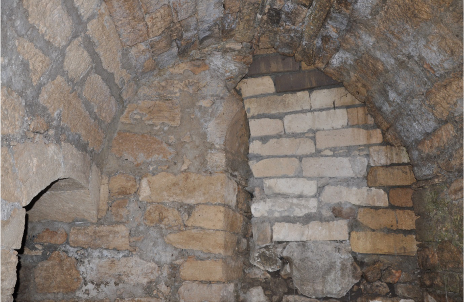
F. 8- Surp Sarkis Kilisesi kuzey yan şapeli