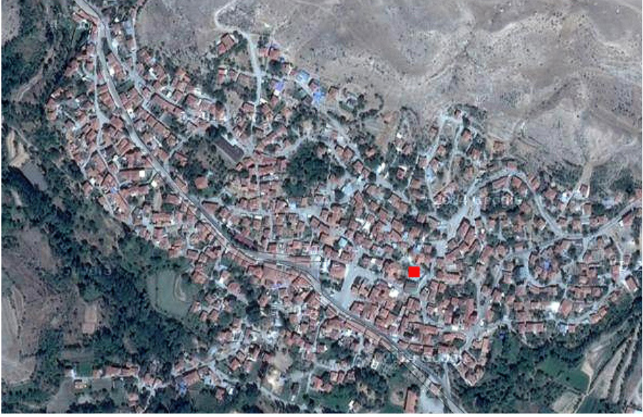
F. 1- Çepni Beldesi ve Sarp Sarkis Kilisesi'nin konumu