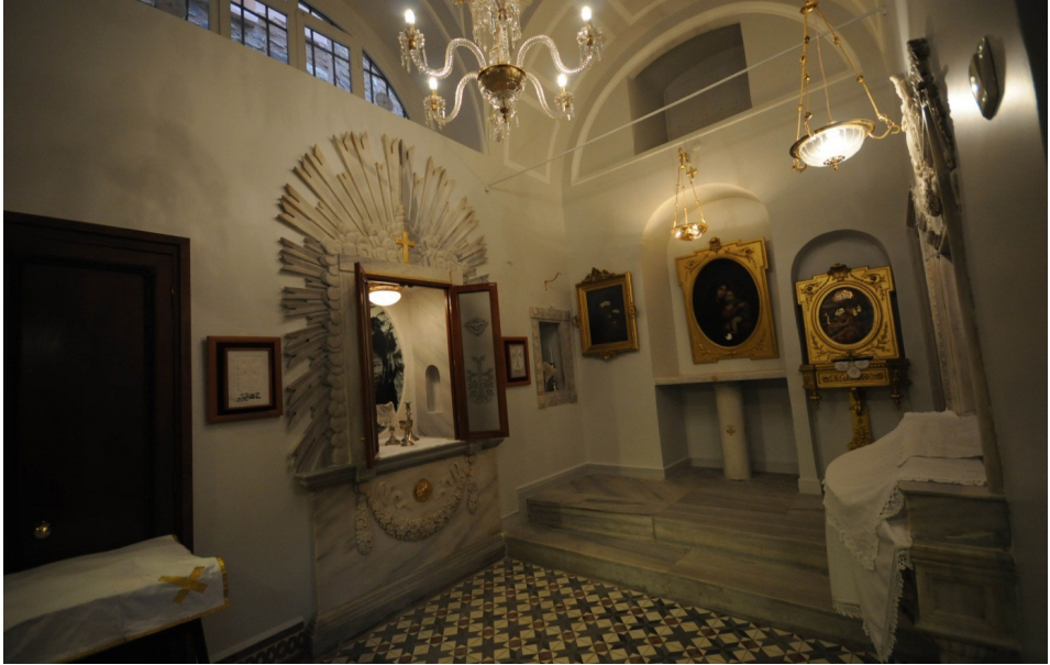
F. 28a- Beşiktaş Surp Asdvadzadzin Ermeni Kilisesi Vaftizhane Şapeli