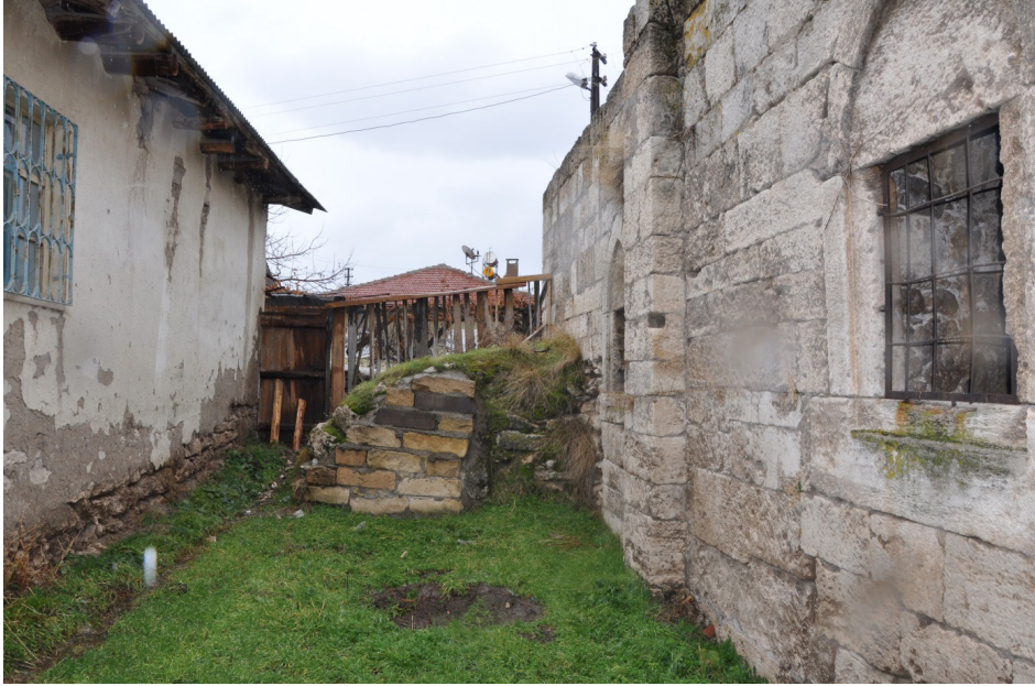
F. 29- Surp Sarkis Kilisesi kuzeybatıdan görünüş kuzey cepheden yan şapel