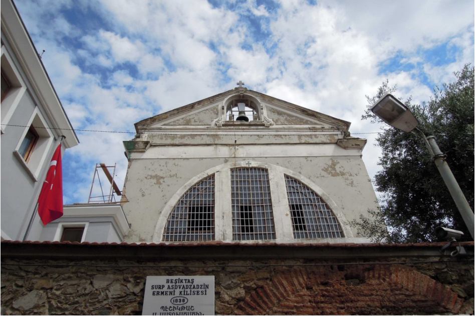
F. 15a- Beşiktaş Surp Asdvadzadzin Ermeni Kilisesi