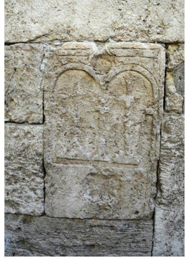
F. 37- Girişin yanındaki bezeme