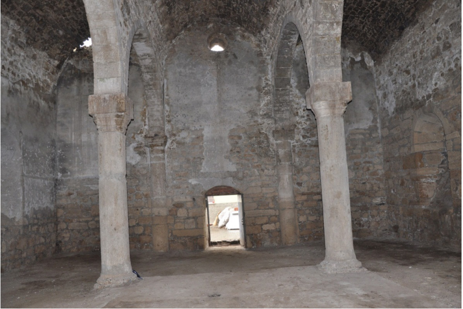
F. 4- Surp Sarkis Kilisesi ana neften batı ana girişi