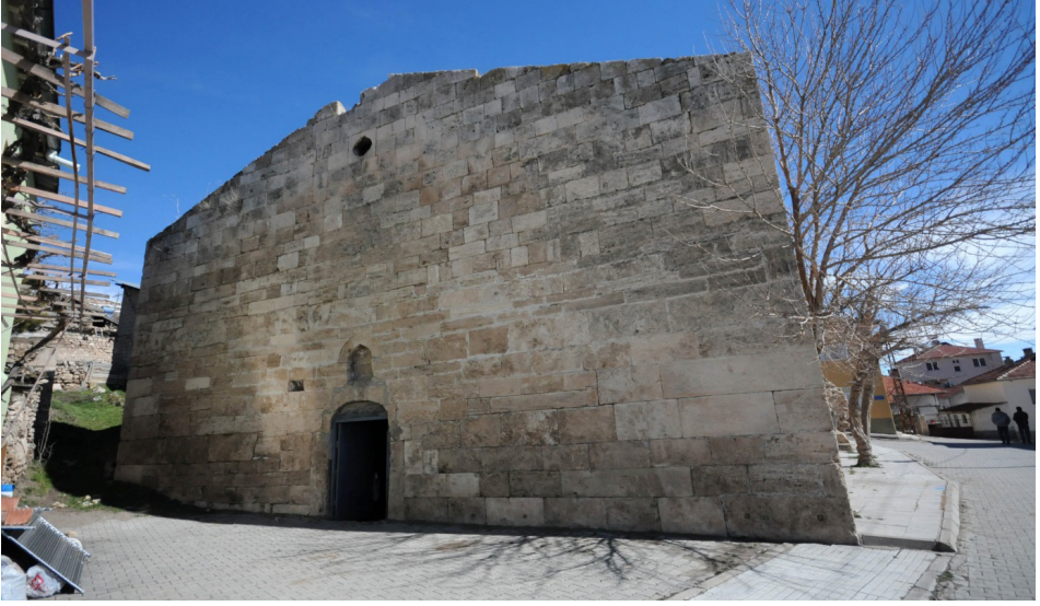
F. 12- Surp Sarkis Kilisesi batı cephesi ve giriş