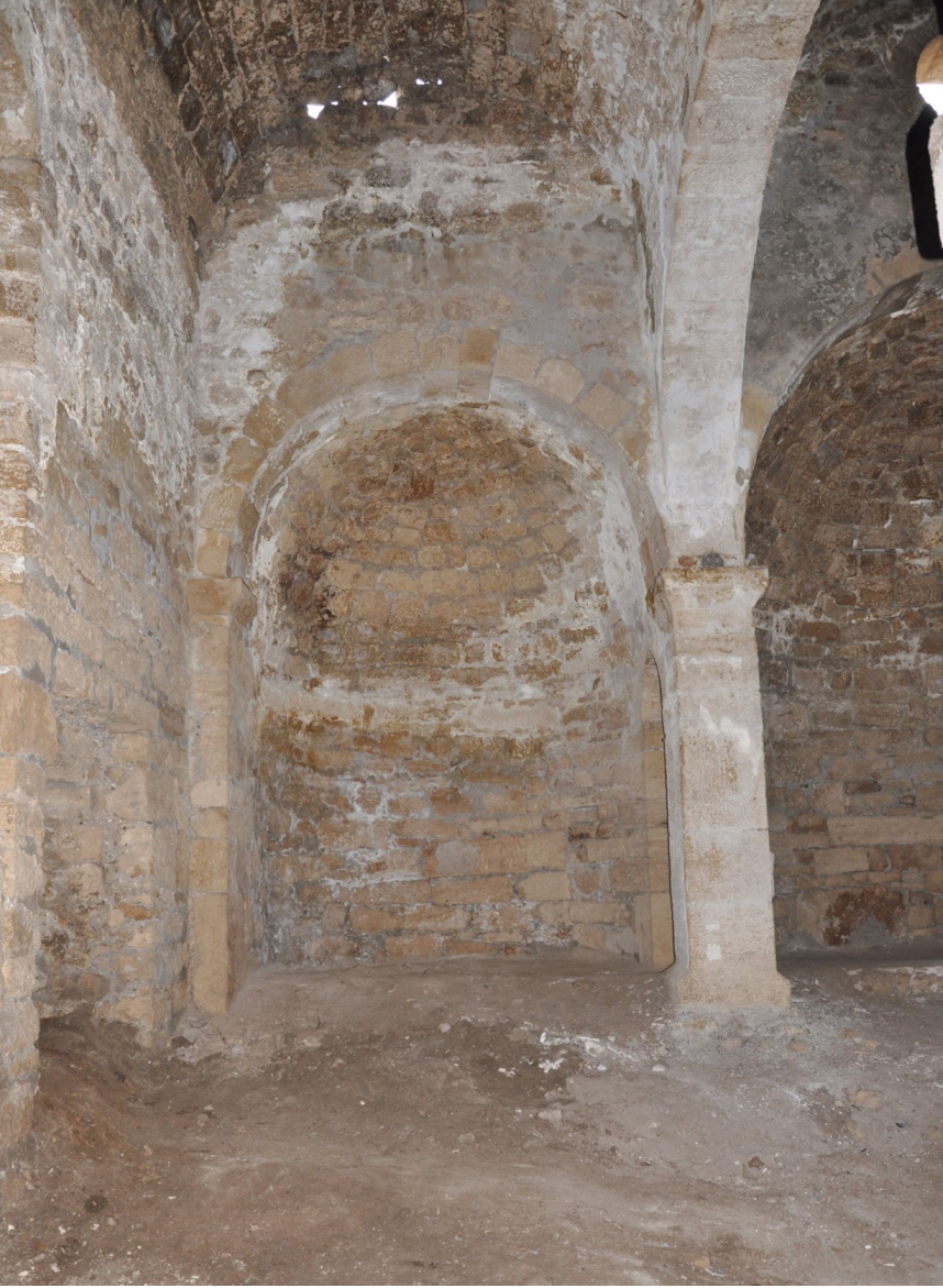
F. 24- Surp Sarkis Kilisesi kuzeydoğu yan apsis, platform kalıntıları, kuzey yan şapeli girişi