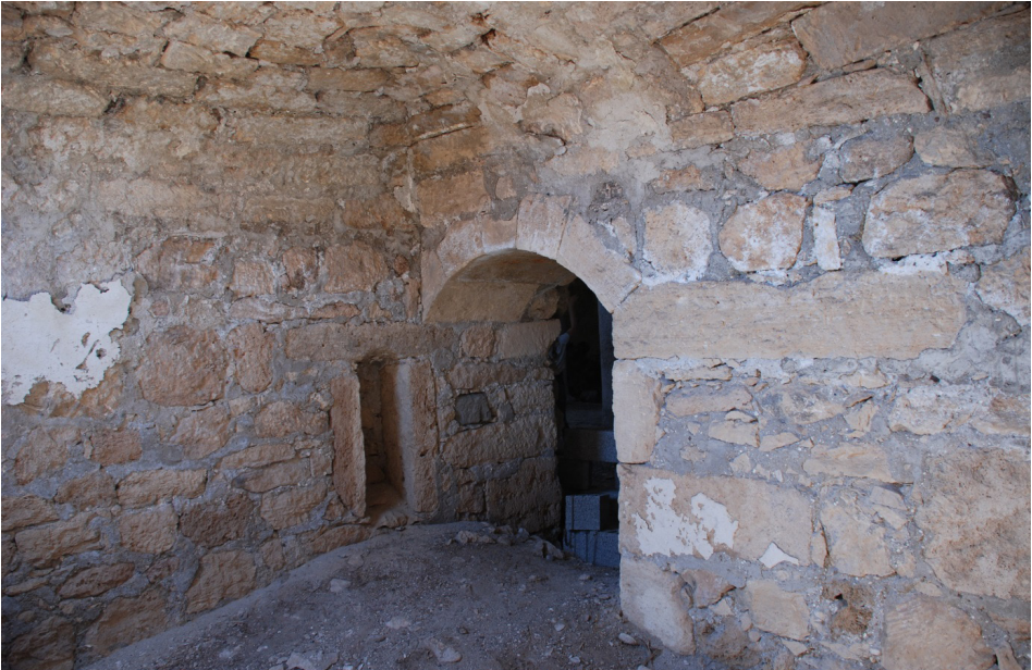
F. 11- Surp Sarkis Kilisesi güney yan şapeli koro bölümüne geçiş