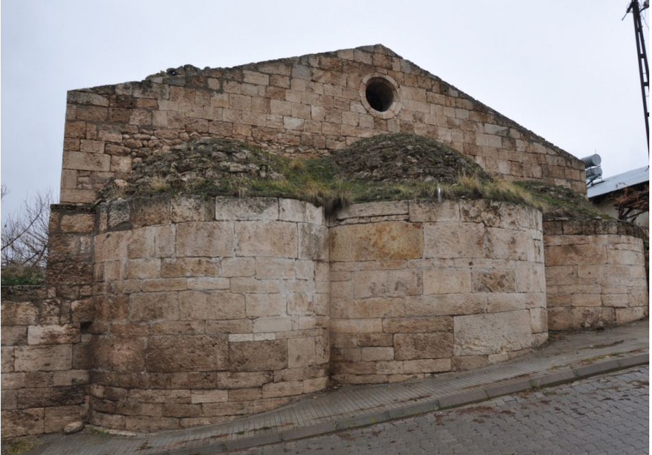
F. 13- Surp Sarkis Kilisesi dıştan doğu cephesi - apsis üst örtüsü