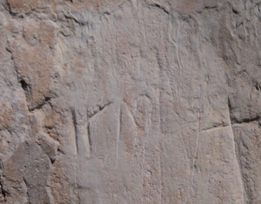
F. 44- Surp Sarkis Kilisesi apsis sindeki kayıtlardan detay