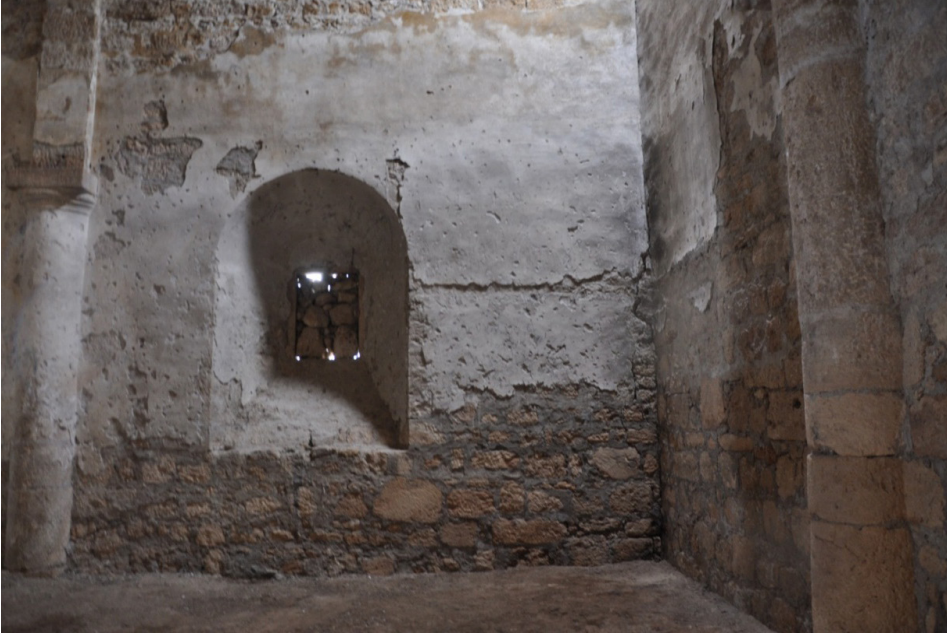
F. 20- Surp Sarkis Kilisesi güney duvarında kapatılmış pencere