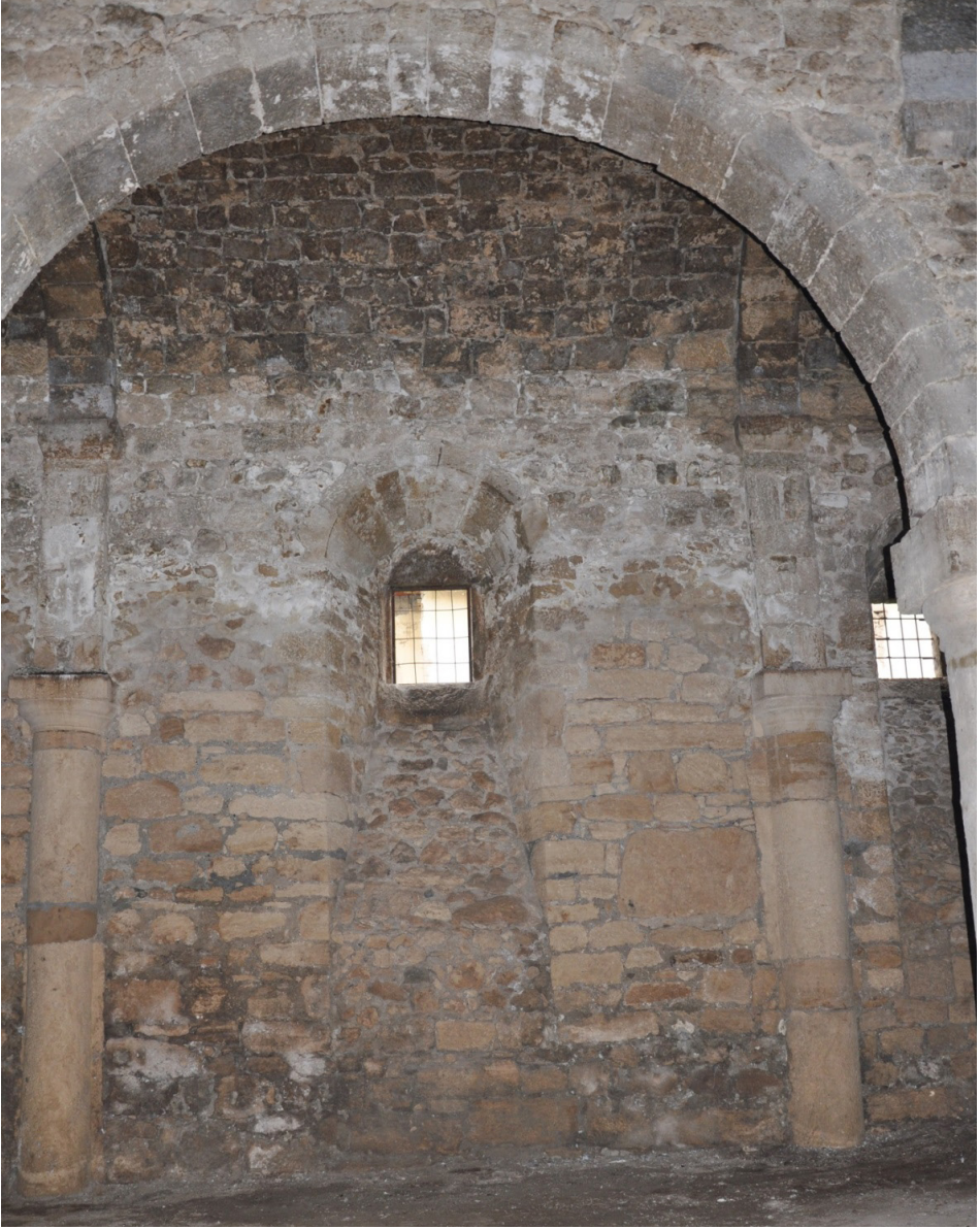
F. 5- Sarp Sarkis Kilisesi yan nef – detay, duvara gömülü sütunlar ve pencere açıklıkları Sütunlarda kayıp kenetlerden boşalan yerler