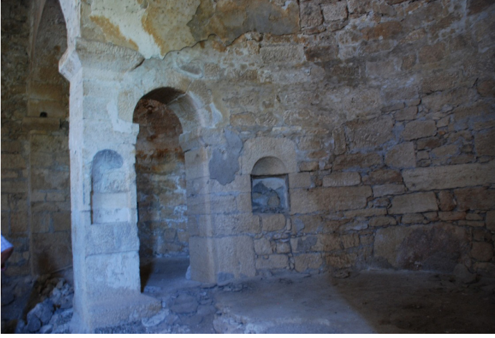
F. 26- Surp Sarkis Kilisesi ana apsis kuzey yan nişleri ve yan apside kemerli geçiş