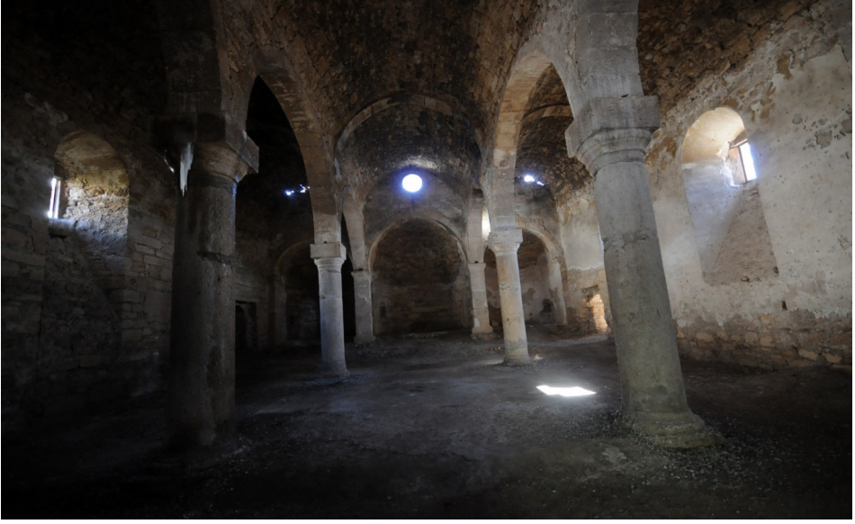
F. 3- Surp Sarkis Kilisesi batıdan doğuya iç mekan