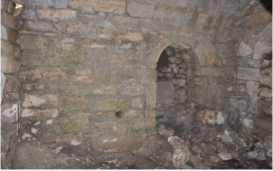
F. 28- Surp Sarkis Kilisesi kuzey yan şapelde vaftiz nişi ve su gideri