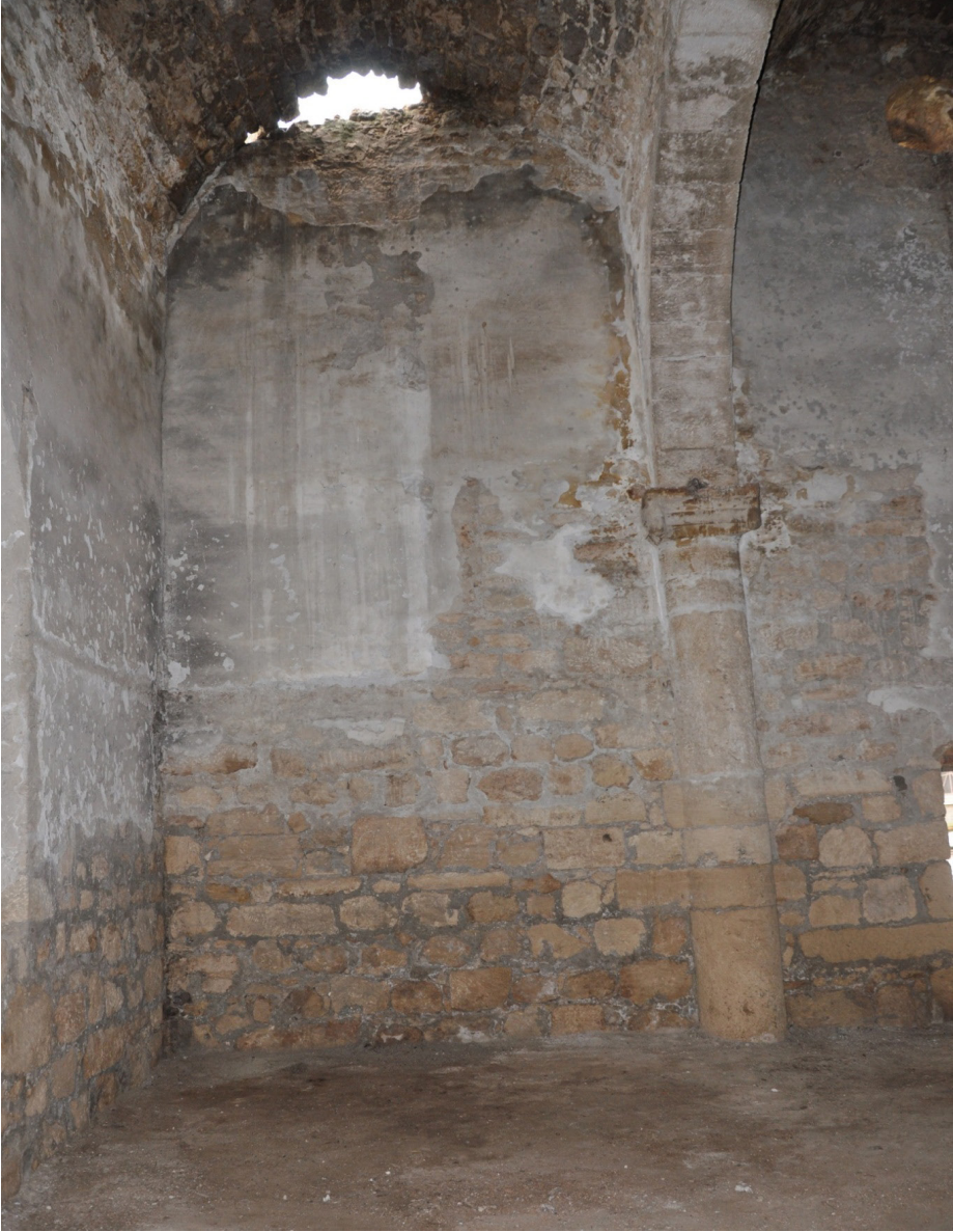
F. 31 - Surp Sarkis Kilisesi güneybatı tonozdaki açılmalar, zemin döşemeden detay