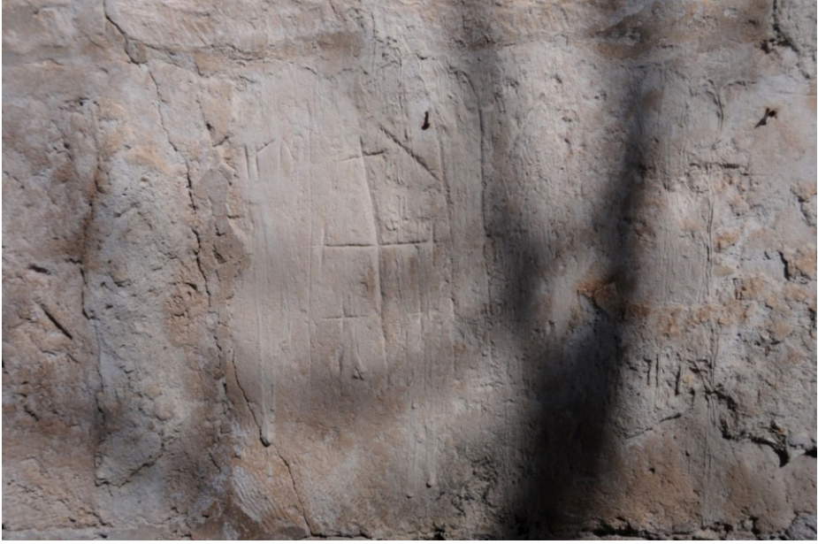
F. 43- Surp Sarkis Kilisesi apsis cephesindeki kayıtlar