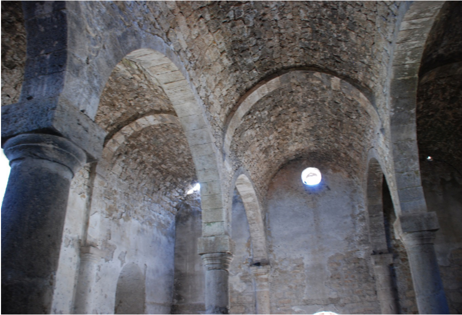
F. 7- Surp Sarkis Kilisesi ana neften batıya taşıyıcı kemerler ve tonozlar -detay