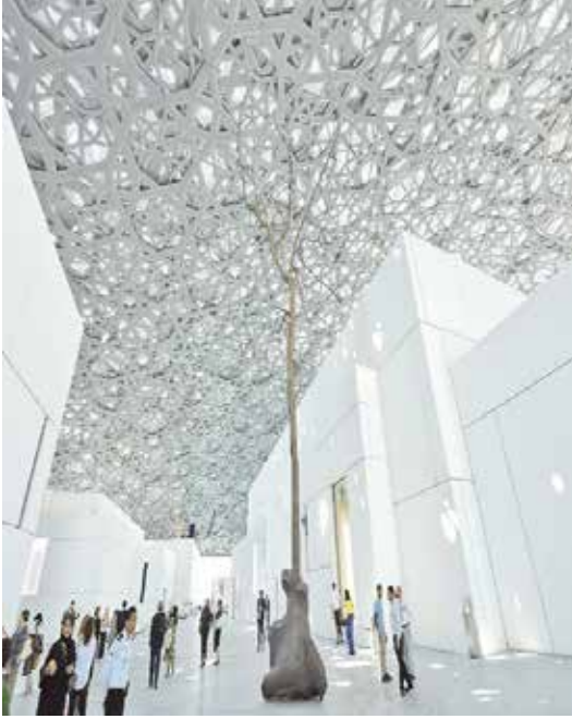
Fotoğraf 9 ve 10. Jenny Holzer, Sümer Yaratılış Miti ve Giuseppe Penone "Hayat Ağacı", 2018.