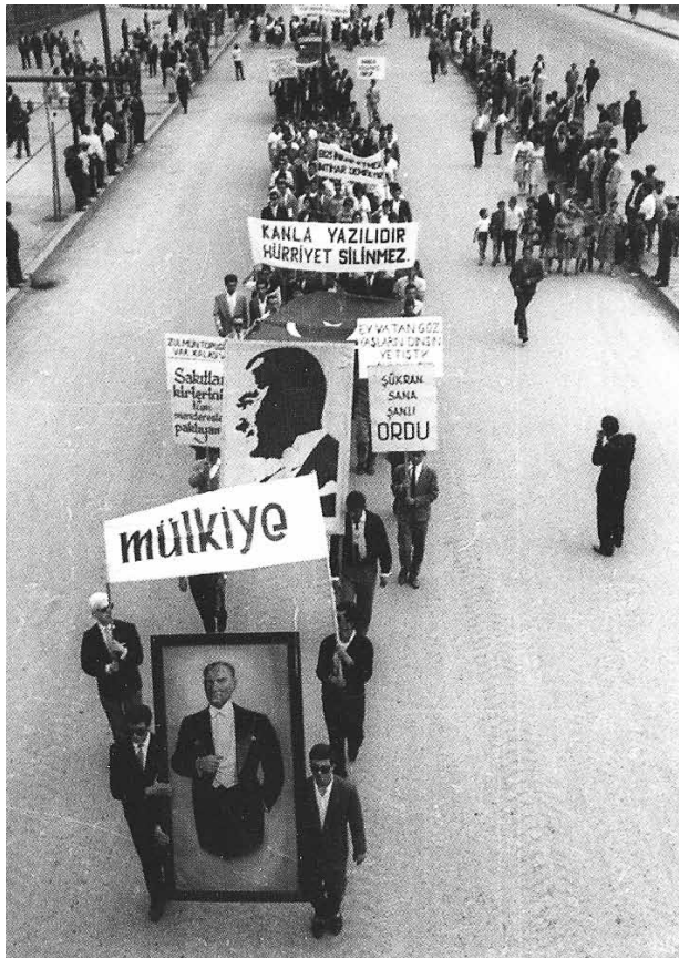
27 Mayıs sonrası Ordu'ya teşekkür gösterilerinden birinde Mülkiyeliler.