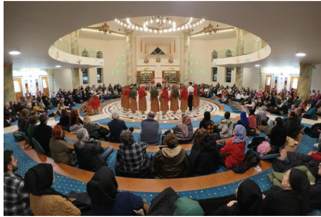
Görsel 4 4

Alevi-Bektaşî inanç sisteminde “Görgü Kurbanı” ya da “Tercüman Kurbanı” olarak da adlandırılan Görgü Cemi, tarikata ikrar vererek dâhil olmuş bir tâlibin, yol içerisindeki konumunu ve manevi durumunu değerlendirdiği önemli bir erkândır. Kural olarak her yıl kış aylarında gerçekleştirilen bu cem töreninde, “On İki Hizmet” düzeni uygulanmakta ve tüm tâlipler yıllık olarak bir kez cem meydanında görgüden geçirilerek sorgulanmaktadır. Bu uygulama, aynı zamanda tâlibin ikrarını yenileme işlevi taşımaktadır (Rençber, 2013, s. 229). Nitekim tâlibe ilk ikrar anında yöneltilen “Gelme gelme, dönme dönme; bu yol demirden bir leblebidir, çiğnenmez” şeklindeki uyarılar bu cemde yeniden hatırlatılmaktadır. Görgü sürecine katılan tâlipler, geçmişte işledikleri olası kusurları tekrar etmemek üzere Hak Meydanı’nda söz vererek yemin ederler. Bu bağlamda görgü, bireyin manevi temizliğini ve toplulukla bütünleşmesini sağlayan bir arınma ritüelidir. Görgüden geçen ve arınmış sayılan tâlip, cem sonrası manevi saflığın simgesi olan görgü kurbanının lokmasından yiyerek yeniden topluluğa dâhil olmaktadır (Ersal, 2016, s. 200; Görsel 4).