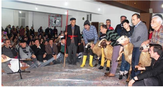
Görsel 5 5