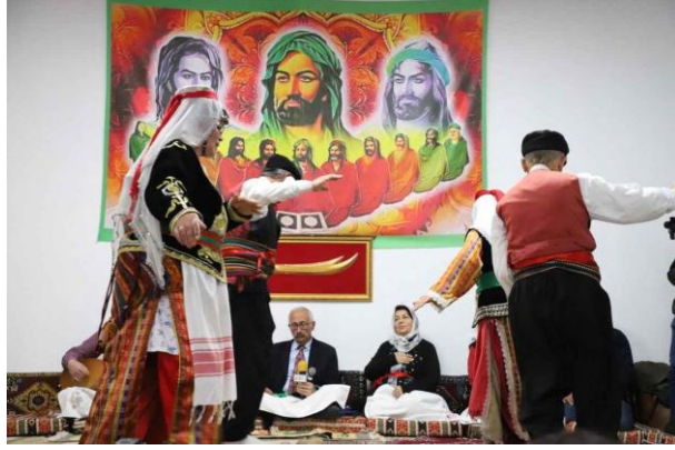
Görsel 2 2

Nevruz ve Hıdırellez günlerinde, Alevi-Bektaşî inancına mensup bireyler sabahın erken saatlerinde uyanarak en yeni ve temiz giysilerini giyerler. Maddi imkânlarına göre bazıları kurbanlık hayvan getirirken, bazıları ise sembolik olarak süt gibi beyaz ve saf yiyeceklerle cemevine katılırlar. Bektaşî topluluklarında cemevine getirilen hem kanlı hem de kansız kurbanlar, hizmet yürütmekle görevli nakiplere teslim edilir. Nevruz erkânı, Bektaşîler açısından yalnızca bir tören değil, aynı zamanda bir dizi ritüel içeren kutsal bir ibadet sürecidir. Ayınların ardından süt içilmesi büyük önem taşır; Nevruz günü ve onu takip eden üç gün boyunca süt içilmesi, ayrıca yumurta ve badem içi gibi yiyeceklerin tüketilmesi gelenek hâlini almıştır. Bu süreçte özellikle beyaz renkli, sade ve temiz gıdaların tercih edilmesi dikkat çekicidir. Beyaz renge gösterilen bu özel ilgi, Hacı Bektaş Velî'ye atfedilen “alın açıklığı, sofrâ açıklığı ve gönül açıklığı” anlayışıyla da bütünleşerek ritüelin anlam katmanlarını derinleştirmektedir (Uçkun, 2005, s. 165).