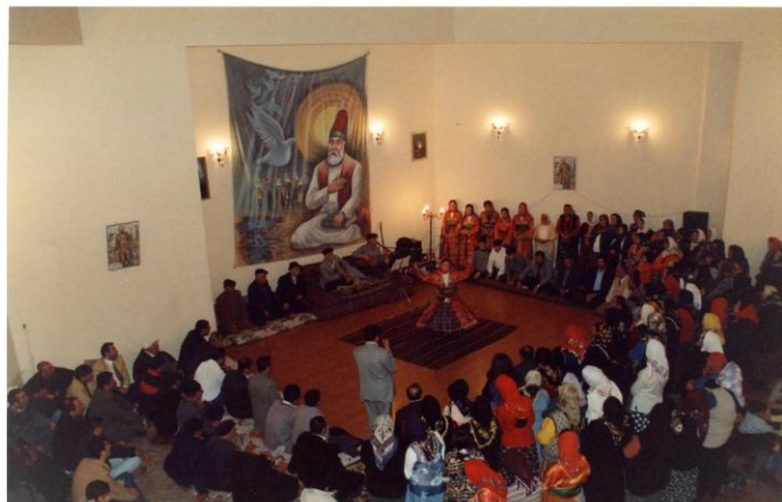
Görsel 3 3

Her yıl şubat ayınının 13, 14 ve 15. günlerinde üç gün süreyle tutulan Hızır orucu, Alevi-Bektaşî inanç pratiğinde önemli bir yere sahiptir. Oruç sürecinin ardından, son gün Hızır kurbanı kesilerek “Hızır Cemi” icra edilir ve Hızır Nebî'nin manevi varlığı anılır. Toplumun geniş kesimlerinin katılımıyla gerçekleştirilen bu cem erkânında, zorluk içinde olanlara yardım eden, çaresizlerin imdadına yetişen Hızır figürü hatırlanır ve yüceltilir. Cem esnasında dedeler, Hızır'a atfedilen menkıbeleri ve tarihsel anlatıları paylaşarak ritüelin anlamını pekiştirir; bu sayede cem, hem kolektif hafızanın canlı tutulduğu hem de toplumsal dayanışmanın güçlendiği bir inanç ve kültür buluşmasına dönüşmektedir (Zanco, 2019, s. 52; Görsel 3).