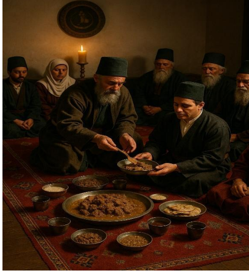
Görsel 1 1