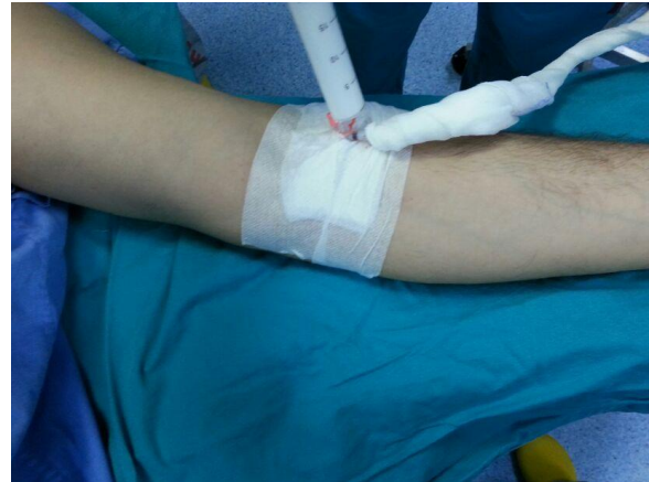
Resim 1: Serum setinin hasta ile temasının önlenmesi

%94 idi. Plastik tek kullanımlık solunum devresi ve silikon şeffaf yüz maskesi kullanılarak üç dakika preoksijenasyonu takiben anestezi 1 mcq/ kg fentanil ve 2,5 mg kg -1 propofol ile anestezi indüksiyonu yapıldı. Kas gevşetici olarak 0,6 mg/kg rokuronyum uygulandı. Entübasyonda polivinil klorür (PVC) disposable iç çapı 7,5 mm olan spiralli endotrakeal tüp kullanıldı. Tüp tespitinde flaster yerine gazlı bez kullanıldı. Anestezi idamesi %50 oksijen- %50 azot protoksit içinde 1–1,2 MAC sevofluran ile yapıldı. Hasta 550 ml tidal volüm ile ve solunum sayısı, end-tidal CO2 değeri 32–35 mmHg olacak şekilde ayarlanarak 4L/dak taze gaz akımıyla ventile edildi (GE Datex-Ohmeda S/5 ADU, Wisconsin, ABD). Cerrahi ve anestezi ekibi lateks içermeyen eldiven kullandı. Yaklaşık 30 dakika süren operasyon boyunca hastanın hemodinamik verileri ve oksijen saturasyonu stabil seyretti. Postoperatif analjezi amacıyla 1 mg/kg tramadol (Tramadolor ampül, Sandoz, Kocaeli, Türkiye) iv yapıldı. Hasta spontan solunumu döndükten sonra sugammadex 1 mg/kg yapılarak ekstübe edildi. Modifiye Aldrete Skoru 10 olduktan sonra da bir saat derlenme odasında gözlemlenerek takip edildi. Herhangi bir alerjik reaksiyon gelişmeyen hasta servise devredildi. Hasta ertesi gün cerrahi veya anesteziye bağlı herhangi bir komplikasyon olmaksızın taburcu edildi.