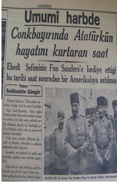
(Cumhuriyet, 24 Ocak 1939)

olan vatandaş onu milletin müzesine hediye etmek dururken bir yabancı memlekete satmaya kalksın. Elbette Türk hükümeti, bu vatandaşın fedakârlığını karşılıksız bırakmaz ve en müsait şekilde ona tarihi şükran borcunu öder. Çünkü Conkbayırı'nda düşman kurşununu geriye iten saat yalnız Atatürk'ün değil, Çanakkale'de ve Kurtuluş Savaşı'nda bütün Türk yurdunun hayatını kurtarmıştır. Bu saat eğer Türkiye'de ise bir fabrika reklamı olarak memleket hudutlarından dışarıya atılmak için değil, kendisini Türkün yüreğine siper eden bir milli şuur sembolü olarak müzelerimizde saklanmak için son bahtiyar sahibinin elinde hükümetin bir davetini bekliyor. Dünyada, bu derecesinde bile, hiç şüphesiz pek çok sağlam İsviçre saati vardır; fakat ebedi hatırasıyla bizim ana yurdumuzda biriciktir. O adamdan bu toprağa yadigâr kalan hatıralar arasından kimseye zırnık veremeyiz.” 19