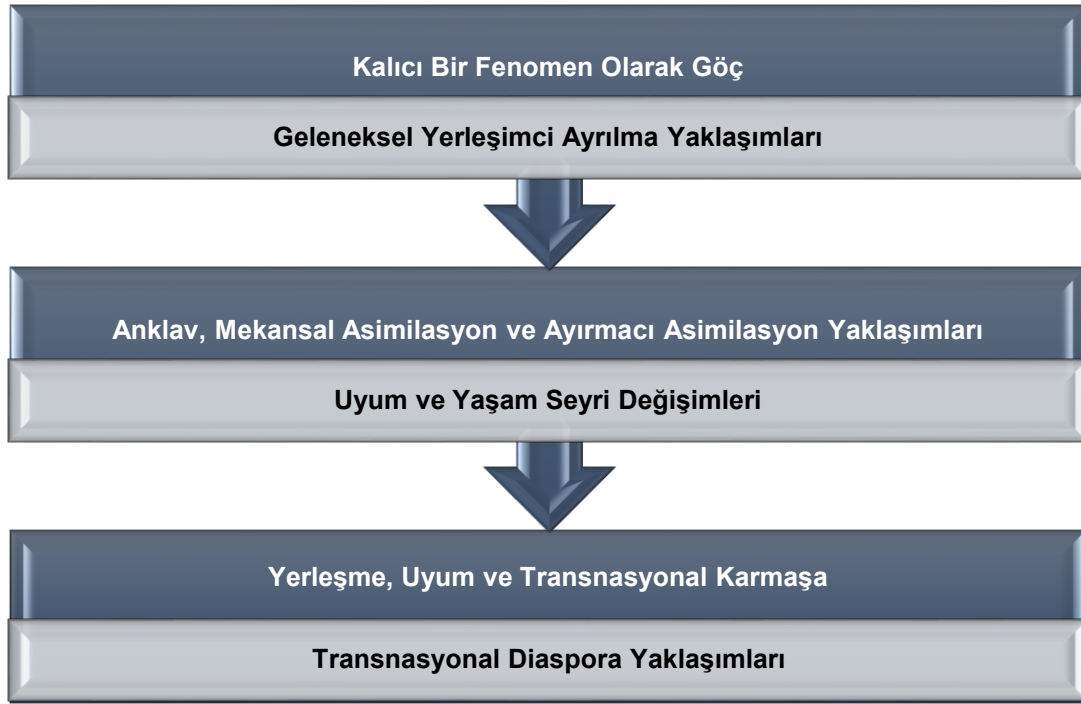
Şekil: 2 Uluslar arası Göç Paradigmaları (Kaynak: Burnley, 2016)

Sosyal hizmet bilim ve mesleği de göç konusunda farklı bilim dallarında ortaya çıkan çalışmalardan ve paradigmalardan beslenmektedir. Günümüzde göç çalışmaları kapsamında psikolojik, demografik ve sosyolojik kavramları içeren uyum ve yaşam seyri değişimleri ile transnasyonal yaklaşımlar öne çıkmaktadır (Diewald ve Mayer, 2009). Yaşam seyri yaklaşımı, insanların doğum, evlilik ya da göç ile ilgili yaşadıkları süreçleri incelemektedir. Bireyler yaşamları boyunca içine doğdukları sosyal yapılar ile öyle bağ kurmuşlardır ki, göç etseler de menşe ülkelerdeki tanıdıkları ile bağlarını devam ettirme eğilimindedirler. Bu nedenle okula gitme, çalışma yaşamı, kariyer gelişimi ya da yaşlanma gibi yaşam olayları göç ile kesişir. Bu yaklaşım ile yerleşme ve uyum kavramlarının transnasyonal açıdan değerlendirilmesine ihtiyaç duyulmaktadır (Burnley, 2016).