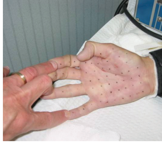
Şekil 3: Palmar botoks uygulaması (66).

Diğer tedavilerden cevap alınamayan kişilerde kullanılması uygun olur. Miyastenia gravis, Eaton-Lambert sendromu gibi nöromusküler hastalıklar ve motor nöron hastalıklarında kullanılmak sakıncalıdır. Uygulamadan bir gün önce antiperspiranlar kullanılmıyaz. Temiz cilde gerekirse lokal anestezi ile insülin iğnesi kullanılarak 1,5-2 cm aralıklı hiperhidrozis için belirlenmiş standartlara uygun botoks subkutan uygulanır (61, 63).