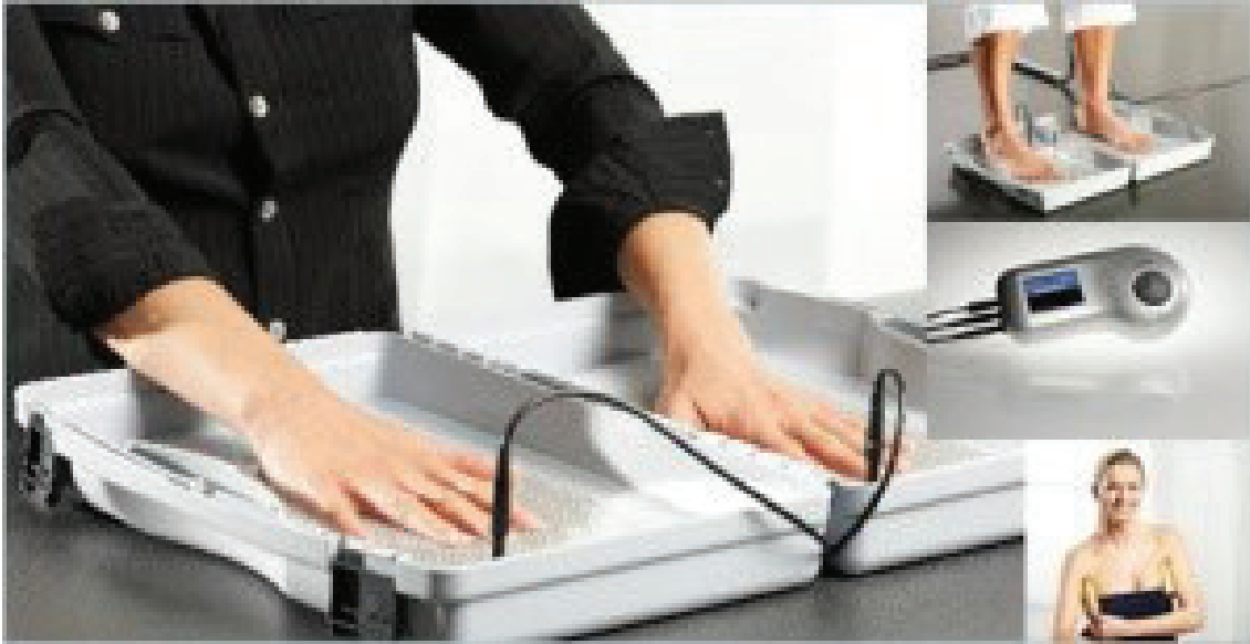
Şekil 4: Bir elden diğer ele galvanik akım uygulanarak yapılan palmar ve plantar hiperhidrosiz tedavisi (73).

İlk zamanlar, iyontoforez bir elden diğer ele, sulu bir ortamda çözünebilir antikolinergikler, metal tuzları, topikal ilaçlar eklenerek yapılmıştır. Bu nedenle adı iyon transferi anlamında iyontoforez olarak kalmıştır. Gerçekte bir galvanik akım tedavisidir (28, 70, 71, 72).