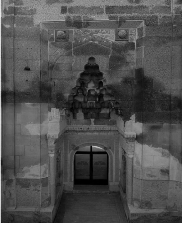
Fotoğraf: 1 - Zinciriye Medresesi'nin Doğu cephesi ve Giriş Porteli