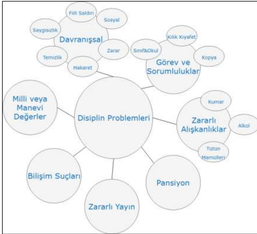
Şekil 1. Disiplin olaylarının sınıflandırılması

Yönetmeliğe göre olumsuz davranışlar ceza türüne göre tasnif edilmiştir. Bu çalışmada olumsuz davranışların kolayca bulunarak yönetmelikteki ceza türleriyle eşleştirilebilmesi için disiplin problemleri sınıflandırılmış ve bir model oluşturulmuştur. Şekil 1.'de görülen bu modelde, disiplin problemleri başlıca davranışsal problemler; görev ve sorumluluklarla ilgili problemler; zararlı alışkanlıklar; pansiyonla ilgili problemler; zararlı yayımlar; bilişim suçları; milli ve manevi değerlerin korunması ile ilgili problemler olarak yedi ana grupta sınıflandırıldı.