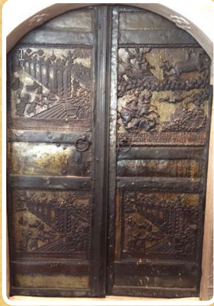
Resim 9. Surp Hreşdagabet Kilisesi, narteks kapısı.

Kilisede iç mekanda yüksek altların solundaki Meryem Ana'nın mucizevi betiminin Karagümrük'te yangında harap olan Hagios Ioannes Krisosthomos Kilisesi'nin Theodokos Petras Ayazması'ndan getirildiği sanılmaktadır. Narteksin önünde ise iki demir kanat ve kabartmalı dört panelden oluşan kapı yer alır (R. 9). Kapı üzerindeki kabartmalardan bir tanesi St. George'un ejderi öldürmesi, diğer üç tanesi ise İsa'nın tapınaktan tüccarları kovması konusundadır.