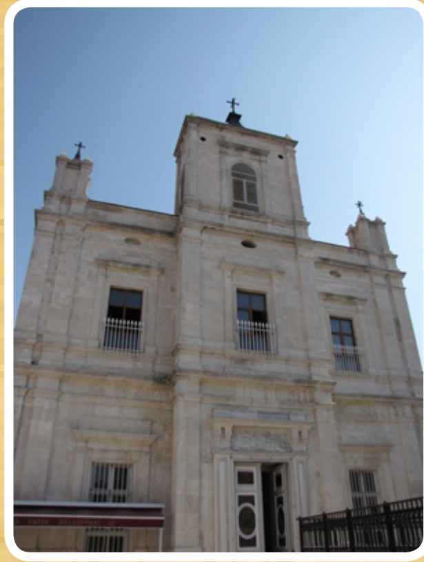
Resim 2. Surp Kevork Kilisesi (Sulu Manastır), Batı cephesi ve giriş, Samatya, Kocamustafapaşa,(Fotoğraf: L.Y.)

İzmit'teki Armaş (bugün Akmeşe) Ruhban okulu ve manastırı kitaplığında bulunan bir kitabeğe göre Samatya'da Ermenilere verildikten sonra Surp Astvadzazin adını alan kilise, 1722'de Melidon Araboğlu tarafından yeniden yaptırılmıştır. Yapıya Surp Yerrortutyun adında bir şapel eklenmiştir. Kilise ve şapellerin adı Surp Kevork, Yerrortutyun ve Asdvadzazin olmuştur. 5 Kilisede azizlere ait röliklerin korunduğu kayıtlara geçmiştir. Nazianoslu Gregorios'un kafatası, Aziz Nikolaos'un kemikleri, Aziz Stephanos'un çene kemiği, Khalkopratia'dan geldiği düşünülen Simeon'a ait kemikler, İspanyol elçi Clavijo'nun kaydettiğine göre Masumların Katli'ne ait kemikler, din şehidi Tatiana'ya ait kemikler, ayrıca bir görüşe göre Vaftizci Yahya'ya ait rölikler 6 de bu kilisede bulunmaktaydı. 7 Yapı tüm bu röliklere sahip olması nedeniyle Bizans devrinin değer taşıyan kiliseleri arasındaydı.