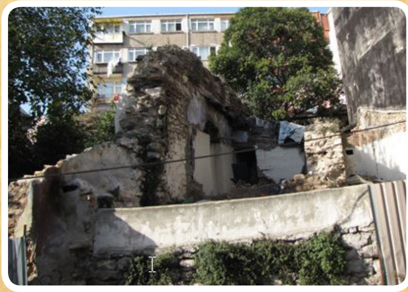
Resim 3. Edirnekapı Odalar Camii, günümüzdeki duvar kalıntılarının yapıya ait olduğu düşünülmektedir, (Fotoğraf: L.Y.)

Yapının camiye çevrilmesinin ardından Latinler tarafından Madonna di Constantinopoli (Konstantinopolis'in Meryem Ana'sı) olarak adlandırılan ikona, Galata Balyosu tarafından satın alınarak Galata San Pietro Kilisesi'ne bağışlanır. 1919 yılında bölgede çıkan yangında kilise yandıktan sonra uzun süre yıkıntı olarak kalır. Yapı 1935 yılında P. Schazman tarafından incelenmiştir. Mahzende meleklerle çevrili tahtında oturan Meryem, alt kilisede Deesis betimi, Aziz Merkurios ve peygamberler, üst kilisede Meryem'in yaşamından sahnelerin konu alındığı freskler belirlenir. Yapı, 1950-1960'lı yıllarda semtte inşa edilen yapılar nedeniyle ortadan kalkmıştır. 16 1965 yılında, üstteki kilisenin yamaç yönündeki kuzey bölümü tamamen yok olmuş, diğer bölümlerine ait duvarlar ise yer yer 3-4 m yüksekliğinde günümüze ulaşmış durumdadır. 17 Çalışma sırasında Odalar Camii'nin bulunduğu belirtilen caddede bazı duvar kalıntılarına rastlanmıştır (R. 3).