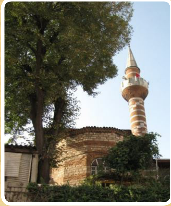
Resim 4. Kefeli (Kefevi) Camii doğu cephe. Kiliseden kalan apsis ve Osmanlı devri eklenen minaret, (Fotoğraf: L.Y.)

larla özgünlüğünü yitirdiği belirlenmiştir.