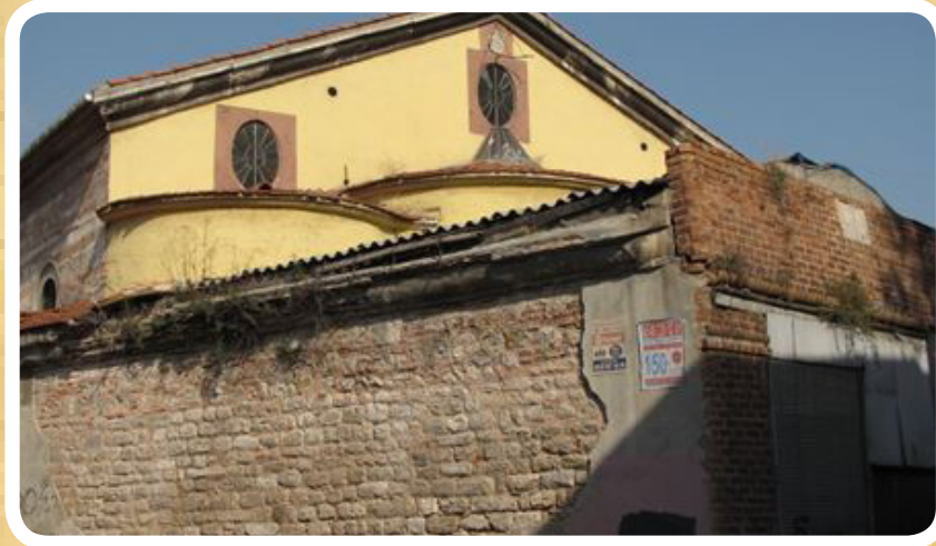
Resim 8. Surp Hreşdagabet Kilisesi,doğu cephesi,üçlü apsis çıkıntısı

"Tanrının merhametiyle bu kutsal kilisenin inşası Patrik Mgr. Stefanos (Etienne) tarafından Ermeni topluluğu tarafından gerçekleştirilmiştir. 7 Eylül 1835." 25