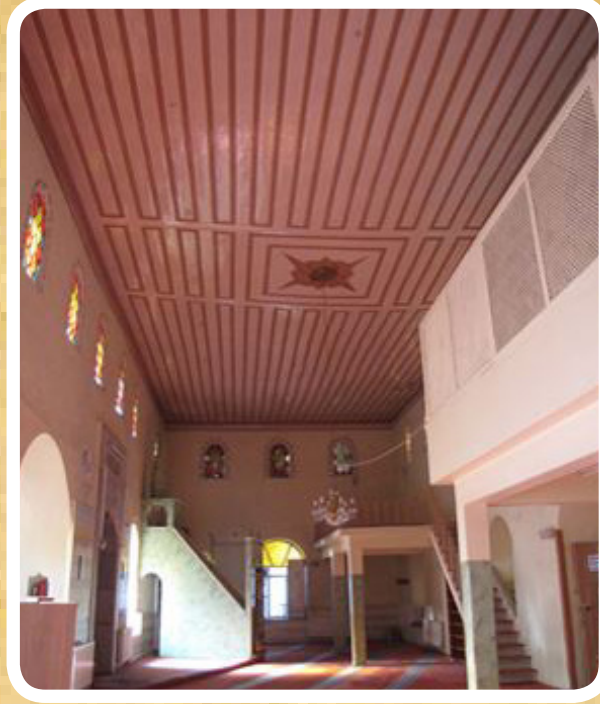
Resim 6. Kefeli (Kefevi Camii), iç mekan kuzey-güney aksından görünüm, doğu duvarında Osmanlı devrinde eklenen mihrap ve minber, batı duvarında ahşap direklerle yükseltilmiş kadınlar mahfili