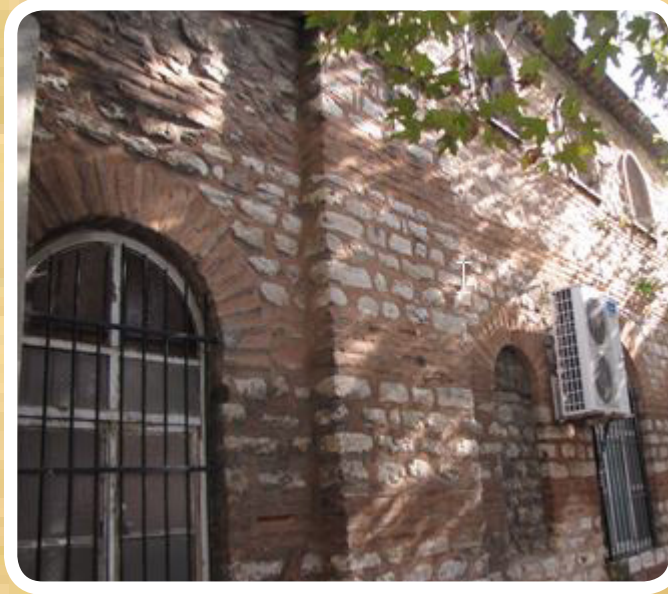
Resim 5. Güney cephe, tuğla ve kesme taş sıralı duvar örgüsü ve yuvarlak tuğla kemerli pencereler, (Fotoğraf: L.Y.)