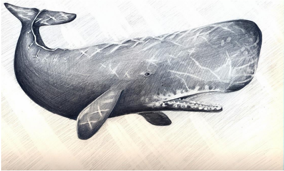
Resim 1 İspemeçet Balinası

Cumhurbaşkanlığı'na bağlı Devlet Arşivlerindeki kayıtlara göre mum imali 1560'a kadar dayanmaktadır. Bu tarihten 1858'e gelinceye kadar çeşitli usul ve yollarla mum yapılmıştır. Mumcu esnafının uyacakları usul ve esaslar ise zaman zaman çıkarılan fermanlarla belli bir düzene sokulmuştur. Bu kısa girişten sonra burada söz konusu olacak müessese yakın tarihimizde mühim bir yeri olan Beykoz Mum Fabrikası diğer adıyla İspemeçet Mumu Fabrikası'dır. Bu fabrika ile ilgili " Mum Kitabı " adlı eserde yer almayan bir konu işlenecektir (Mert, 2015). Bu konu, fabrikanın o zaman kullanılan âlet, edevat ve eşyası ile ilgilidir. 2015'te yapılan ilk çalışmada bu belge arşiv kayıtlarında bulunmuyordu.