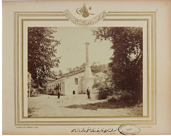
Resim 2 İstanbul'da yeni yapılan İspirmeçet Fabrikası: İspirmeçet Mumu Fabrikası'nın eski makine dairesi