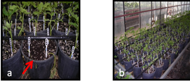
Şekil 2. Testlemeden 9 gün sonra başlayan ölümler (a), testleme serasından genel görünüm (b)