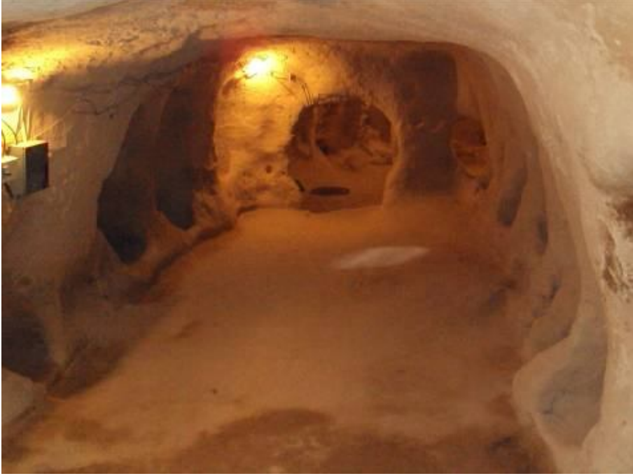
Resim 5: Güvercinkaya Kazı Evi