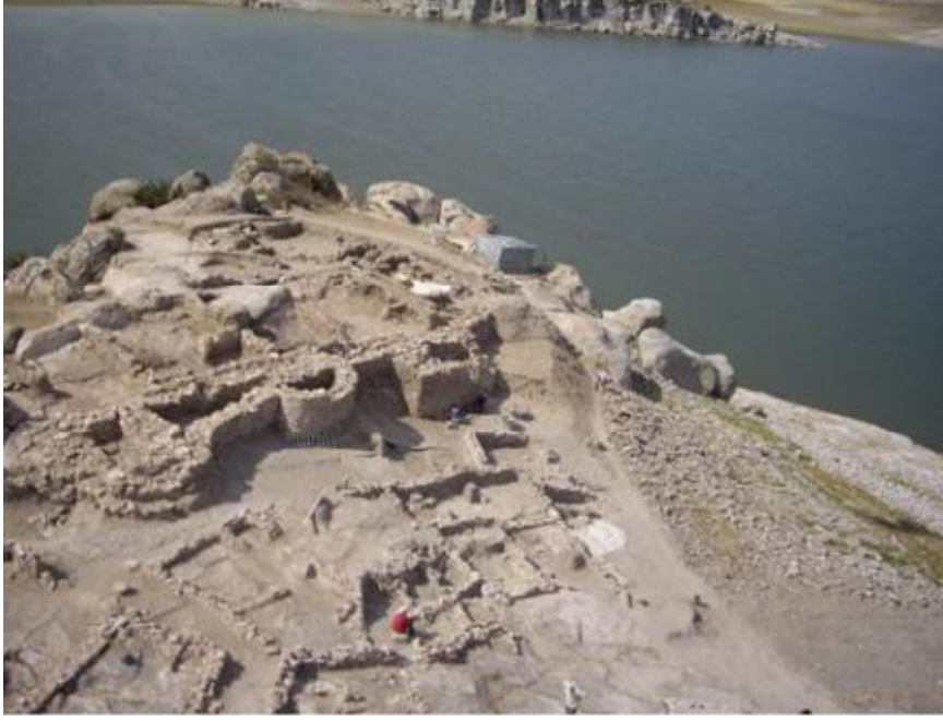
Resim 3: Güvercinkayaşı Yerleşmesi'nin Dar Sokaklarla Sınırlanan Bitişik Düzendeki Yapı Adaları