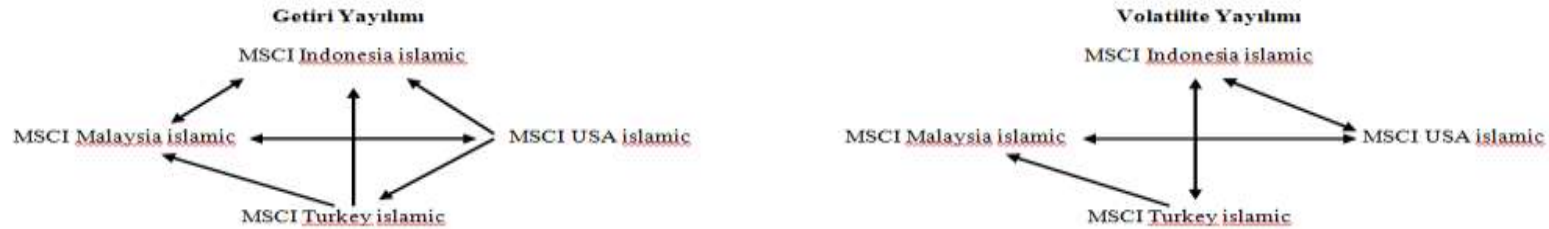
Şekil 3: VAR(4)-EGARCH(1,1) Model Sonuçlarına Göre Getiri ve Volatilite Yayılımlarının Yönü