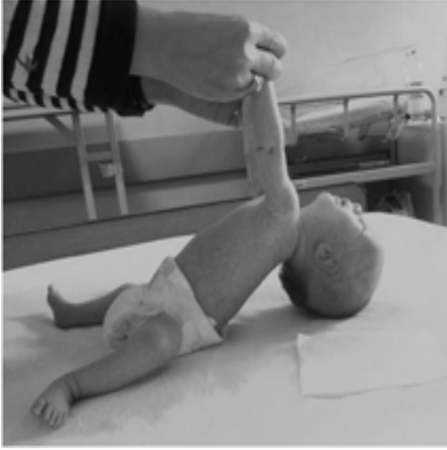
Resim 1d. Traksiyon