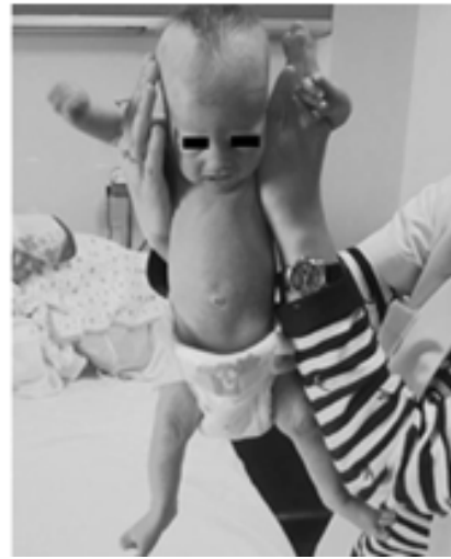
Resim 1b. Aksiler suspansiyon