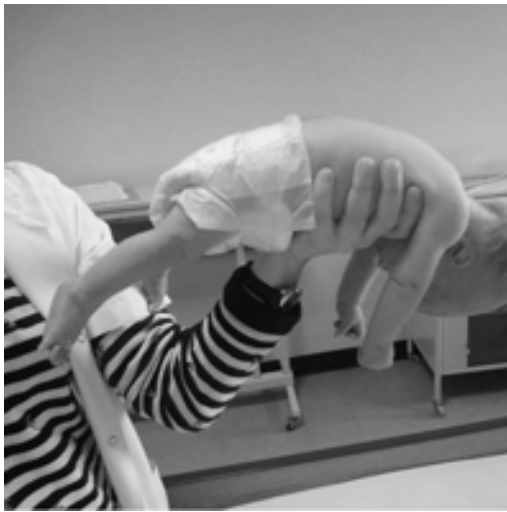
Resim 1a. Ventral suspansiyon

*Prasad AN, Prasad C. The floppy infant: contribution of genetic and metabolic disorders. Brain Dev 2003;25:457-76