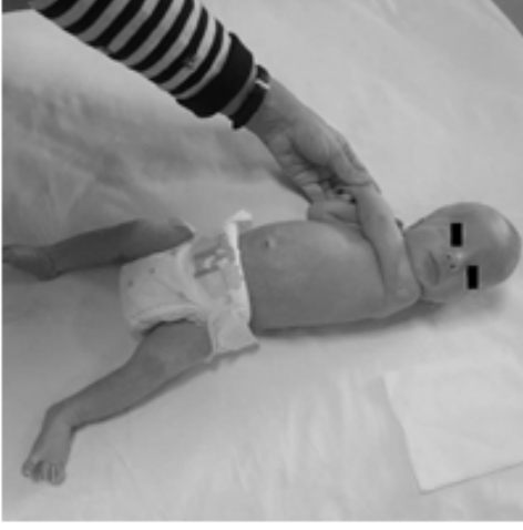
Resim 1c. Eşarp işareti