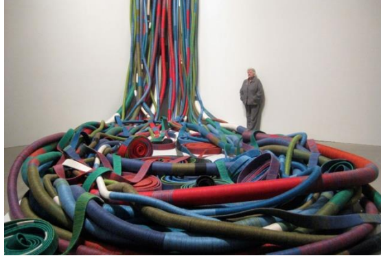
Resim 5: Olga de Amaral, "Sol Rojo Doble"2013.