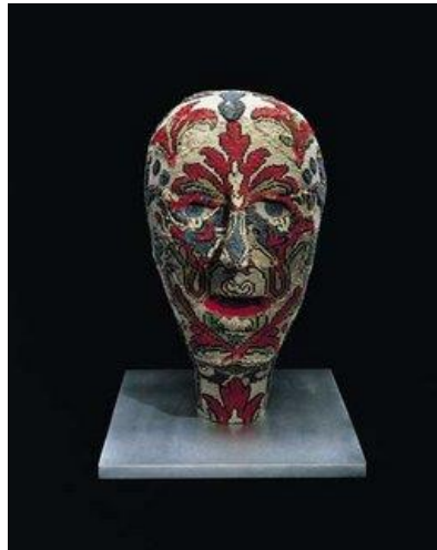
Resim 9: Louise Bourgeois, "Untitled", goblen ve alüminyum, 43.1 × 30.4 × 30.4 cm, New York, 2002.

Pek çok tekstil sanatçısı geleneksel teknikleri kendi çalışmaları için bir başlangıç noktası olarak kullanmış olmasına karşın, etkili, minimalist sanat üretimleri yaratabilmek adına yerleşik uygulamaları yıkmaya yönelik çalışmalar gerçekleştiren Louise Bourgeois, geçmişte yaşadığı tutku ve gerilimlerini yansıtmak için ipler ve kumaşları kullandığı eserler yaratmıştır. Bourgeois'in çalışmaları da Judy Chicago gibi, feminist esinli olmuştur. Tekstil heykel ve enstalasyonları ile Bourgeois feminist hareketi desteklemiştir.1960'larda hem erkek hem de kadın cinsiyetini konu almış işleri ile hafızanın yeniden inşasına odaklanmıştır. Günümüz sanatına disiplinler arası sanat yaklaşımlarıyla öncülük etmiş hem de uzun ömrüne sığdırdığı üretimlerini 2010 yılına kadar (son yıllarda asistanı yardımıyla) devam ettirmiştir. Sanatçı 2002-2008 yılları arasında tekstil heykel ve yerleştirme çalışmaları gerçekleştirmiştir. Kendi kıyafetlerinden ve ev eşyalarından dönüştürdüğü kumaşları çalışmalarında kullanmıştır (Resim 9). Bazı kumaş parçaları, elli yılı aşkın bir süredir saklanan, bir günlük gibi anlamlar yüklenmiş hatıraları bünyesinde barındıran giyisilerdir ve sanatsal objelere dönüştürülmüştür.