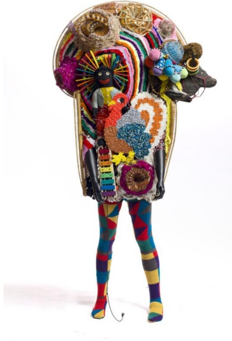
Resim 11. Nick Cave: “Soundsuit”, mixed media,86 x 48 x 39 cm.,2011.