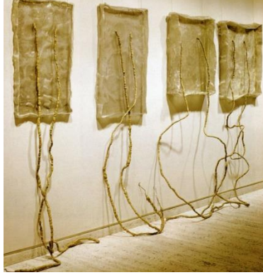
Resim 8: Eva Hesse, "No Title", Tel örgü ,lateks kumaş, ve tel üzerine cam elyaf 2.31x3.75x1.08 m,1970.

Pek çok tekstil sanatçısı geleneksel teknikleri kendi çalışmaları için bir başlangıç noktası olarak kullanmış olmasına karşın, etkili, minimalist sanat üretimleri yaratabilmek adına yerleşik uygulamaları yıkmaya yönelik çalışmalar gerçekleştiren Louise Bourgeois, geçmişte yaşadığı tutku ve gerilimlerini yansıtmak için ipler ve kumaşları kullandığı eserler yaratmıştır. Bourgeois'in çalışmaları da Judy Chicago gibi, feminist esinli olmuştur. Tekstil heykel ve enstalasyonları ile Bourgeois feminist hareketi desteklemiştir.1960'larda hem erkek hem de kadın cinsiyetini konu almış işleri ile hafızanın yeniden inşasına odaklanmıştır. Günümüz sanatına disiplinler arası sanat yaklaşımlarıyla öncülük etmiş hem de uzun ömrüne sığdırdığı üretimlerini 2010 yılına kadar (son yıllarda asistanı yardımıyla) devam ettirmiştir. Sanatçı 2002-2008 yılları arasında tekstil heykel ve yerleştirme çalışmaları gerçekleştirmiştir. Kendi kıyafetlerinden ve ev eşyalarından dönüştürdüğü kumaşları çalışmalarında kullanmıştır (Resim 9). Bazı kumaş parçaları, elli yılı aşkın bir süredir saklanan, bir günlük gibi anlamlar yüklenmiş hatıraları bünyesinde barındıran giyisilerdir ve sanatsal objelere dönüştürülmüştür.