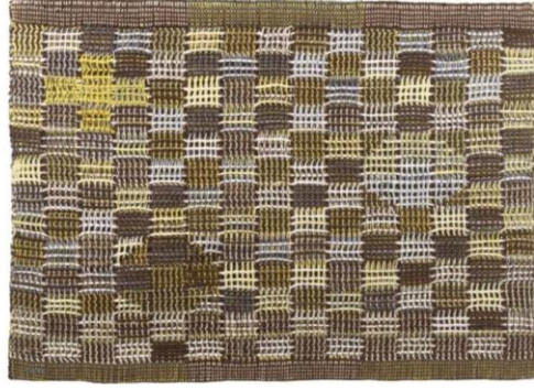
Resim 3: Anni Albers,54.6x74.9 cm., Wadsworth Atheneum Sanat Müzesi, 1957.

Sheila Hicks, büyük ölçekli fiber (lif) enstalasyonları ile (Resim 4), Olga de Amaral da gümüş yaprak kaplı soyut dokumaları ile tekstil ve lifi yeni bağlamlarını ile tekrar ele almış, malzemenin sosyal ve kavramsal etkilerini keşfetmeye başlamışlardır (Resim 5).Böylelikle tekstil ve lif sanatçıların yolu açılmıştır.