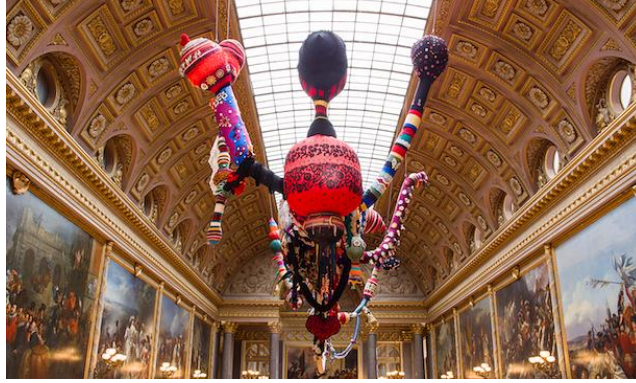
Resim 10: Joana Vasconcelos, "Valkyrie Trousseau," ,Versailles Sarayı, 2012.

Joana Vasconcelos'un yaratıcı sürecinin doğası, önceden var olan nesnelerin ve gündelik gerçekliklerin tahsis edilmesine, ayrıştırılmasına ve yıkılmasına dayanmaktadır. Kamusal alandaki alana özgü müdahaleler, Vasconcelos'un çalışmalarında özel bir önem taşır. Renk ustalığının yanı sıra performanslara ve video veya fotografik kayıtlara başvuran sanatçı, tekstil heykel ve enstalasyonlar gerçekleştirmektedir (Resim 10).