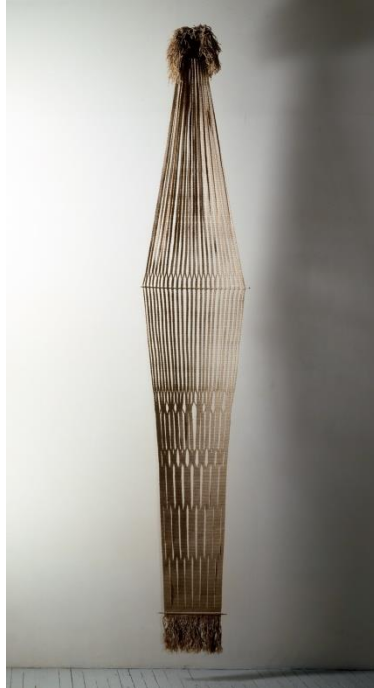
Resim 7: Lenore Tawney,” Fountain”, Keten ve metal,105 x 17 x 2 m. Sanat ve Tasarım Müzesi, NY, 1966.

Eva Hesse'nin kauçuk, yarı saydam cam elyafı ve lateks gibi alışılmamış malzemeler kullanması onu 1960'ların en özgün ve etkili heykeltıraşlarından biri haline getirmiştir. Soyut olmasına rağmen, heykelleri bedene referans vermiş ve görünüşte birbiriyle çelişen kadın-erkek, yumuşak-sert, özgür-sınırlı çağrışımları ifade etmiştir. Post-Minimalizm'in bir parçası olarak düşünülen Hesse'nin heykelleri, Minimalizm'in egemen olduğu on yıl içinde