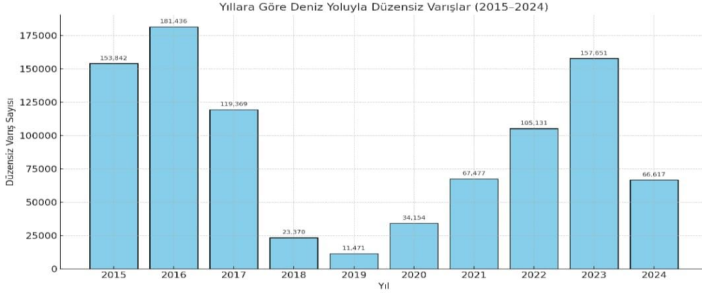
Şekil 2: İtalya'ya Yıllara Göre Yoluyla Düzensiz Varışlar (2015-2024)

Grafiğin oluşturulmasında Birleşmiş Milletler Mülteciler Yüksek Komiserliği Operational Data Portal'dan yararlanılmıştır. 2