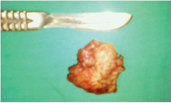
Resim 2. Total eksize edilen etrafı fibrotik solid kitle